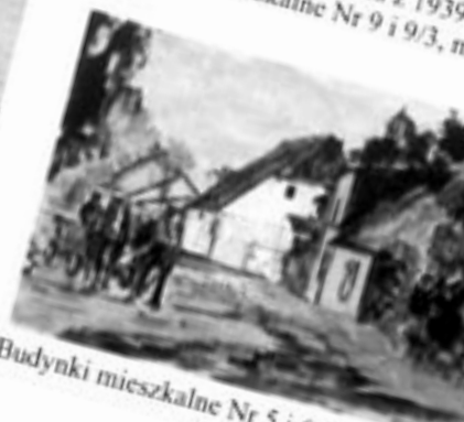
Budynki mieszkalne Nr 5 i 6 przy