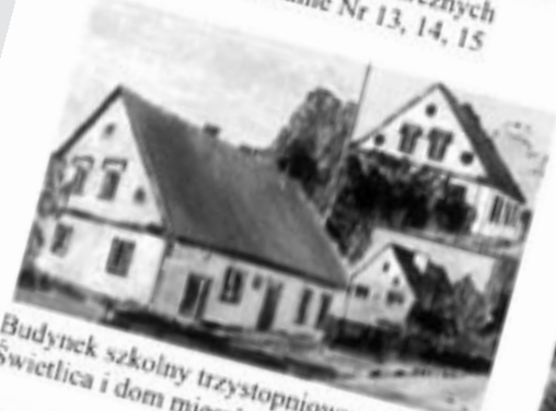
Budynek szkolny trzystopniowy z lat 20-tych, Świećlica i dom mieszkalny Nr 10, murowany.