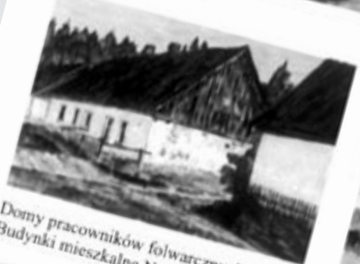
Domy pracowników folwarcznych Budynki mieszkalne Nr 13, 14, 15