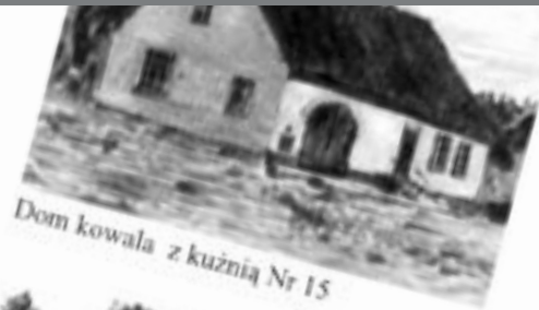
Dom kowala z kuźnią Nr 15