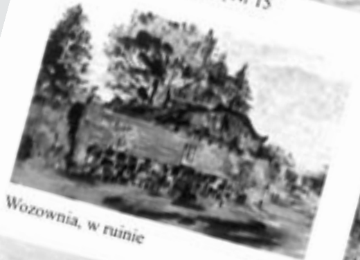
Wozownia, w ruinie