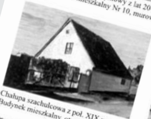
Chałupa szachulcowa z poł. XIX w., Budynki mieszkalny, otynkowany, Nr 6,