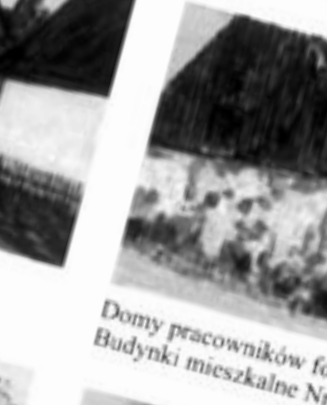
Domy pracowników folwarcznych Budynki mieszkalne Nr 9 i 9/3, m