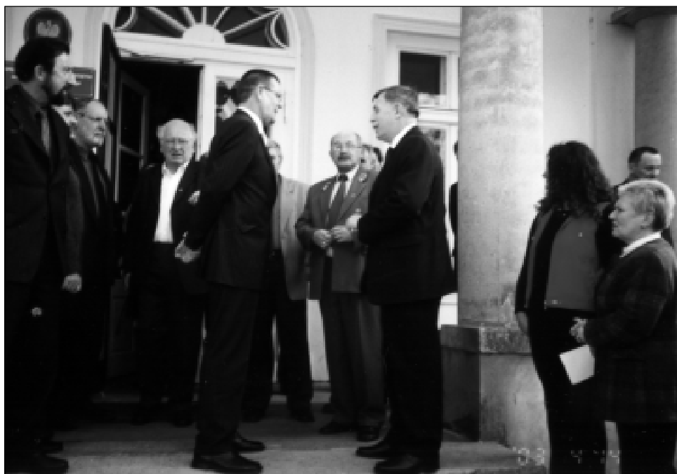
Niemieccy goście na dziedzińcu pałacu w Warcinie