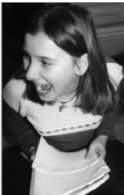
Każdy teatr wyzwala emocje...

koracje sceniczne. Podczas zajęć muzyki i rytmiki uczą się śpiewać, poruszać w rytm muzyki, operować kukiełką. W trakcie prób pracuje się z każdym dzieckiem indywidualnie. Wspólnie wykonywany jest plakat do przedstawienia z wykorzystaniem sztuki komputerowej. Ten cykl różnorodnej pracy z dziećmi przyczynia się do twórczego rozwoju osobowości i umiejętności wychowanka niepełnosprawnego umysłowo. Uczniowie sami dostrzegają celowość i zasadność wykonywanych prac. Moment premiery to dla każdego wielkie święto. Świadomość dziecka, że dzieje się „coś” niepowtarzalnego, wyjątkowego i ono może być współtwórcą tego misterium, przynosi nam, nauczycielom i wychowawcom sporo satysfakcji. Praca nad przedstawieniem daje sporo pożytku. Dzieci „oswajają” się z mikrofonem. Do nagrywania tekstów włączają się dzieci niechętnie skłaniające się do nagrań lub dzieci mające zaburzoną komunikację werbalną. W przypadku tych drugich - nagrywanie dotyczy pojedynczych wyrazów lub okrzyku. Zaangażowanie wszystkich uczniów wpływa na ich samoocenę. Każde dziecko czuje się prawdziwym „lektor