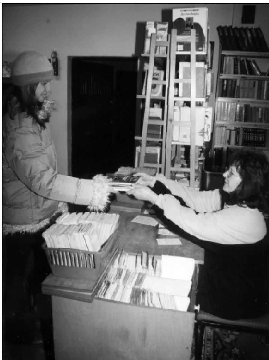
W ubiegłym roku biblioteki powiatu odwiedziło blisko 14 tysięcy czytelników - więcej niż w roku 2001

Często bibliotekarze zamykają biblioteki, by uczestniczyć w imprezach organizowanych przez domy kultury. Czytelnik, który niejednokrotnie pokonuje duże odległości, żeby dotrzeć do swojej biblioteki i zastaje zamknięte drzwi, prawdopodobnie drugi raz już nie przyjdzie. Specyfika pracy biblioteki i domu kultury jest też inna - biblioteka jest miejscem wyciszenia, skupienia, pracy umysłowej; domy kultury - wręcz przeciwnie. Dlatego w ustawie z 27 lipca 2001 roku o zmianie ustawy o bibliotekach (Dz. U. z dnia 12 listopada 2001 r.) – w artykule 13 dodano ustęp 7 w brzmieniu: “Biblioteki publiczne nie mogą być łączone z innymi instytucjami oraz