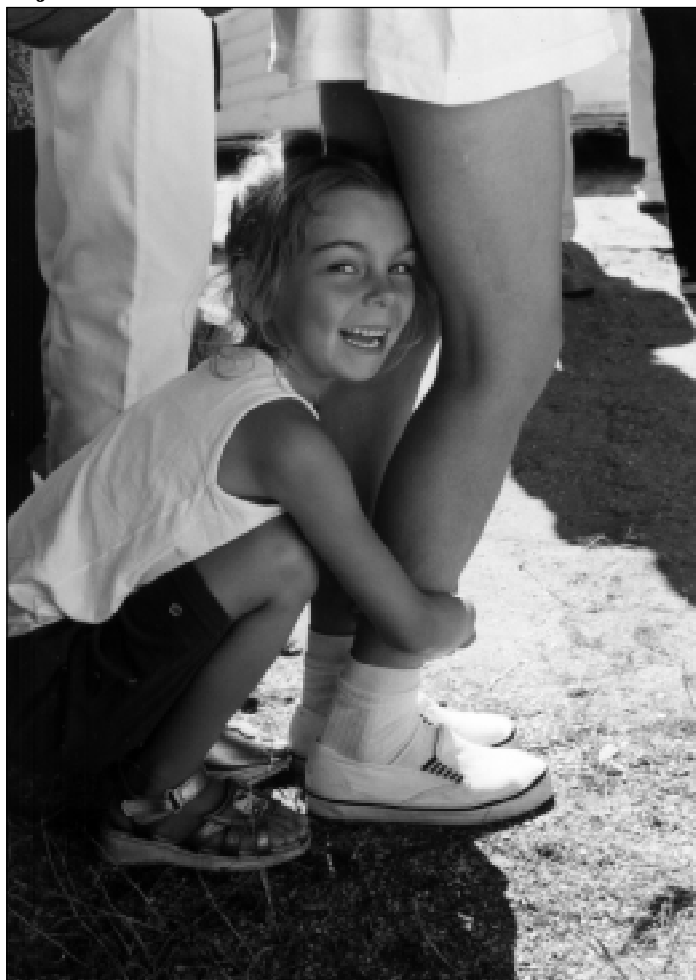
PUP nie dysponuje żadnymi ofertami pracy wakacyjnej

Marzec i kwiecień to miesiące, w których w Powiatowym Urzędzie Pracy w Słupsku zgłaszane są oferty pracy sezonowej. PUP nie dysponuje jednak żadnymi ofertami pracy wakacyjnej dla młodzieży szkolnej i studentów.