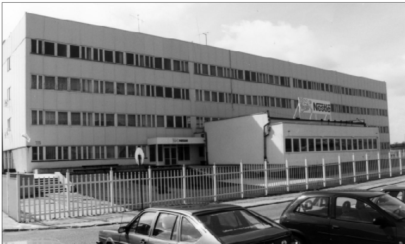
Zakład w Kobylnicy ma być przeniesiony na Węgry

Do Powiatowego Urzędu Pracy wpłynęły w maju zawiadomienia o zamiarze zwolnień, Wojewódzki Szpital Specjalistyczny w Słupsku zapowiedział zwolnienie 53, a zakład Nestle w Kobylnicy – 60 pracowników.