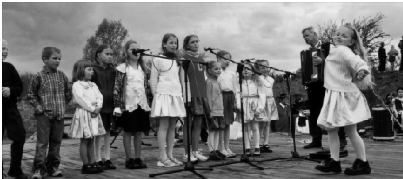
Występ dzieci ze Szkoły Podstawowej w Gardnie