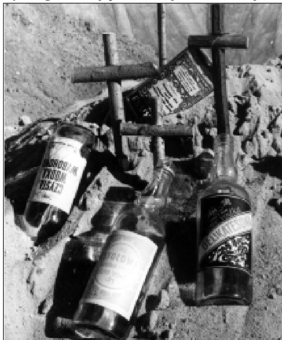
Cywilizacja - przemysł - dewastacja...

Obecnie uczę w drugiej klasie szkoły podstawowej. Nadal prowadzimy kącik ekologiczny, gazetkę, na której umieściliśmy elementarz ekologa. Tradycyjnie już zajęliśmy się, po raz kolejny, organizacją w naszej szkole akcji „Sprzątanie świata”.