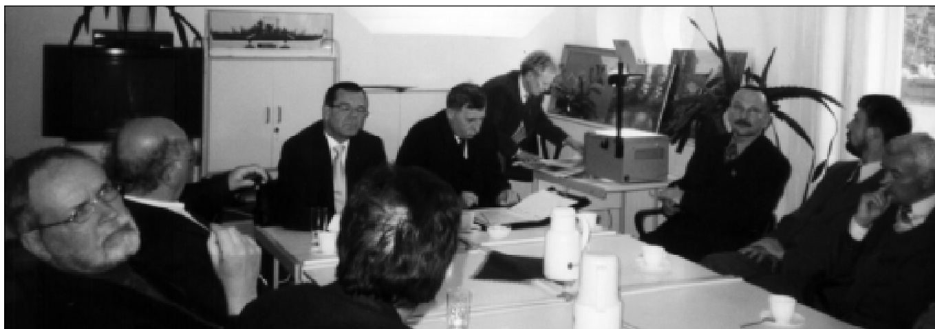
Rozmowy w Warcinie z udziałem obu starostów