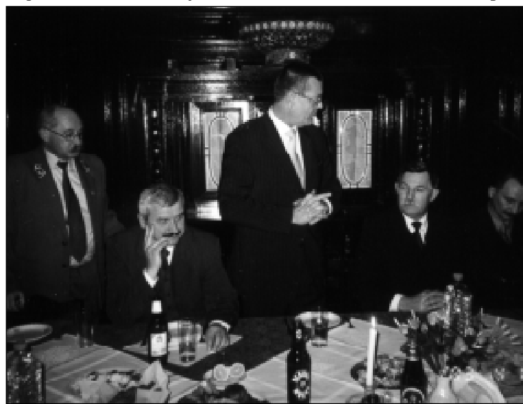
Podczas debaty w Zespole Szkół Leśnych i Ogólnokształcących w Warcinie goście mogli dowiedzieć się, jak Samorząd Powiatowy dba o szkoły ponadgimnazjalne w powiecie