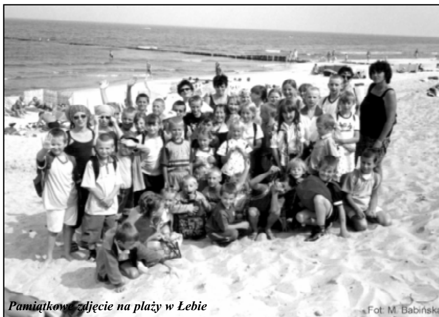
Pamiętkowe zdjęcie na plaży w Łebie