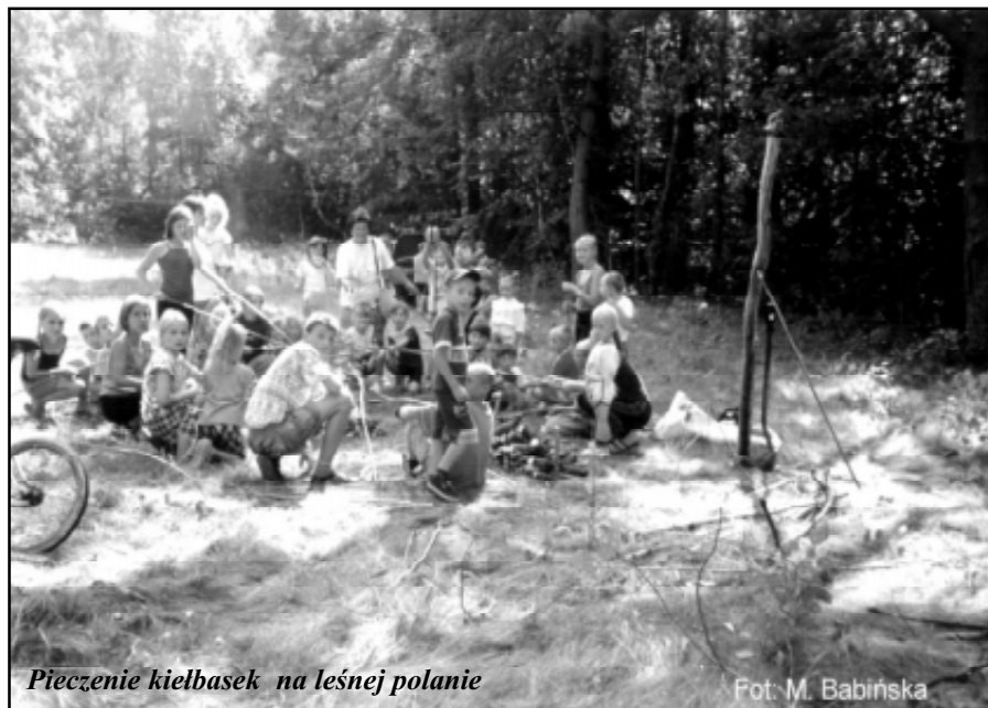
Pieczenie kiełbasek na leśnej polanie

Z przykrością muszę stwierdzić, że pomimo, iż program przewidywał realizację tematyki dotyczącej uzależnień, nikt z gminnej Komisji ds. Profilaktyki i Rozwiązywania Problemów Alkoholowych w Głównyzykach nie przyjął zaproszenia na nasze spotkania. Była to jedyna nasza porażka.