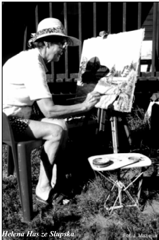
Helena Has ze Słupska

W dniach 27 sierpnia – 6 września w Izbicy odbył się IV Plener Plastyków Nieprofesjonalnych „Pomorskie Pejzaże”.