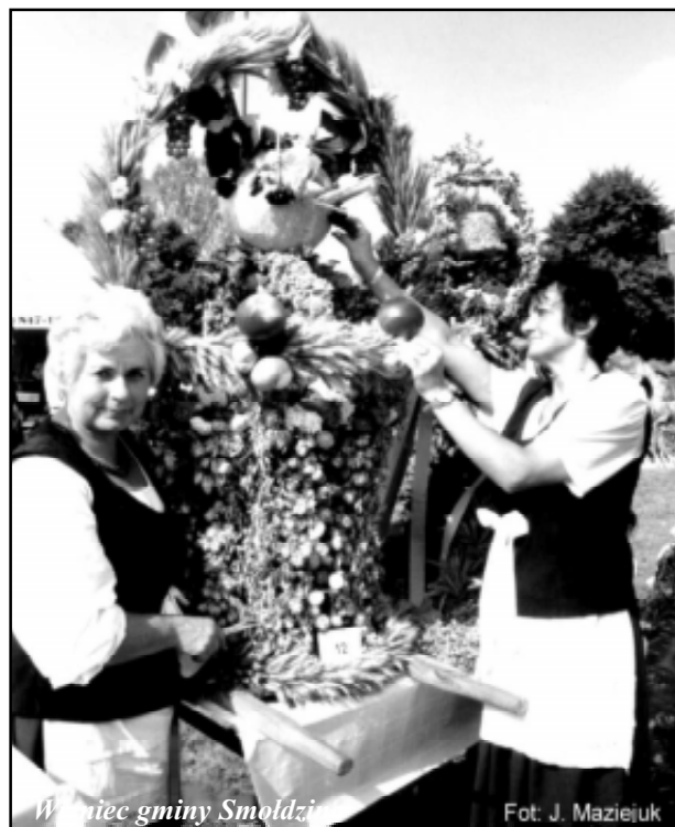
Wieniec gminy Smoldzi