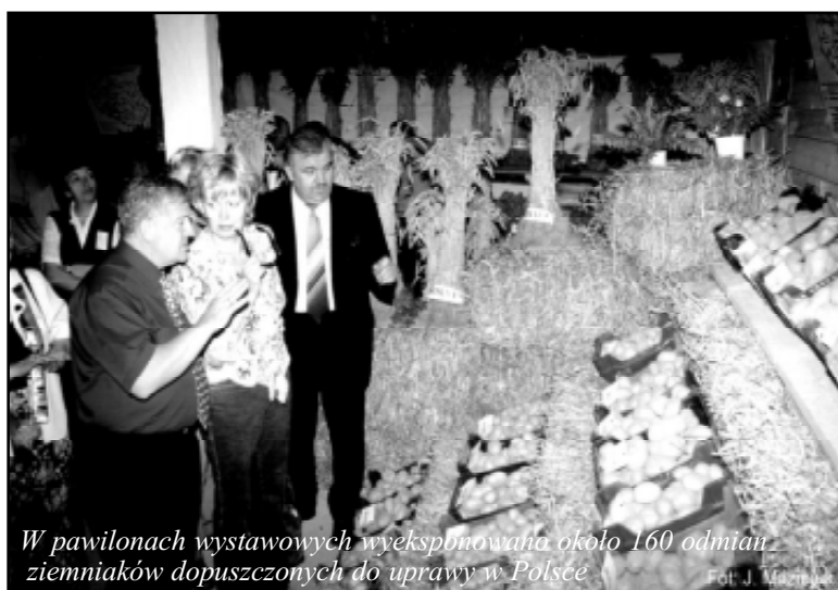
W pawilonach wystawowych wyeksponowano około 160 odmian ziemniaków dopuszczonych do uprawy w Polsce

sowemu wsparciu Agencji Własności Rolnej Skarbu Państwa, Urzędu Marszałkowskiego Województwa Pomorskiego i Urzędu Gminy w Damnicy.