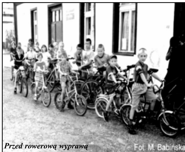
Przed rowerową wyprawą

Jak co roku odwiedziliśmy z dziećmi również ich rówieśników w innych wsiach, gdzie przy ognisku w ramach integracji, wszyscy wspólnie się bawili. Słodkie upominki mobilizowały do udziału w konkursach, w których nie było przegranych.