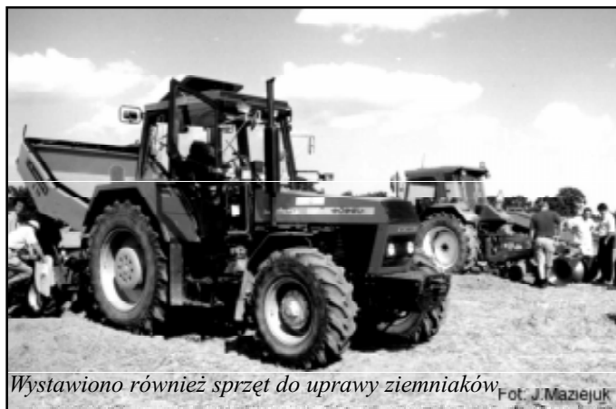
Wystawiono również sprzęt do uprawy ziemniaków

trybutorów sprzętu, środków ochrony roślin, nawozów.