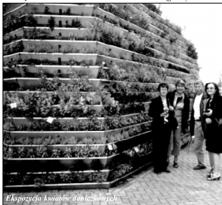
Ekspozycja kwiatów doniczkowych