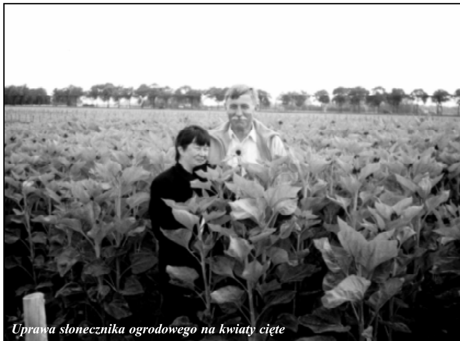
Uprawa słonecznika ogrodowego na kwiaty cięte

Sekretarz Stowarzyszenia jest pracownikiem etatowym, pozostali członkowie zarządu (7 osób) pracują społecznie. Dzięki środkom pomocowym gospodarstwa rolne, które ze względu na skalę produkcji nie mogą konkurować na rynku europejskim, promują i rozwijają dodatkową działalność przynoszącą znaczne dochody. Na przykład gospodarstwo mleczarskie „Uiteutnis” obok swojej podstawowej produkcji przygotowało kwatery oraz program rehabilitacji dla dzieci niepełnosprawnych. Osoby te przywożone są z Ośrodka Opiekuńczego na cztery godziny dziennie specjalnym samochodem. W gospodarstwie wykonują prace zgodne z ich możliwościami pod opieką małżeństwa rolników, którzy otrzymują zapłatę w wysokości po 25 euro dziennie za jednego podopiecznego. Gospodarstwo to posiada 27 ha gruntów rolnych, hoduje 50 krów dojnych o wydajności średnio 8,5 tys. litrów i 15 cieląt. Posiada 10-stanowiskową dojamnię. Pracuje w nim tylko rodzina rolnika. Dodatkowo wytwarza ser żółty Beemster na rynek lokalny.