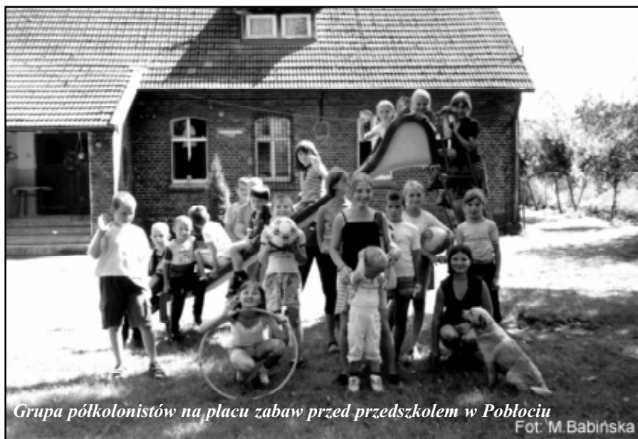
Grupa półkolonistów na placu zabaw przed przedszkolem w Pobłociu

Biegające, rozkrzyczone dzieci na podwórku, snująca się ulicami młodzież to jakże częsty obraz, który utrwała się w wielu miejscowościach podczas wakacji. Istotnym powodem tego stanu rzeczy jest brak pieniędzy u rodziców i instytucji zajmujących się organizowaniem letniego wypoczynku. Są jednak inne formy, które nie wymagają wielkich nakładów finansowych.