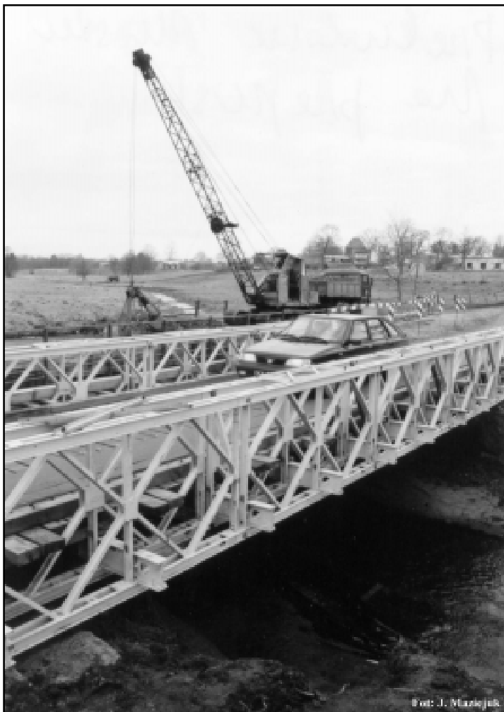
Budowa nowego mostu na trasie Kończewo-Sierakowo

bądź odnowiono 8,1 km dróg oraz rozpoczęto przebudowę mostu w Krzynie. W okresie zimowym, ze względu na warunki atmosferyczne, roboty na drogach przerwano. Zostaną one wznowione w momencie ustabilizowania się pogody. W tym też czasie Zarząd dokona przeglądu robót.