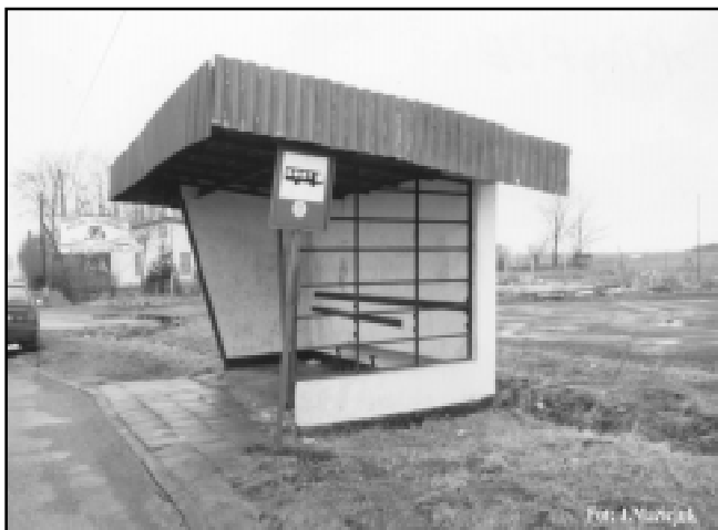
Przystanek PKS przy drodze nr 6 w Saborzu

Posel SLD Jan Sieńko zapewnił niedawno na konferencji prasowej, że przebiegająca przez Szczecin, Koszalin, Sławno, Słupsk, Lębork i Gdańsk droga nr 6, stanowiąca na północy główny ciąg komunikacyjny, łączący Kołbaskowo na granicy polsko-niemieckiej z rosyjskim Kaliningradem, otrzyma status ekspresowej drogi krajowej. Rząd Leszka Millera opracował odpowiedni aneks do dokumentów, w którym drodze tej nadaje się taki status. W budżecie zatwierdzonym przez Sejm znalazły się pieniądze na jej modernizację. Cała procedura związana ze zmianą statusu „szóstki” ma zakończyć się najpóźniej do 2003 roku.