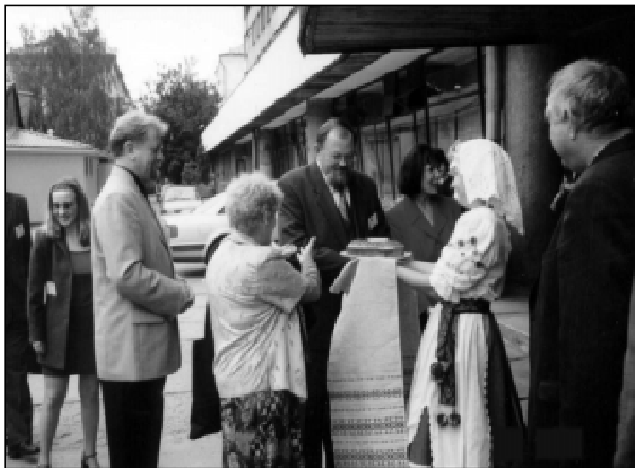
Powitanie delegacji słupskich przedsiębiorców przed siedzibą oddziału Białoruskiej Izby Przemysłowo Handlowej w Mińsku

Wdrożono pilotażowy program usuwania odpadów z parkingów leśnych, nadzorowanych przez nadleśnictwa z powiatu słupskiego. Na parkingach umieszczono odrębne pojemniki na szkło, plastik i odpady komunalne. Koszt przedsięwzięcia wyniósł 58939 zł. 42120 zł dał Wojewódzki Fundusz Ochrony Środowiska i Gospodarki Wodnej, a 9804 zł - nadleśnictwa. Koszty organizacyjne w wysokości 7015 zł poniósł powiat. Wdrażano