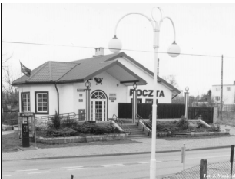
Nowy budynek poczty w Kobylnicy

grunty pod zabudowaniami, w tym również pod obiektami służącymi do prowadzenia działów specjalnych produkcji rolnej. W artykule 4 ust. 5 do 8 omawianej