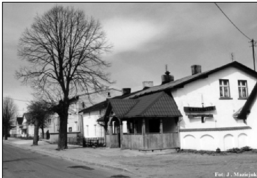
Jedna z ulic w centrum Smóldzina

Aby prawidłowo określić wartość nieruchomości ustawa o gospodarce nieru-