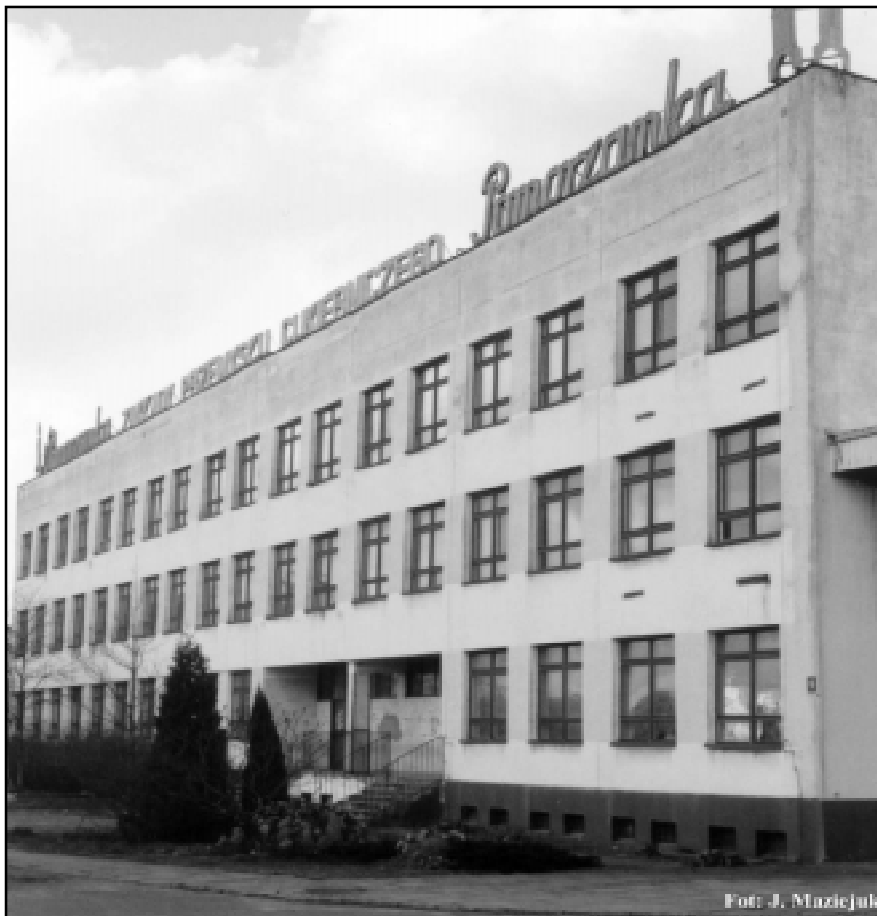
W tym budynku, powstanie Wydział Krajowego Sądu Rejestrowego

Obecny na spotkaniu sędzia Sądu Okręgowego w Słupsku Andrzej Jastrzębski wyliczył, że dostosowanie 429 metrów kwadratowych powierzchni użytkowej w deklarowanym przez miasto budynku musiałoby kosztować ok. 440 tys. zł, założenie niezbędnych instalacji, zabezpieczeń – 175 tys. zł, zakup mebli, sprzętu informatycznego – 200 tys. zł. Razem koszty wyniosłyby ok. 815 tys. zł i byłyby niższe od