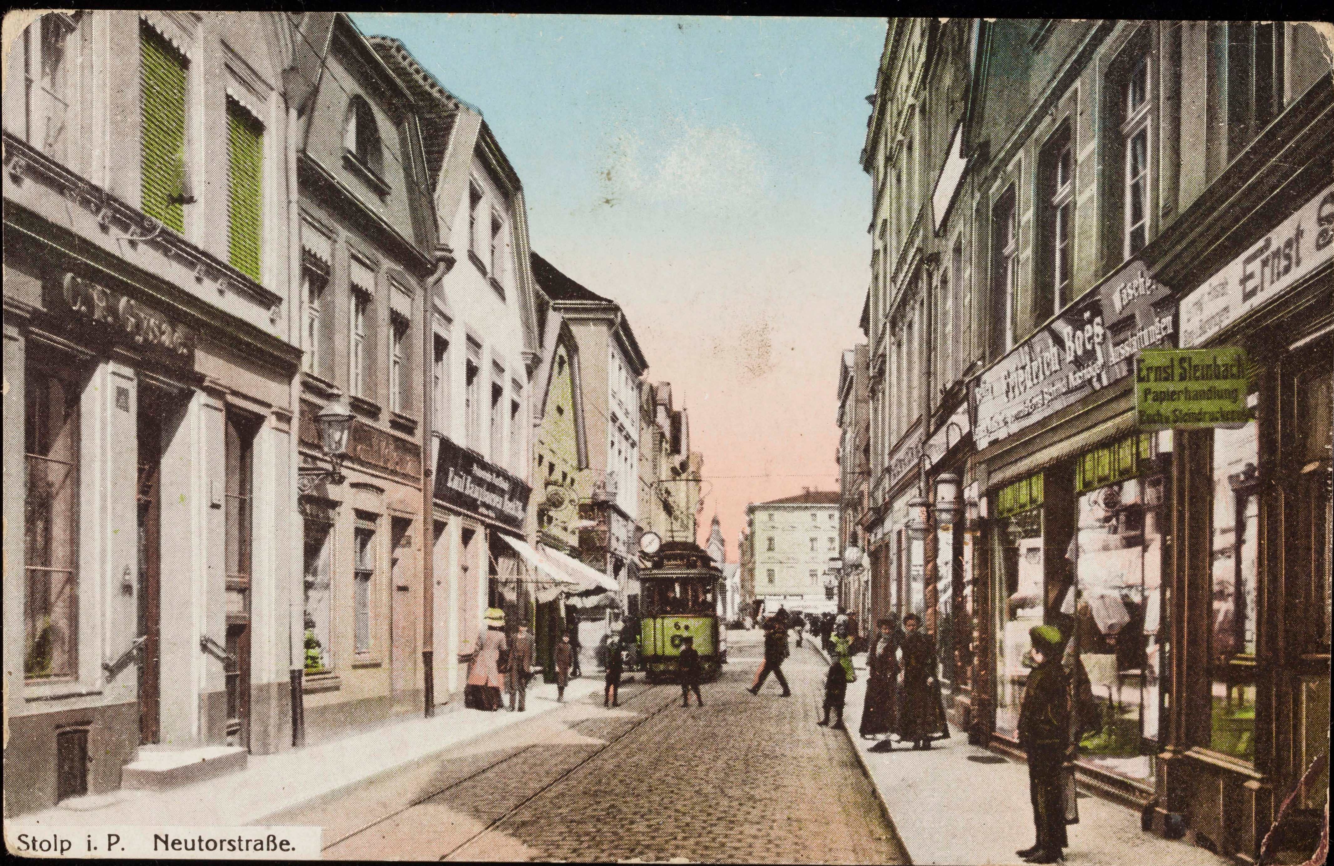
Stolp i. P. Neutorstraße.