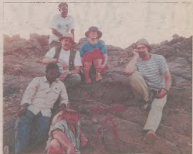
Polski i zagraniczni badacze w Sudanie, w miejscu, gdzie będzie zbudowana tama.

Do tej pory świadomość tego, co się stanie po wybudowaniu tamy, była raczej niewielka, ale w czasie konferencji wyszło na światło dzienne wiele szczegółów dotyczących