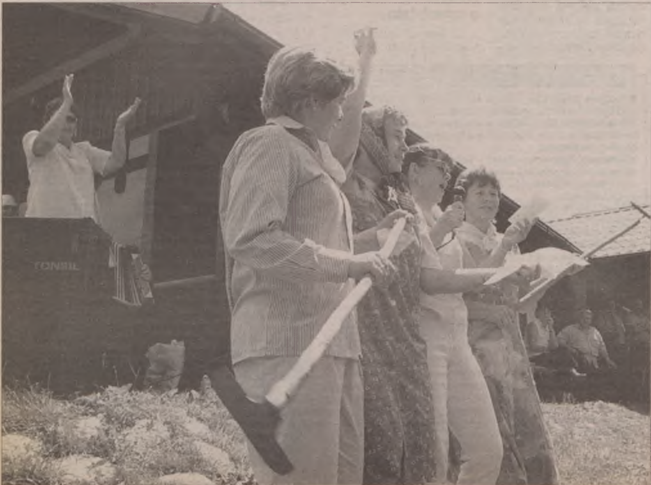
Baba dobra do tańca i do różańca...