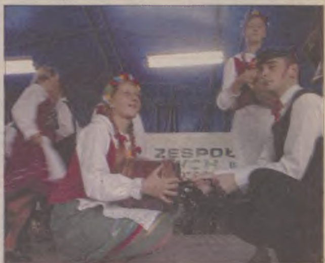
W poprzednich latach przegląd odbywał się we wrześniu. W tym roku muzyka folklorystyczna zabrzmiała już w sierpniu.