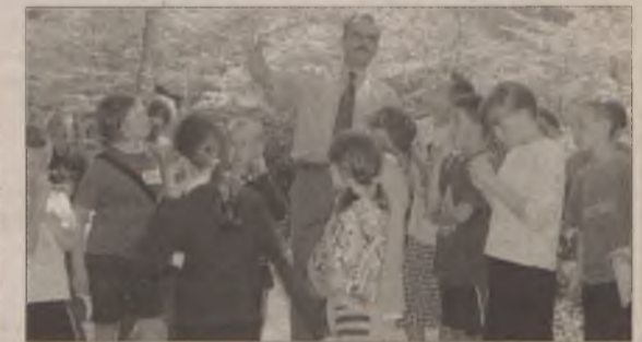
Fot. Mirosława Piłkowska (zakwater)