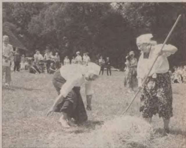
Przynieść, podać, pozamiatać - taki już nasz los.