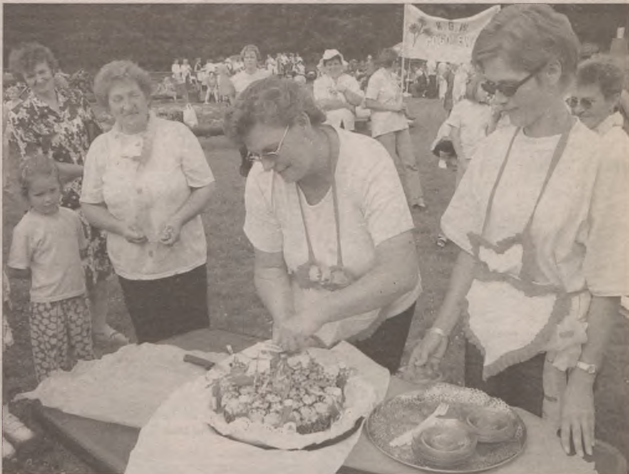
Każda dobra gospodyni wie, że nie ma lepszej drogi do serca mężczyzny niż... przez żołądek.

Z prezentacji ciast nam najbardziej podobała się „Bielawska droga”, wykonana przez panie z Bielawek. Za pomocą biszkoptu, małowka wykonały drogę jak prawdziwą. Ciastem