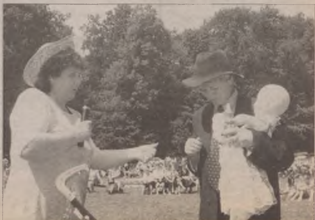
Kobieta ci wszystko.... wybaczy i wytłumaczy.