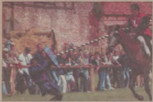
Popisy jeźdźców konnych cieszą się popularnością widzów.