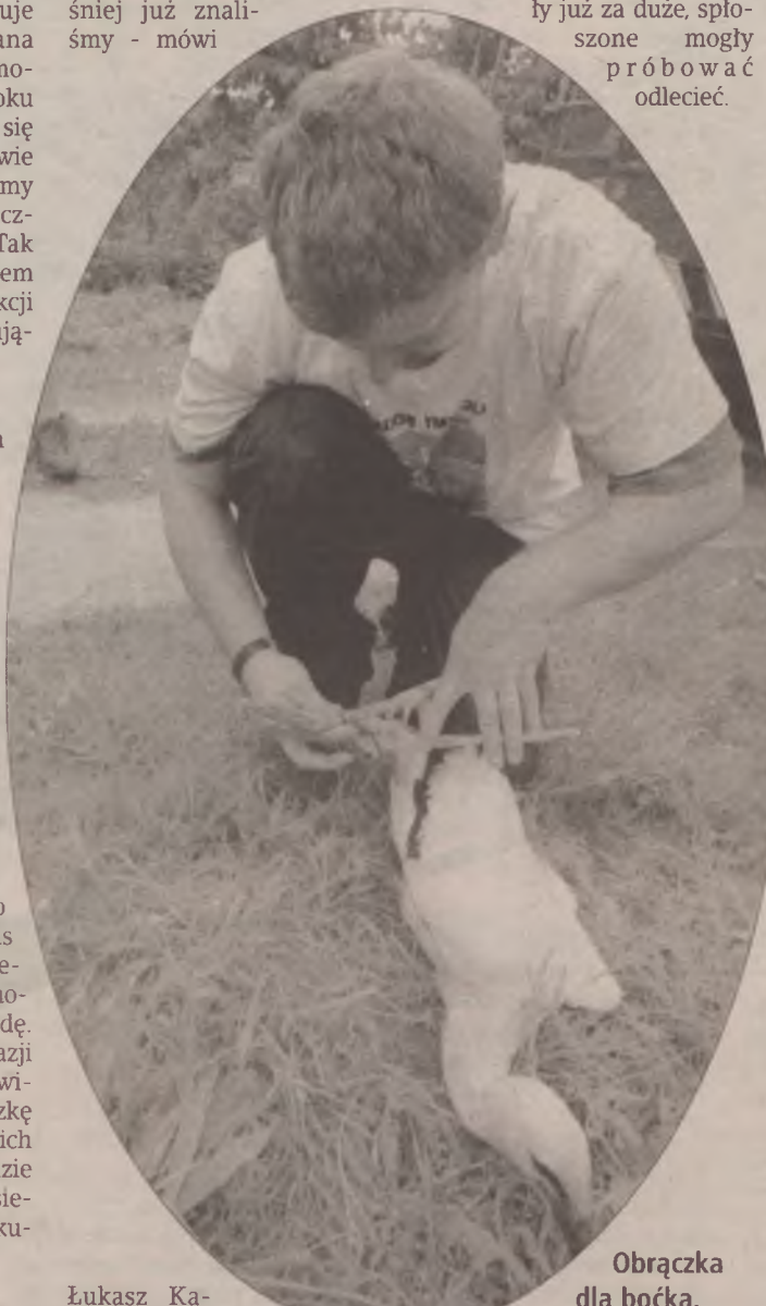
Obrączka dla boćka.

Bywało, że uczestnicy akcji musieli zrezygnować z obrączkowania, gdyż pisklęta były już za duże, spłoszone mogły próbować odlecieć.