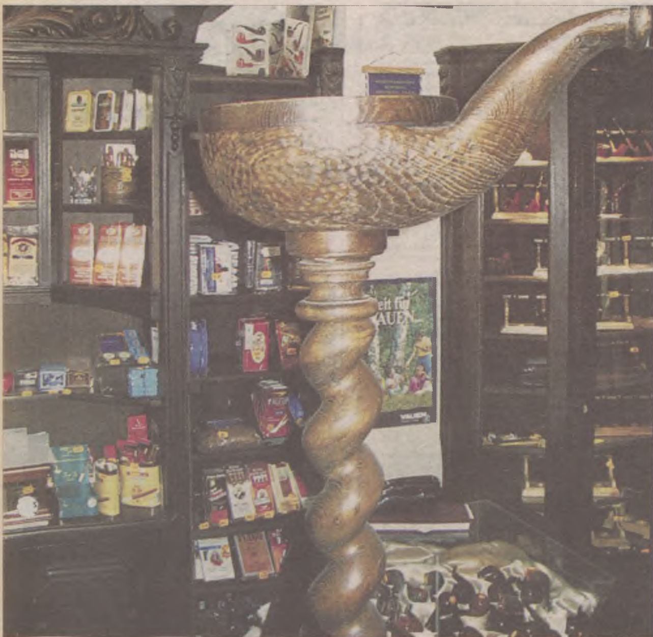
W gdańskim salonie fajki stoi gigantyczna śmietniczka. Kształtem przypomina fajkę albo lampę Alladyna... Jak kto woli...