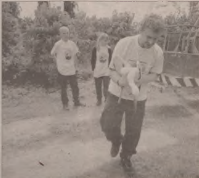
No, no będę w telewizji. Czy mógłbym zadzwonić do krewnych? Chyba mam prawo do jednego telefonu?