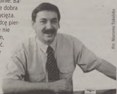
Fot. Marzena Tukalska

To jest to! Trzy grube tomy, które przeczytałem co najmniej trzy razy. Polecam, bo jest to lektura, która zawsze wciąga tak samo. Ona pochłania czytelnika. I to wszystkich, bez względu na wiek i płeć. Jest dobra dla oca, jak i dla syna, córki czy dziadka. Fajnie jest ją czytać wspólnie. Baśniowa opowieść o walce dobra ze złem, gdzie dobro zwycięża. Człowiek, czytając „Władcę pierścieni”, nabiera wiary, że nie trzeba być dużym i siłnym, aby być kimś, coś znaczącym. Człowiek słaby wcale nie jest skazany na zagładę. Natomiast człowiek o wielkim sercu zawsze jest zwycięzcą.