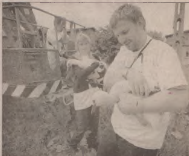
Co to do diabła, eksmisja? - klekotał bocian.