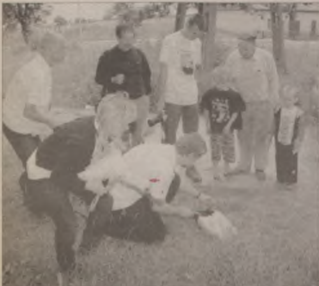
Przepraszam, ale biżuterii to ja nosić nie będę...