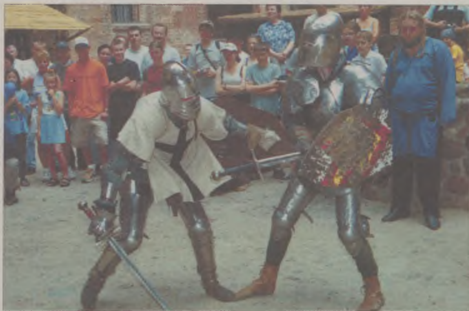
Rycerskich pojedynków na pewno podczas turnieju nie zabraknie.