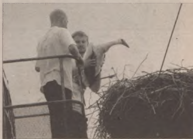
Nie myślał zbyt długo... Już mnie mają!