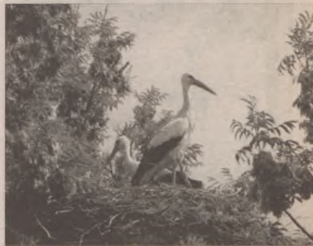
Siedział bocian spokojnie w swoim gnieździe...

Krystyna Paszkowska