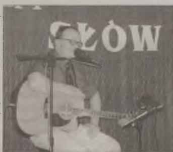
Fot. Marzena Tukalska