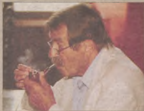
Günter Grass, noblista, pisarz, autor „Blaszanego bębena” obdarza Czytelników nie tylko opowieściami, książkami ale i zapachem tytoniu palonego w fajce...