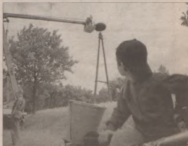
Ciekawe co pomyślał, gdy zobaczył podnośnik?