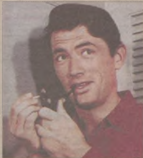
W czerwcu br. w wieku 84 lat zmarł Gregory Peck, aktor i propagator fajki w kinie. Lubił palić fajkę wykonaną z kukurydzianej kolby.