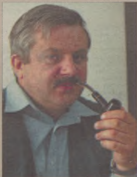
Autor niniejszej publikacji lubi kolekcjonować fajki. W niewielkim zbiorze posiada fajki kukurydziane, porcelanowe, bryzlijską z cybuchem w kształcie indiańskiej głowy.