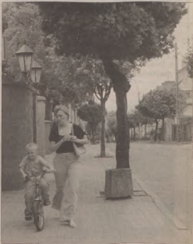
Mieszkańcy ul. Paderewskiego dużo wiedzą o patronie swojej ulicy.