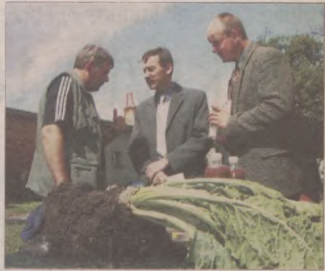
Na jednym ze stoisk mówiono o prawidłowej uprawie buraków cukrowych.

- Takie spotkania służą także wymianie poglądów rolników na temat technologii upraw. Można też poznać środki chemiczne do zwalczania chwastów w pszenicy i rzepaku. Na polu rosną nowe odmiany pszenicy. Rolnicy mogli zobaczyć, że nawet uszkodzone przez mróz rośliny rzepaku udaje się uratować.