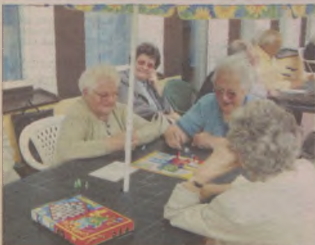
No dobrze, drogie panie, raz szósteczka, drugi raz szósteczka... bach, bach... i czerwony pionek wypada z gry.