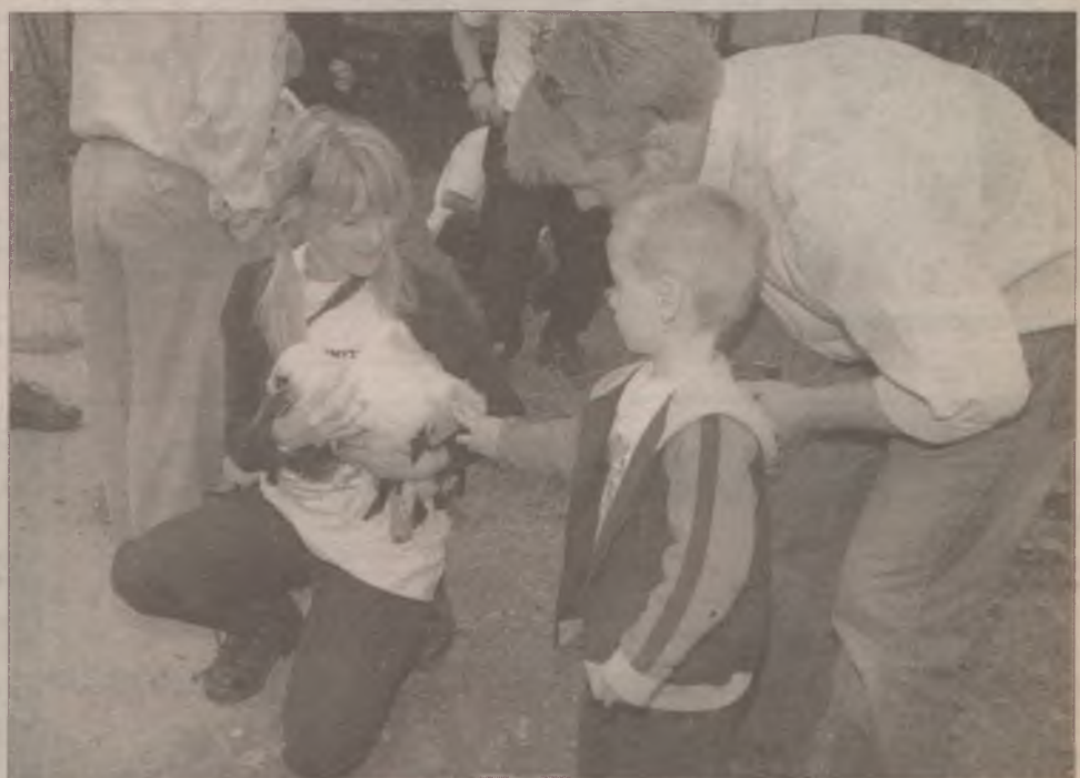
Akcją gniewskich ornitologów najbardziej były zainteresowane dzieci.