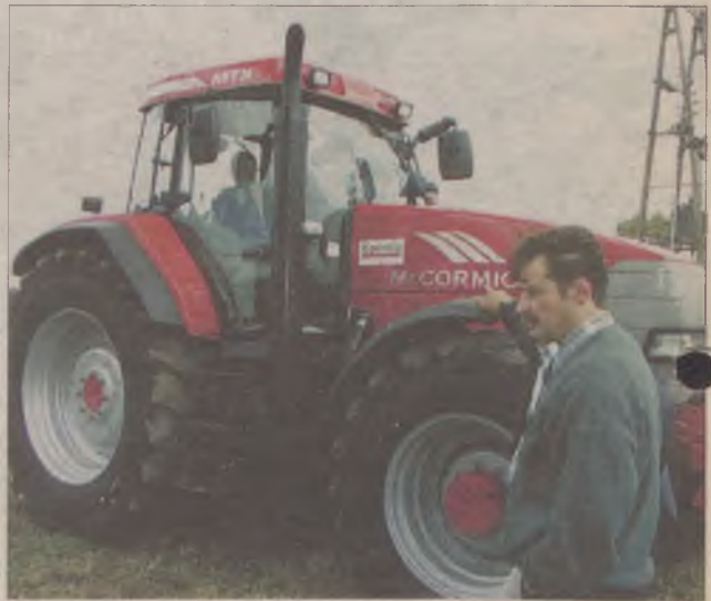
W czasie Dni Pola można było zobaczyć nowoczesne ciągniki rolnicze.