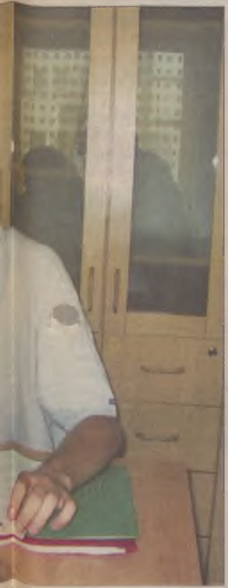
przychodzi po pomoc je-