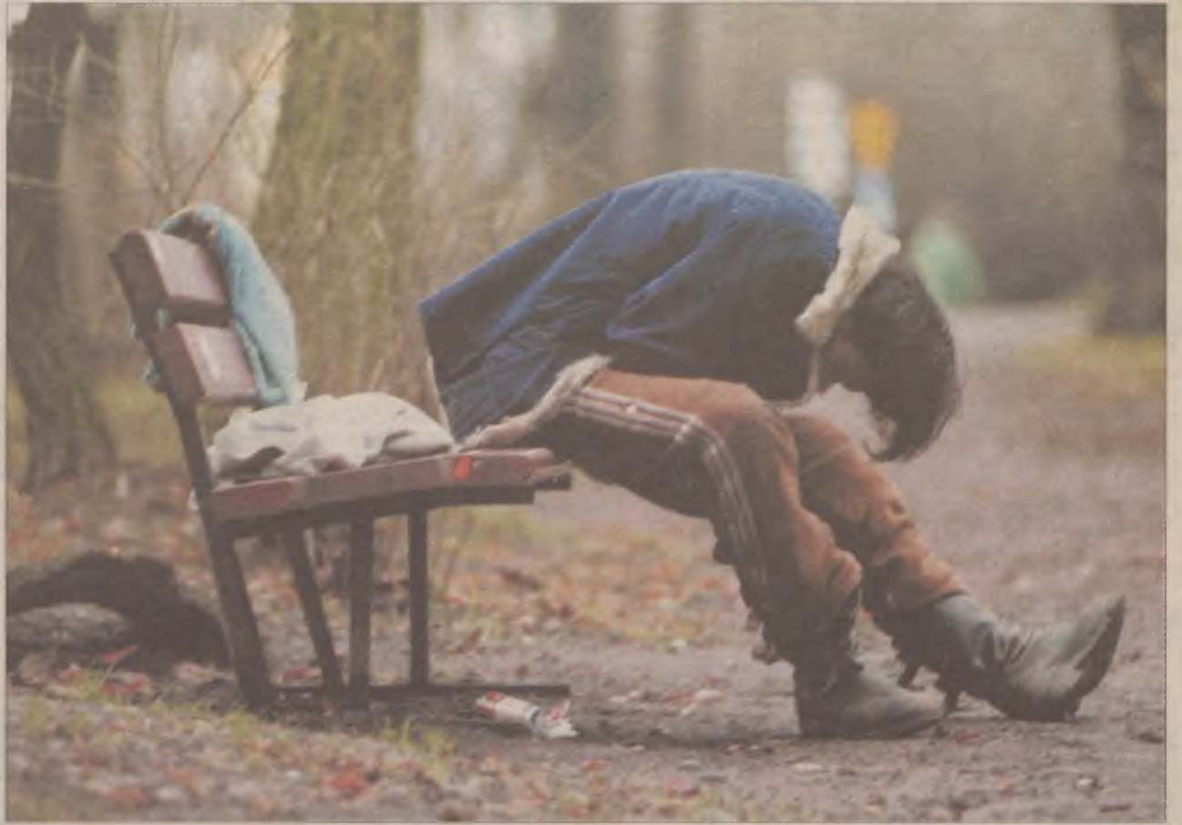
Widok młodego, naćpanego człowieka budzi grozę. Jednak spotyka ich się coraz częściej...