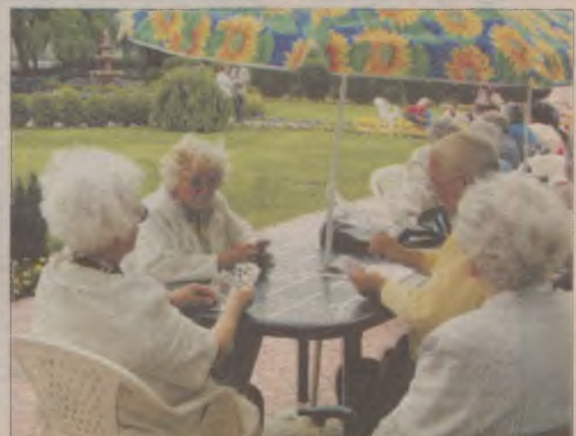
To teraz schowam tę dziesiąteczkę, podmienię ją na asika i wygrana w kieszeni. Tylko żeby nikt nie zauważył...