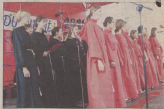
Ostatnim akordem festiwalu był występ chóru Juventus - w czasie pikniku parafialnego na Górkach.