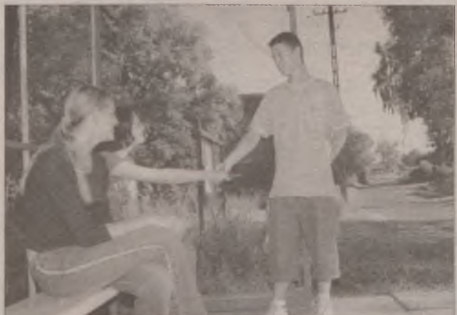
Życie towarzyskie młodzieży z Rożentalu skupia się wokół przystanku autobusowego.

Po PKS we wsi pozostał jedynie przystanek autobusowy. Miejsce to stało się punktem spotkań młodzieży. Dbają o nie, niemal jak o ośrodek kultury.