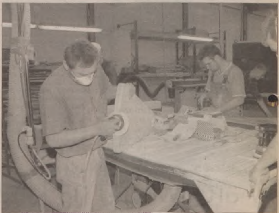
Wyrób schodów to także rzemiosło. Na zdjęciu pracownicy stolarni w firmie Rintall.