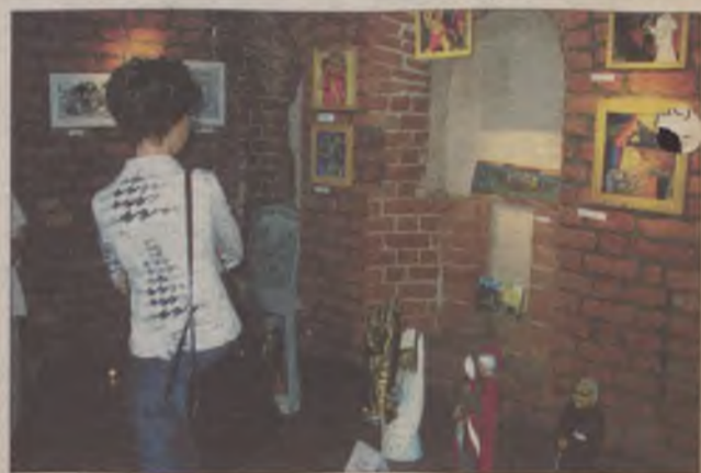
Na wystawie w kościele szkolnym można oglądać różne prace plastyczne.