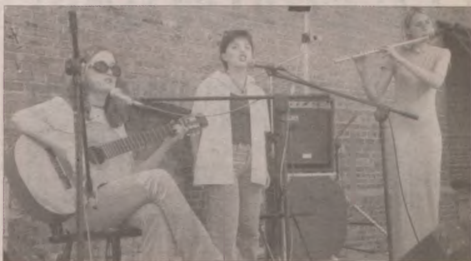
Występ fodzian z zespołu Paradoks podobał się publiczności.

Jako złote lata dla Bazuny określa się czas do końca lat 80. Kiedy nastał trudny okres