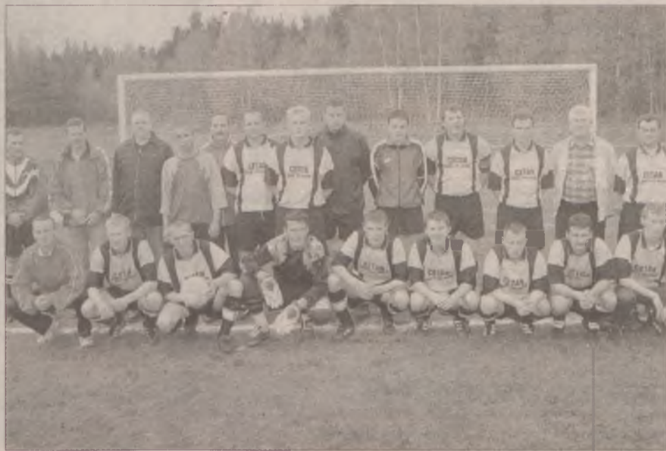
Pomorzanka Skórcz nie wywalczyła awansu do klasy okręgowej.

To chyba najbardziej chimeryczny zespół w lidze. Za-