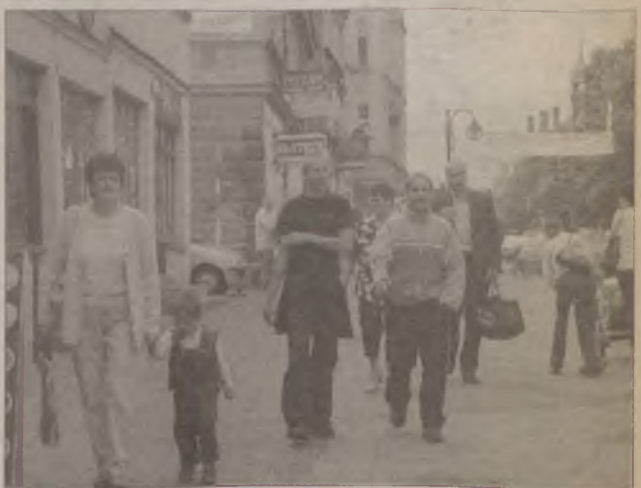
Z ulicy Jarosława Dąbrowskiego dojdzie się niemal do każdego miejsca w Tczewie.

- Tych Dąbrowskich było kilku - mówi. - Był Ignacy Janów było kilku ale Jan Henryk, ten od legionów, jest najbardziej znany. Natomiast Jarosław, mylony często przez naszych rodaków właśnie z Henrykiem, był działaczem rewolucyjnym i niepodległościowym, który żył prawie 100 lat