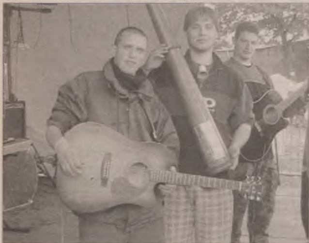
Zespół Krótki Słoń Nersa, mimo że debiutował w przeglądzie, zdobył w ubiegłym roku „Dziennikową” nagrodę publiczności.