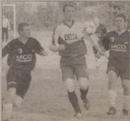
Fragment meczu Centrum - Delta.

zapraszamy zespół Subkowiec do Niemiec. (jovi)