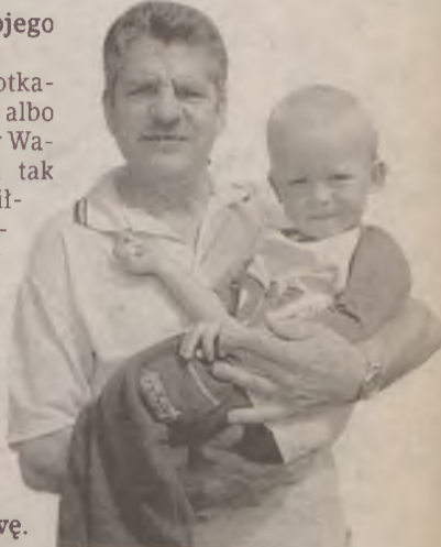
Rozmawiała Krystyna Paszkowska