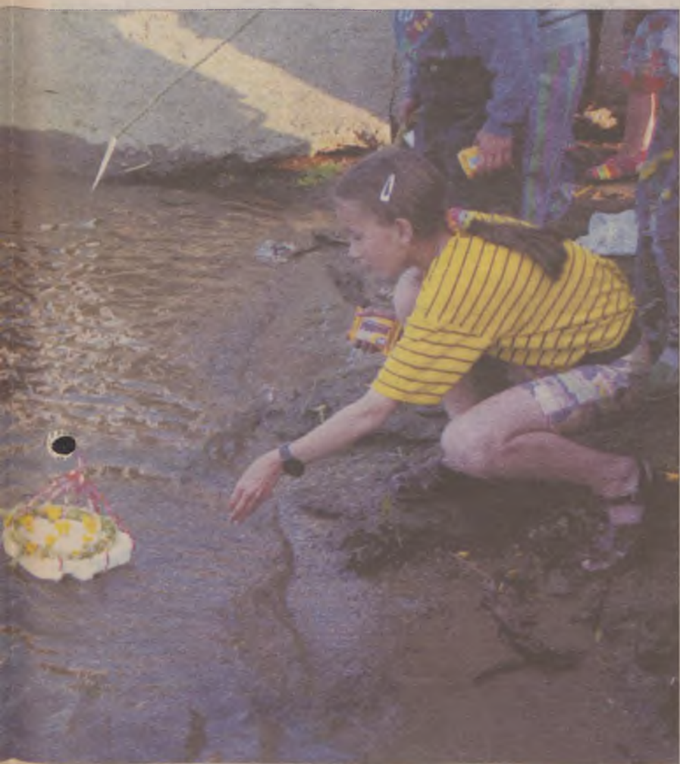
...mą świętowania sobótek.