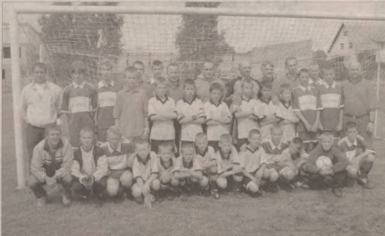
Zdjęcie rodzinne uczestników festynowych meczów.

Mimo że pogoda nie było nam dopisała, było pochmurno i trochę wiało, generalnie impreza nam się udała. Dostaliśmy mnóstwo życzeń z całej Polski. Na stadionie spotykałem byłych zawodników naszego klubu,