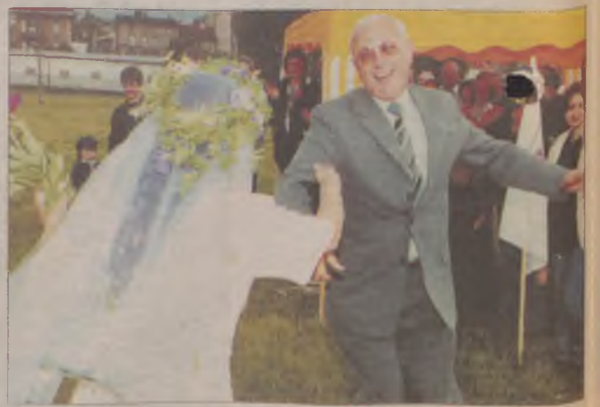
Podczas ubiegłorocznych Dni Tczewa tanecznie wital laty prezydent Zenon Ody.