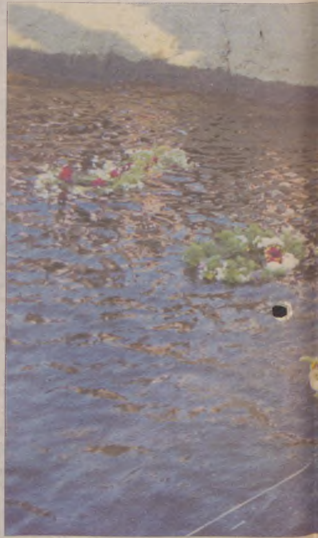
Wianki spuszczone na wodę są najbardziej popularną formą