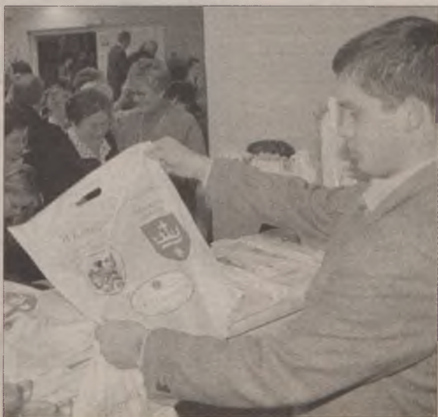
Towarzystwo Miłośników Ziemi Kociewskiej współorganizowało m.in. II Kongres Kociewski w 2000 r.

publicystycznego im. Edmunda Falkowskiego, niezującego już od 6 lat, wieloletniego prezesa TMZK. Konkurs skierowany jest do młodzieży gimnazjów i szkół średnich, którzy w formie eseju, reportażu, artykułu problemowego na dowolny temat poruszają problematykę regionalną. (M.J.)