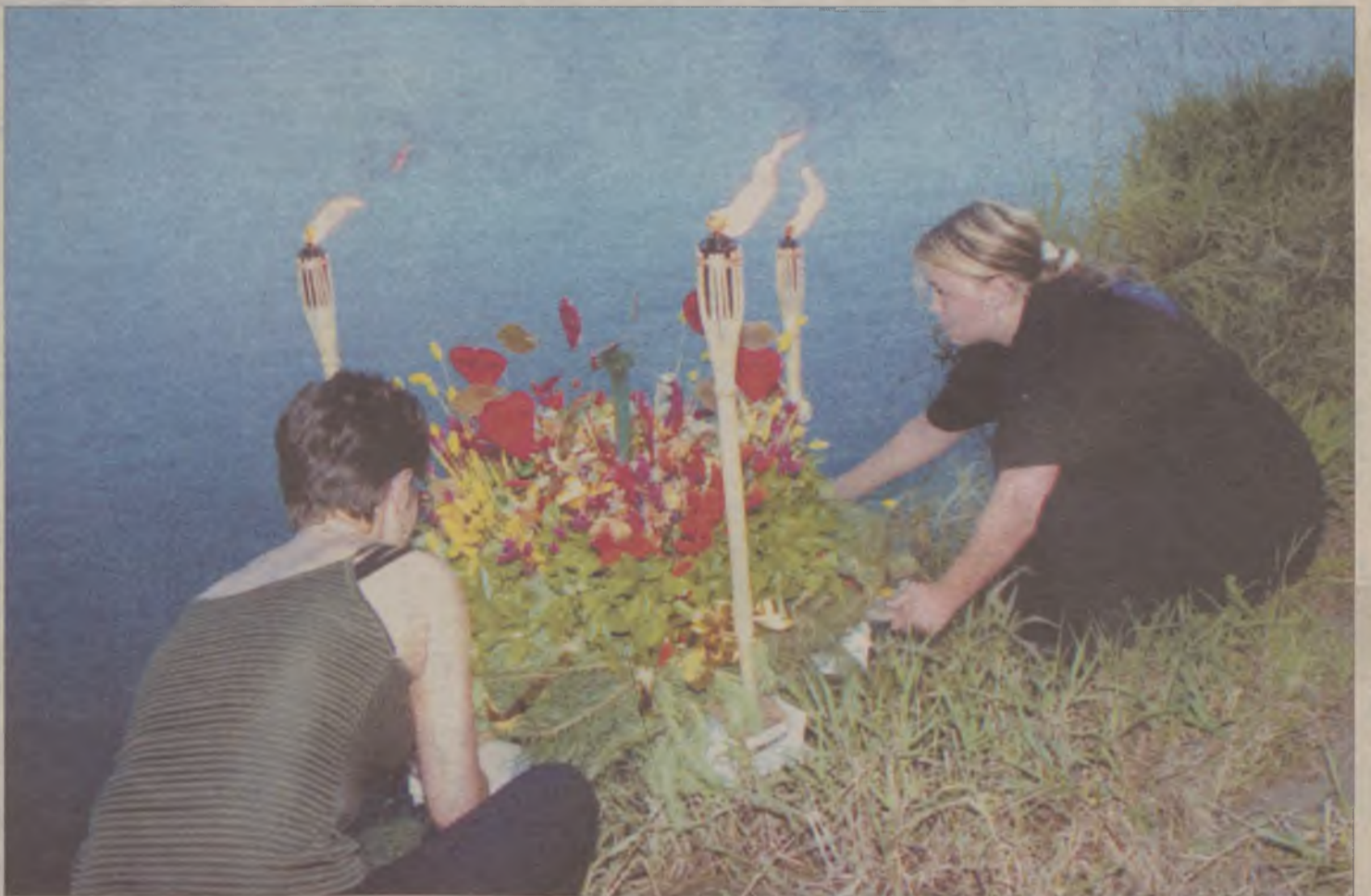
Co roku na Kociewiu ożywają sobótkowe tradycje.