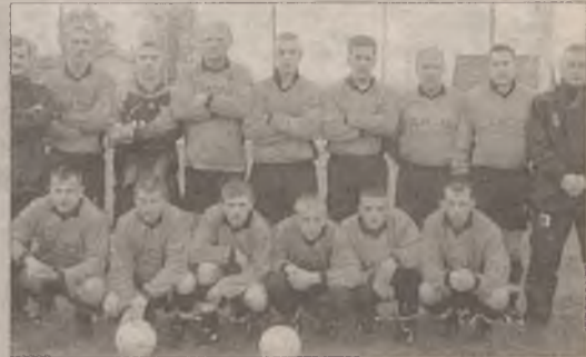
Centrum Pelplin od nowego sezonu wystąpi w A-klasie.