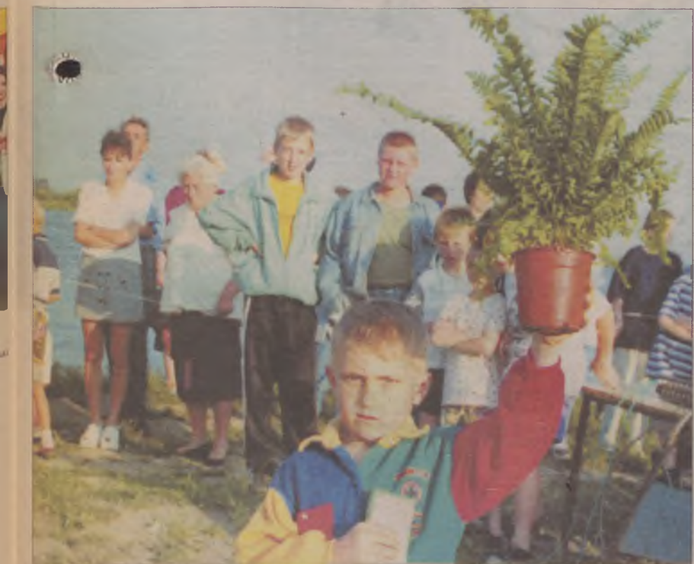
Czy kwiat paproci istnieje? Nie wiadomo, ale warto próbować go znaleźć.