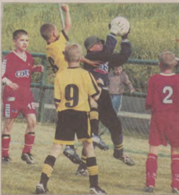
Fragment meczu finałowego CORNY/Wisła - Gryf.