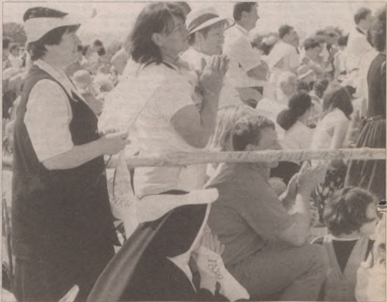
Pielgrzymi w czasie wizyty papieskiej bili brawo.