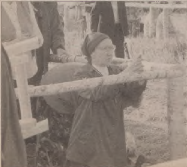
Dla wielu pielgrzymów wizyta Jana Pawła II była duchowym przeżyciem.

W każdą przystawioną dziurę zaglądali pirotechnicy i pracownicy Biura Ochrony Rządu. Tak było, gdy zamykano konstrukcję łabędzi, ale i na kilka minut przed wejściem Jana Pawła II przez ołtarzową bramę Kociewia. Obok ustawiono figurę Matki Boskiej Piaseckiej Królowej Pomorza. XIV-wieczna rzeźbę też sprawdzono. Widzieli to pielgrzymi, przychodzący na Biskupią Górę. Tak naprawdę pierwsi pojawili się na górę już o 2 w nocy. Od wczesnych godzin rannych pielgrzymi podziwiali, na tle wschodzącego słońca, ołtarz z krzyżem i sieciami unoszonymi przez dwa ptaki.