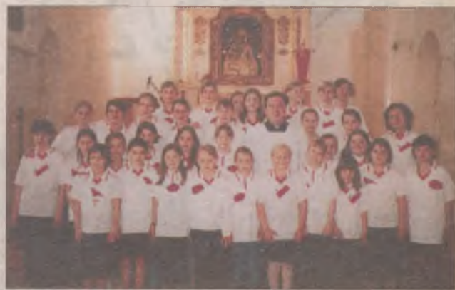
Biedronki na Litwie.

Biedronki przyznały się nam również, że z pobytu na Litwie będą pamiętały na pewno Aqua Park i mecz koszykówki, w którym wzięła udział dziewczęca reprezentacja tczewskiego Parafialnego Klubu Sportowego Fara. Dziewczyny wygrały mecz 64:12.