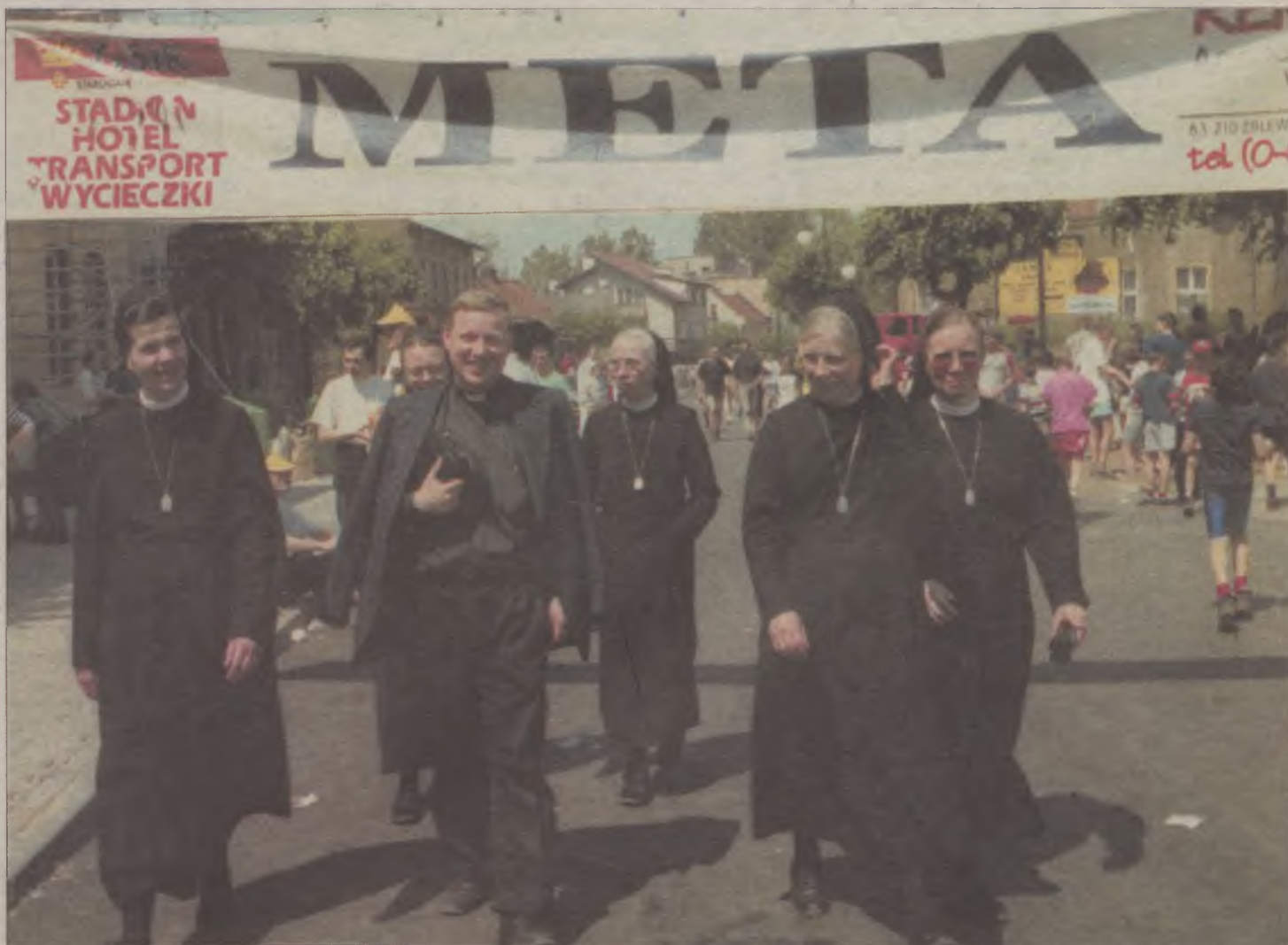
Tak bawiono się podczas Dnia Papieskiego w 2000 roku. Było naprawdę atrakcyjnie.