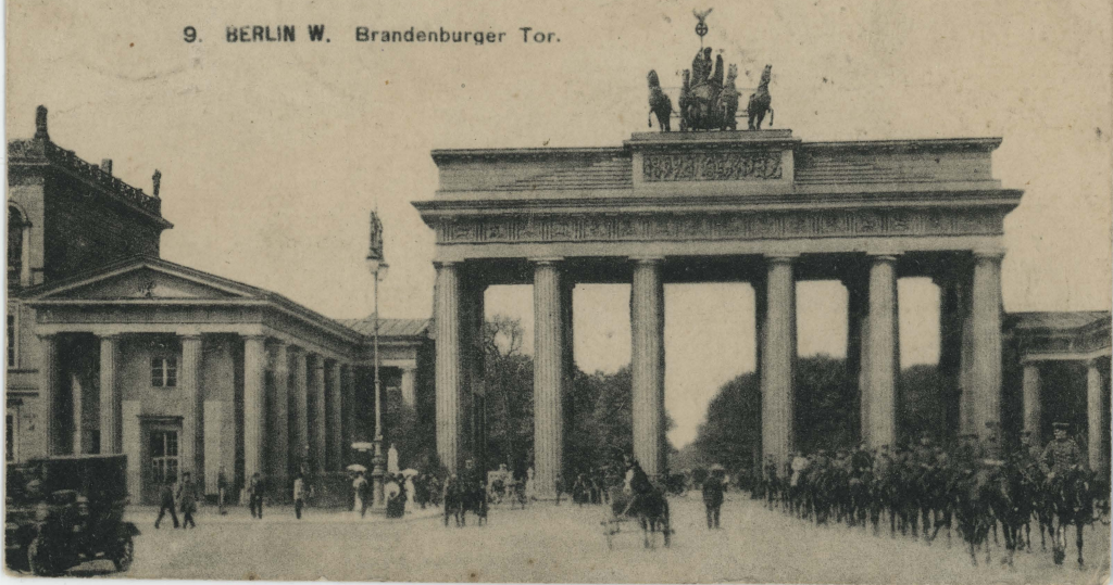
9. BERLIN W. Brandenburger Tor.