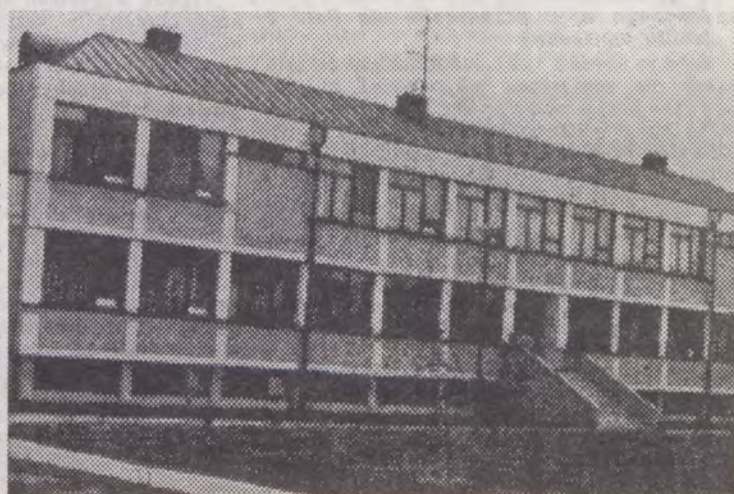
Budynek przyszłego liceum