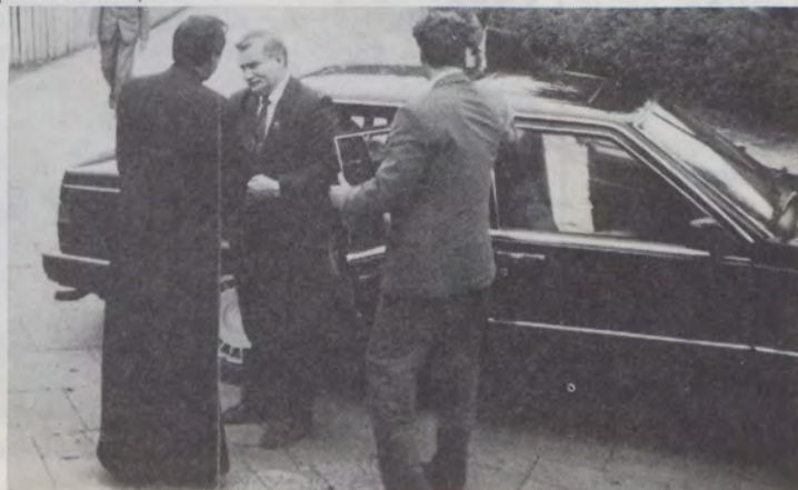
Ksiądz proboszcz żegna p. Prezydenta