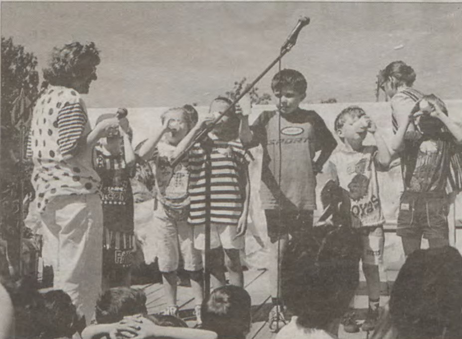
Wilczki morskie na polecenie Neptuna piją sok z cytryny. Bez cukru, a z uśmiechem.