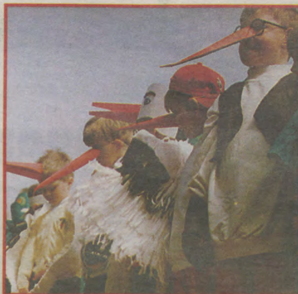
Przedszkolaki z „dwójki” przedstawiają „Bociana i żabki”.

nie rozgrzał występ roztańczonego zespołu „Don-Don”, później zaczęły się wielkie, konkursowe emocje, przerywane niesamowitymi występami akrobatycznymi (można było odnieść wrażenie, że niektóre gimnastyczki nie mają kości, za to mają ciało z gumy). Wpierw jury pod przewodnictwem gościa honorowego, byłego wojewody Macieja Płażyńskiego