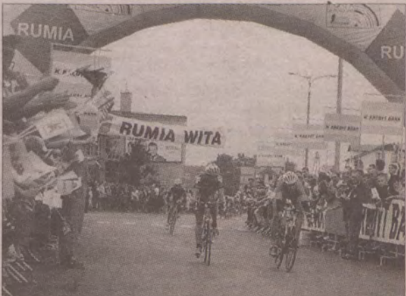
Kolarzom zgotowano w Rumi gorące przyjęcie.