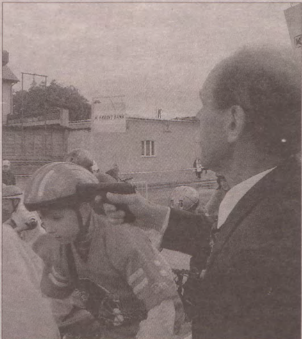
Na szczęście to tylko pistolet startowy.