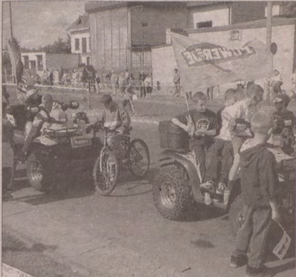
Kolumna reklamowa to gratka dla najmłodszych.