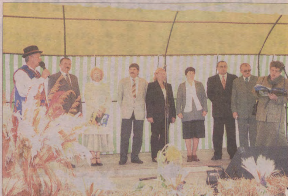
Wójt i sołtysi gminy Łęczyce podzielili się chlebem, a potem częstowali nim gości dożynek.

Gmina jest częścią tak zwanych ziem odzyskanych, zamieszkałą nie tylko przez ludność kaszubską. W wielu wsiach dominuje jednak rodna mowa. - Tak jest głównie w Strzebielinie, Nawczu, Łówczu, Dzięcielcu, Rozłazi-