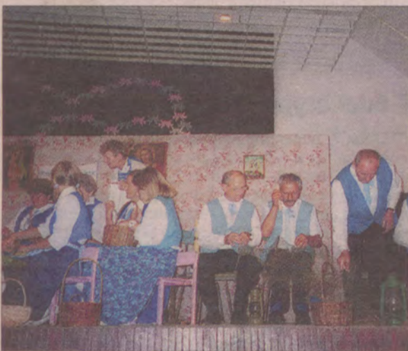
Zespół Krajniacy z Wielkiego Buczka na chmielńskiej estradzie.