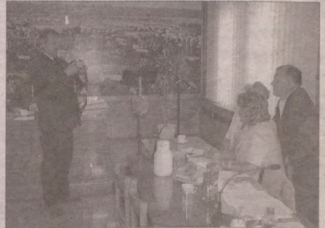
W planie obrad zabrakło punktów, które mogłyby spowodować ożywioną dyskusję.