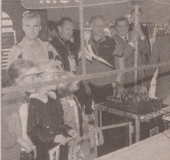
Przebieg wyścigu na bieżąco śledzono w telewizji.