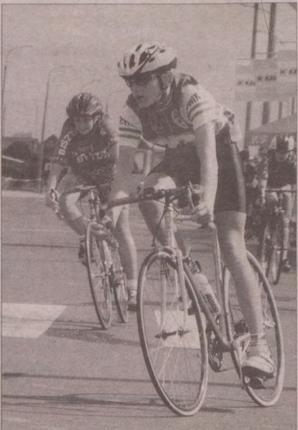
Także młodzi kolarze mieli swoje pięć minut.