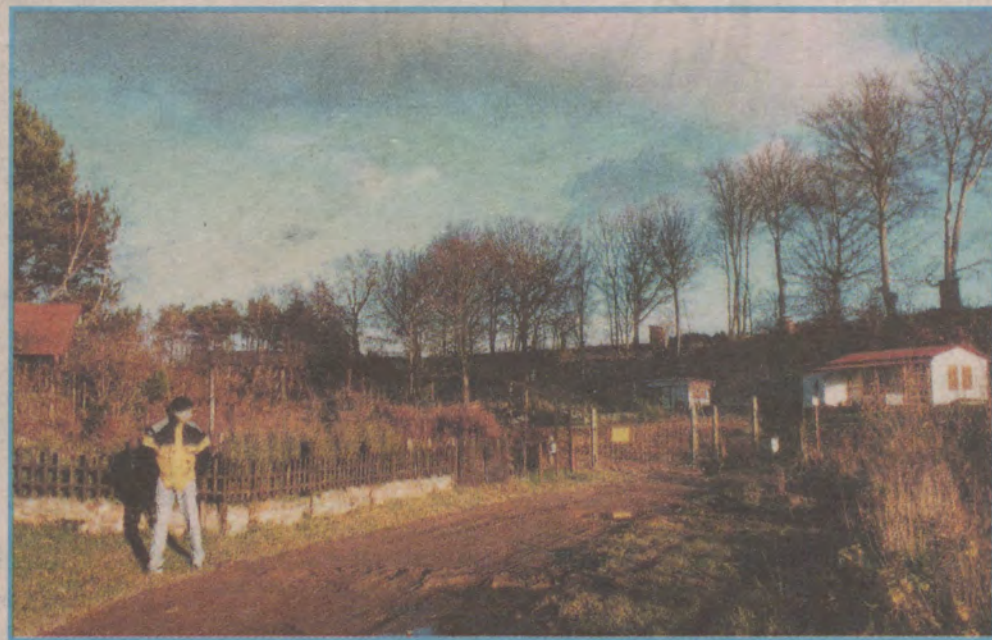
Domki nad jeziorem Marszewo stoją już od kilku lat.