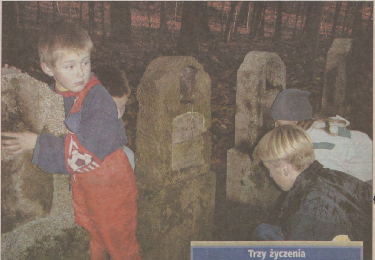
W Święcianowie o nagrobki zadbała tutejsza młodzież.

Ponad 200 mieszkańców, sklep spożywczo-przemysłowy, staw hodowlany. Większość dorosłych na rencie, bezrobotnych albo własnej gospodarki dogląda. Na msze do Sulechówka 5 km trzeba chodzić. Dzieci do szkół w Malechowie, Niemicy i Lejkowie dojeżdżają busami. Młodzież ze wsi ucieka. Ci co zostali, niewiele mają rozrywek. Chyba jedyne to dyskoteki w pobliskich miejscowościach. Kiedyś działała biblioteka, świetlica. Później