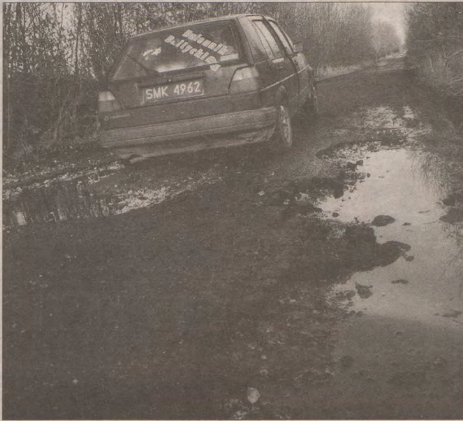
Tak wygląda droga z Wilkowic do Radosławia.