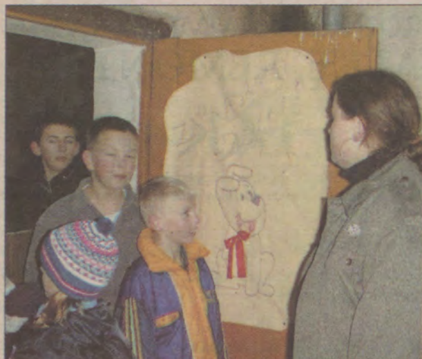
Remont i wyposażenie świetlicy to konieczność. Może VIP-y pomogą?