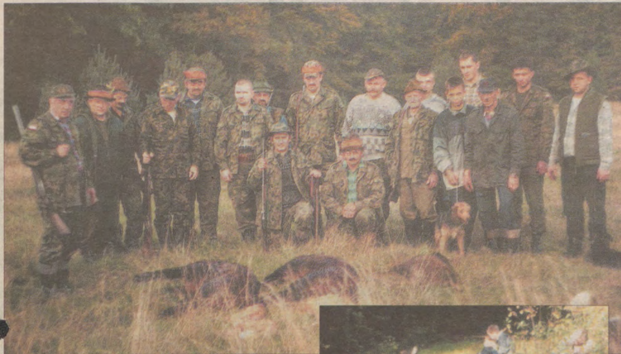
Zwierzyna leży pokotem przed grupą myśliwych, zebranych po polowaniu. To również część tradycji.