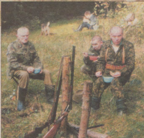
Myśliwi najczęściej jedzą grochówkę, bo najbardziej smakuje w lesie. Posiłek musi być podany koniecznie w połowie polowania.

Obfitość zwierzyny w sławińskich lasach sprawia, że cudzoziemcy ciągną tu tabunami. Najwięcej jest Duńczyków, którzy gotowi są zapłacić za dzień polowania około 200 marek. To spore źródło dochodu dla