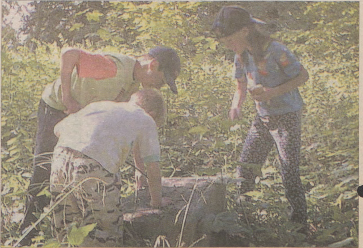
Stare nagrobki można znaleźć w niemal każdym zagajniku. Nie o wszystkich takich miejscach wiedzą dorośli.