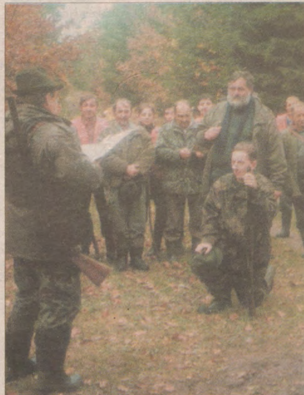
Młody myśliwy (zwany nemrotem) staje się „prawym rycerzem św. Huberta”. Po pierwszym ustrzeleniu grubej zwierzyny czeka go jeszcze pasowanie.