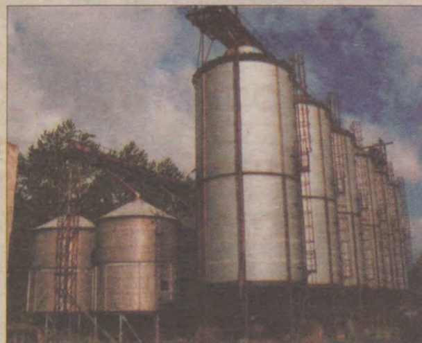
Wiele z wybudowanych w okresie działania PGR konstrukcji można jeszcze wykorzystać.