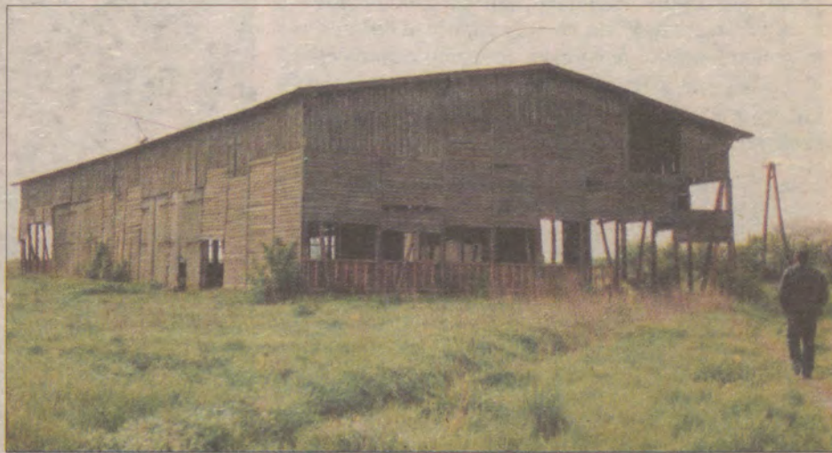
Po wielkich niegdyś PGR-ach zostały dzisiaj tylko zniszczone budynki