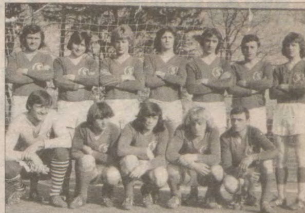
Drużyna piłki nożnej Sława Sławno lata 70.