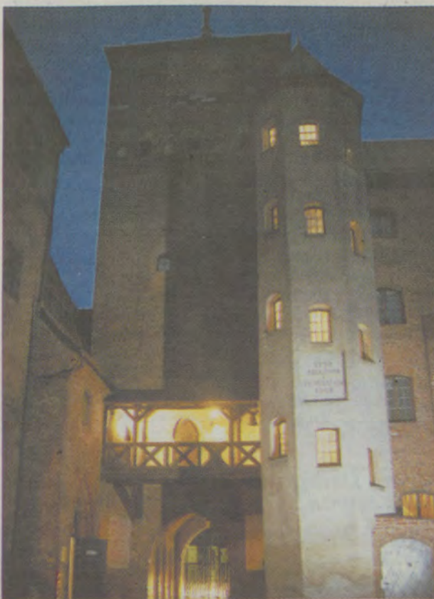
... i nocą.