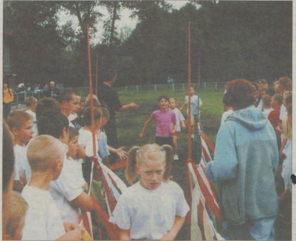
Wokół sławińskiego stadionu rozegrano biegi przełajowe dzieci ze szkół podstawowych, gimnazjum i młodzieży ze szkół średnich.