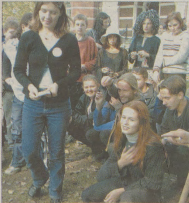
...Pierwszaki pozując do zdjęcia z drugoklasistami nie wiedzieli jeszcze, co ich czeka.