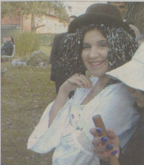
Tradycją stało się, że pasujący na „kotów” robią to w przebraniu.