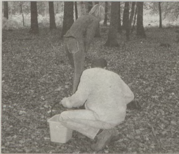
Lekarze zalecają uwagę przy zbieraniu i umiar w spożywaniu grzybów jadalnych.

Jak twierdzą lekarze, najgroźniejszym grzybem spotykanym w naszych lasach