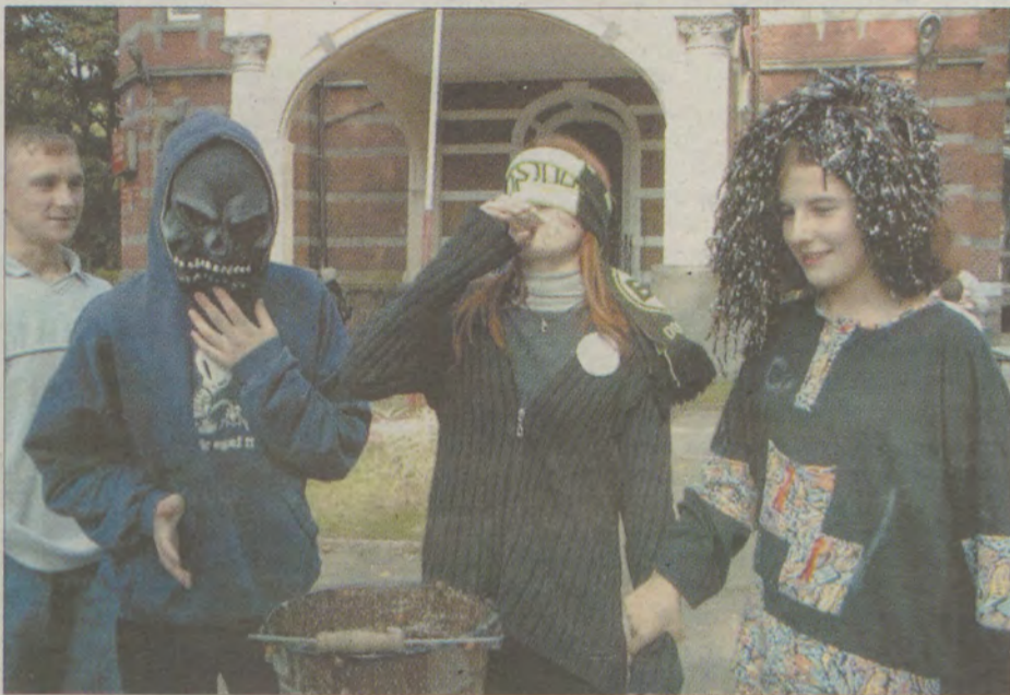
Jedną z prób było wypicie czegoś, co do wypicia absolutnie się nie nadaje...

Łącznie pierwszoklasistów jest w Zespole Szkół Zawodowych czterdziestu