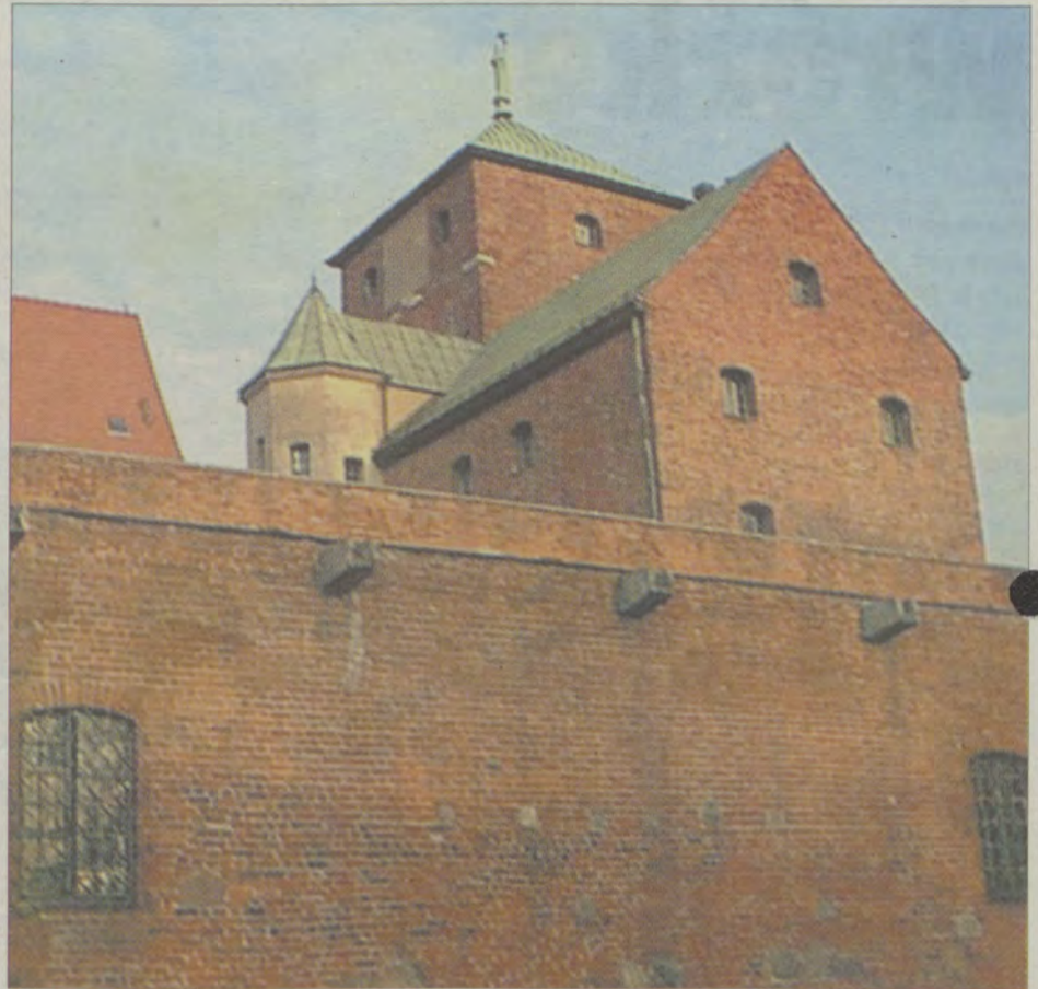
Zamek za dnia...

W początkach XX wieku postanowiono w zamku