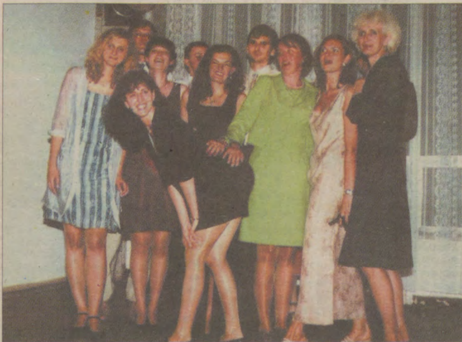
– To okazja do wzajemnego poznania się i wspólnej zabawy – mówiły zgodnie dryblasy.