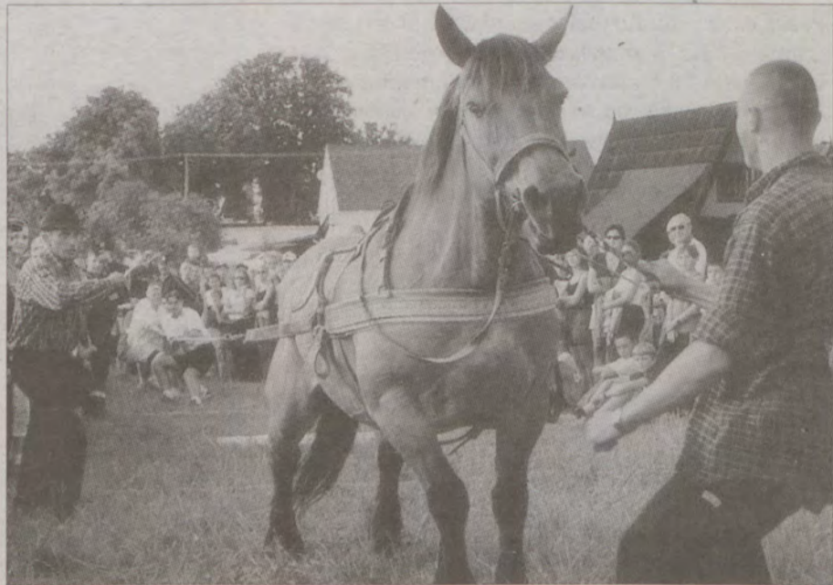
Ciekawym punktem programu był konkurs pod nazwą „Siłaczka”.