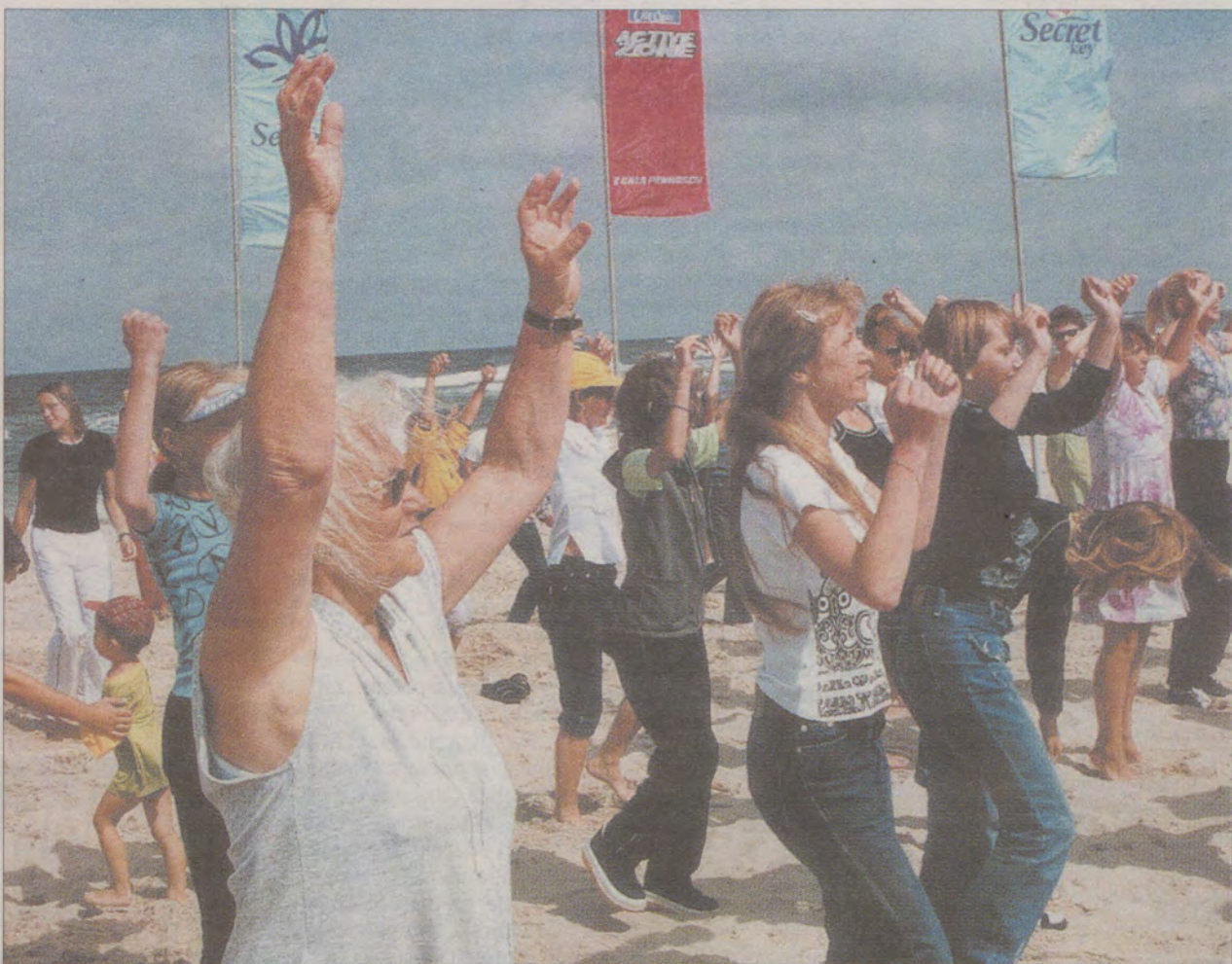
Aerobik na plaży – dla najmłodszych i tych „w sile wieku”.