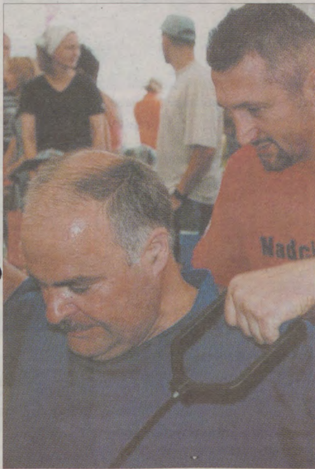
Pod namiotem czekały na chętnych specjalistyczne przyrządy do ćwiczeń.