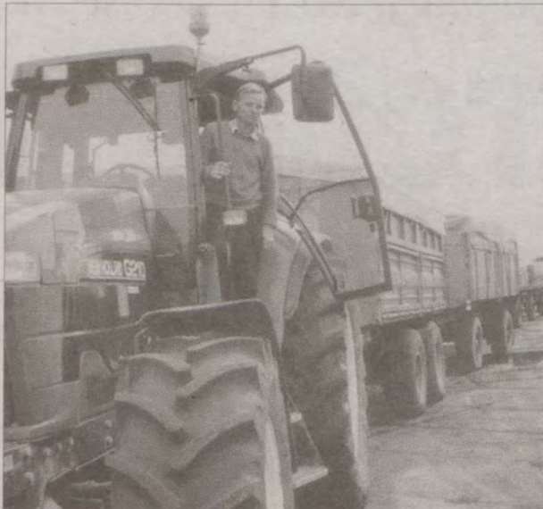
Sławińscy rolnicy zadowoleni są z tegorocznych zbiorów.