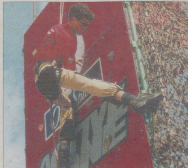
Dla najodważniejszych – wspinaczka po sztucznej ścianie.