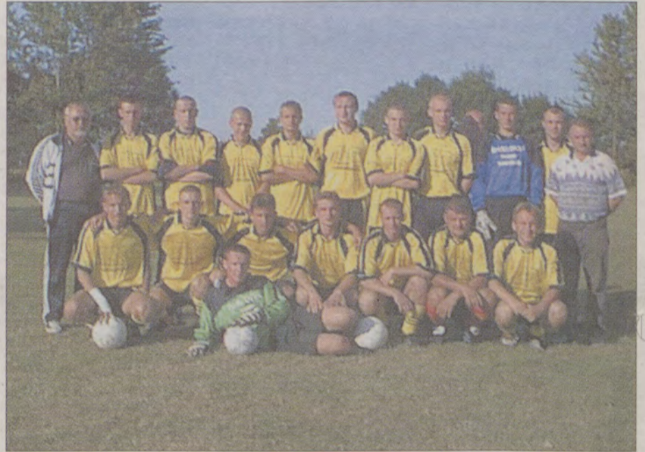
Drużyna Darłovii zamierza w tym sezonie walczyć o miejsca w czołówce tabeli.