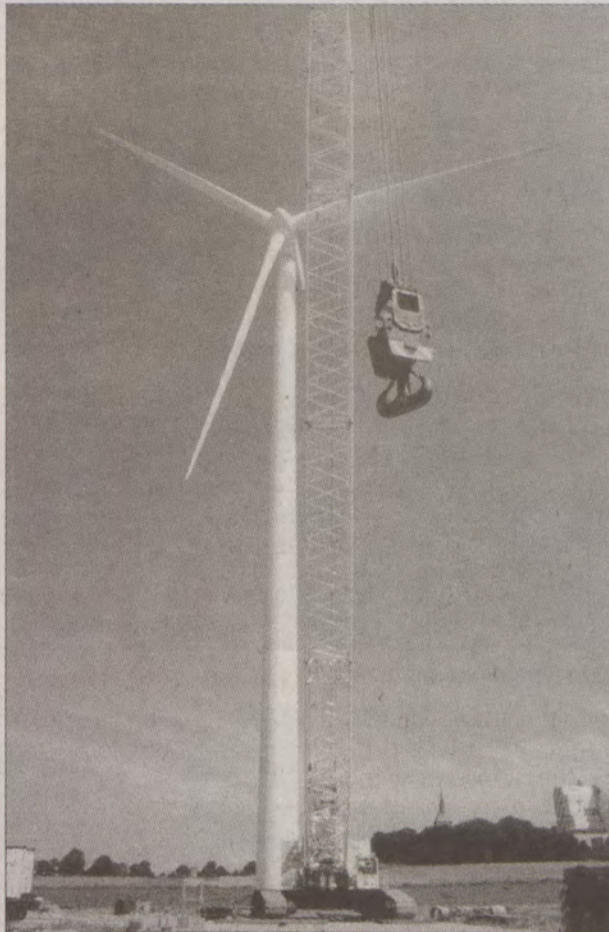
Jeden z wielkiej trójki gigantów już stoi w Cisowie.