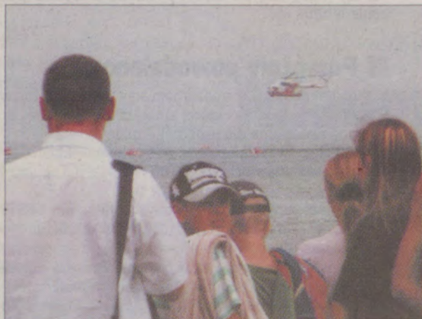
Kunszt pilotów zrobił na widzach wielkie wrażenie.