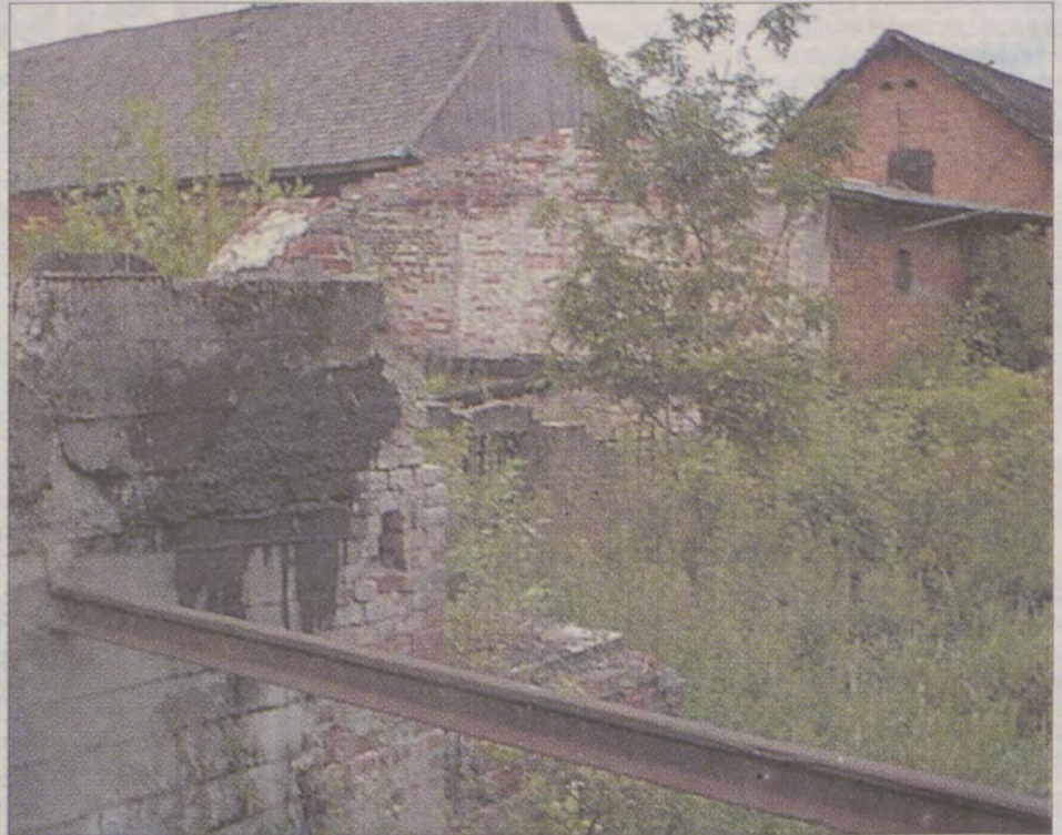
Czy diabeł zemścił się na „kukulce”?

Zły działał również w pobliżu Sławna. Umówił się z młynarzem, który miał młyn między Warszkwem