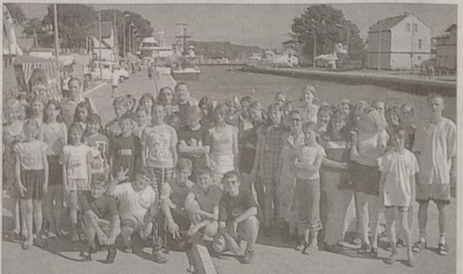
Szczególnym przeżyciem dla Białorusinów był widok szerokich plaż Jarosławca i Darłównka oraz morza.