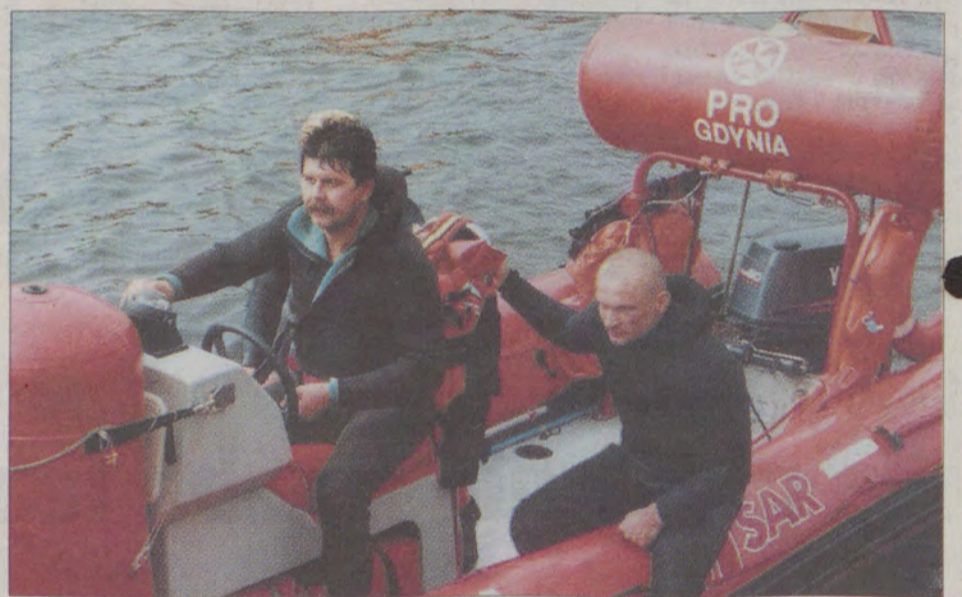
Ratownicy na pontonach podejmowali rozbitków z wody i dowozili do brzegu.