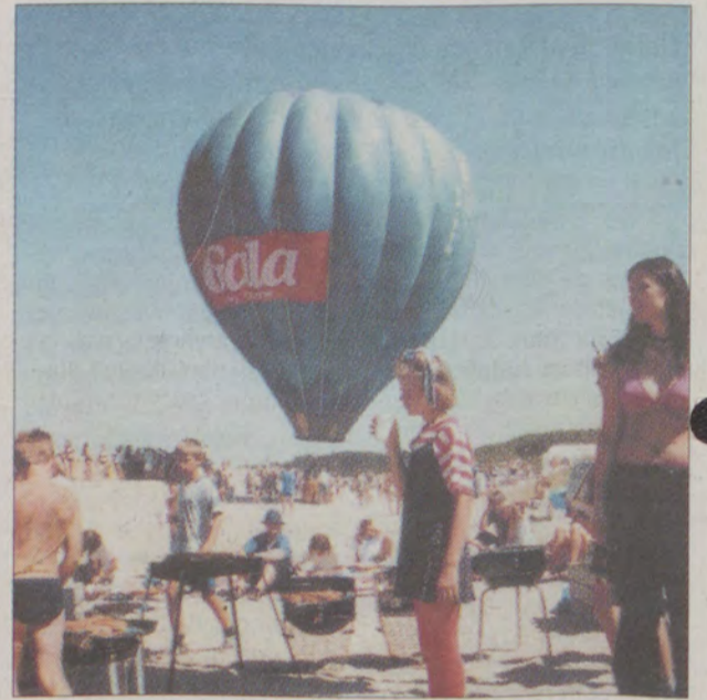
Nad grillami majestatycznie wisi olbrzymi balon z koszem.