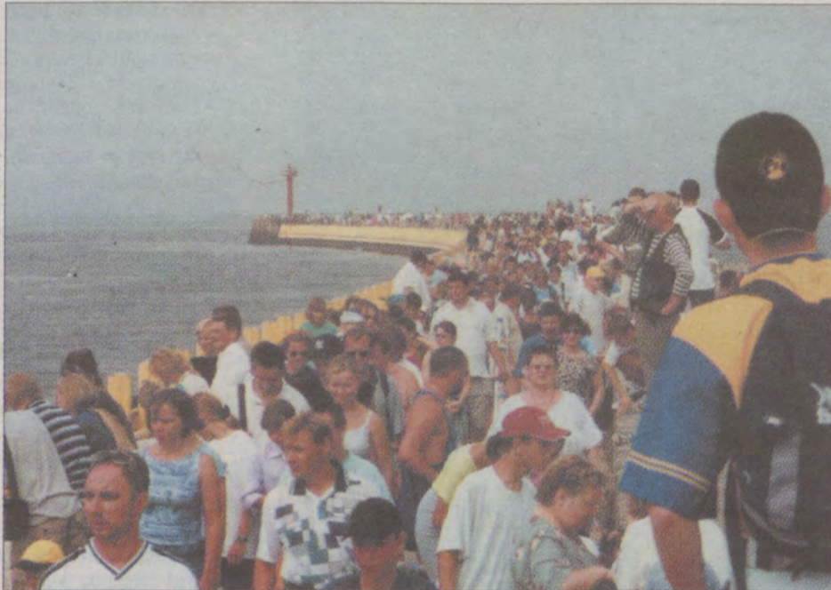
W sobotę moło w DarłóWKu było wypełnione po brzegi.

Sprawdzono w ten sposób wspólne działania Stra-