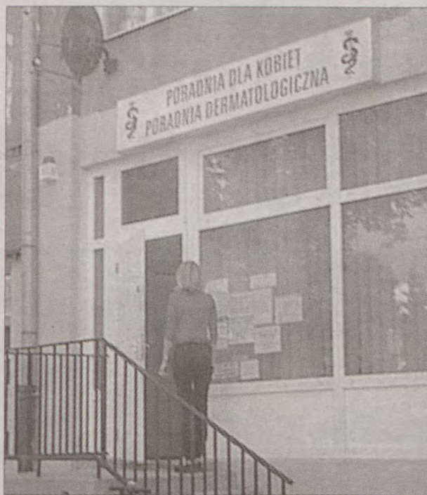
Powstanie Niepublicznych ZOZ pozwoliło mieszkańcom na wybór miejsca leczenia i własnego lekarza.

Najczęściej w niepublicznych ośrodkach można uzyskać porady w zakresie leczenia specjalistycznego jak również podstawowej opieki zdrowotnej. Korzystający nie muszą martwić się o pieniądze, bo warunkiem działania Niepublicznego ZOZ jest podpisanie umowy z odpowiednią Kasą Chorych.