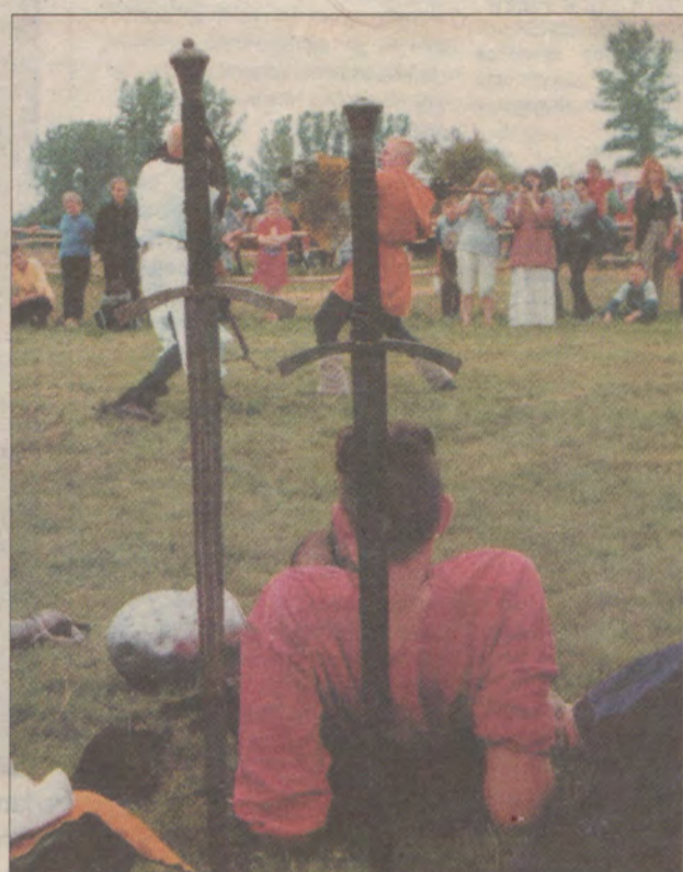
Grunwald w Sławsku?