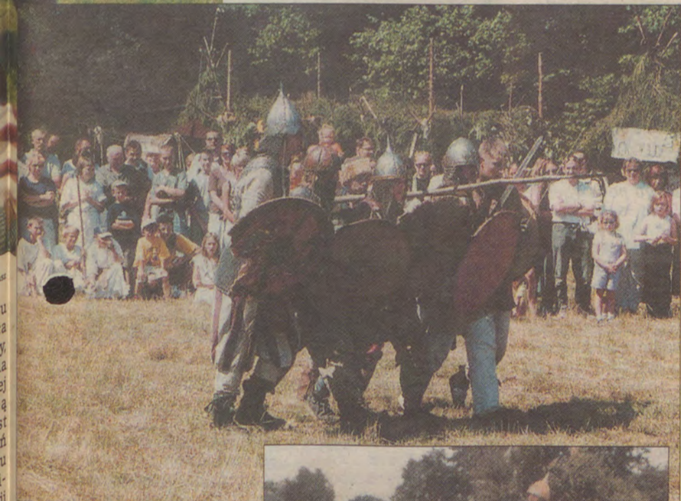
Rycerze Mieszka I w zwałym szyku.