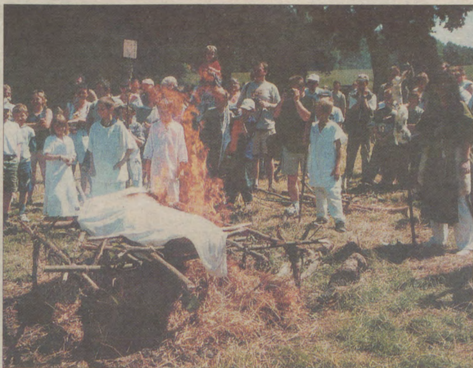
W Borkowie spalono wójnika, który poległ w walce.