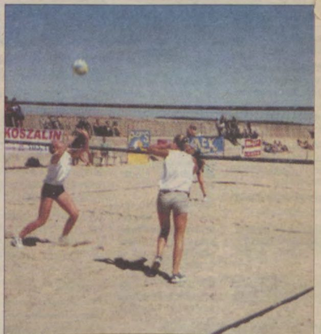
Siatkówka plażowa zdobywa coraz więcej zwolenników.