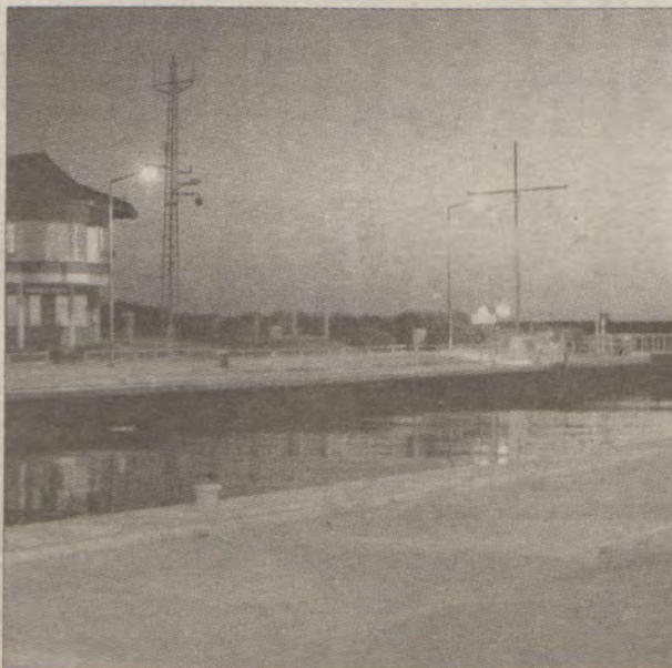
Większość imprez podczas Dni Darłowa odbędzie się na deptaku w pobliżu latarni morskiej.