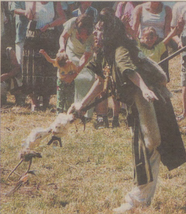
Wiedźma cofała festynowiczów przez „bramę czasu” o 5 tysięcy lat.

- W swoich planach nie zapominam o polu namiotowym czy parkingu - mówi Bryl. - Już w tej chwili, gdy moje „Brylowo” dopiero powstaje, przyjeżdżają do mnie wycieczki z Polski, ostatnio byli też Włosi.