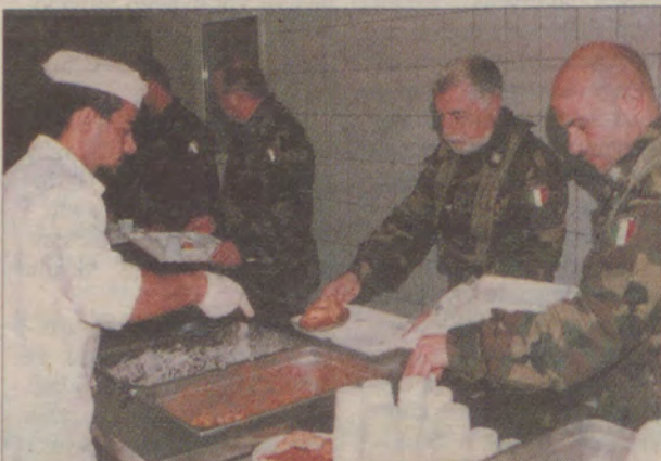
Humory wróciły wszystkim w stołówce. Włosi genialnie połączyli w potrawach swoją tradycję kulinarną z polskimi akcentami.