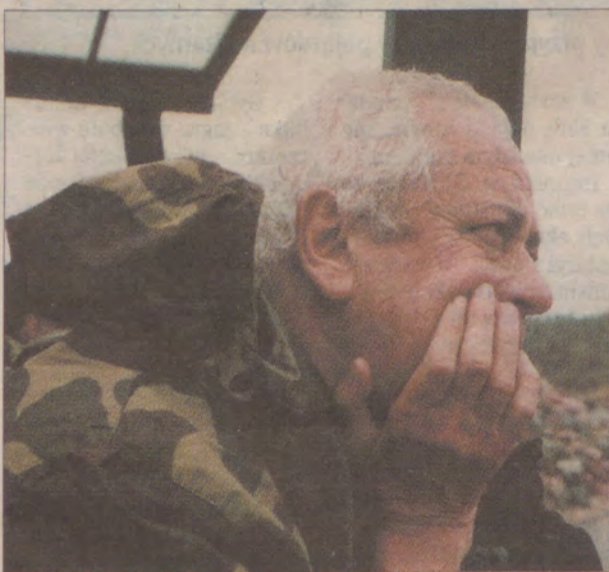
Ambasador Italii w Polsce Luca Daniele Biolati wyglądał na zmartwionego brakiem trafień.