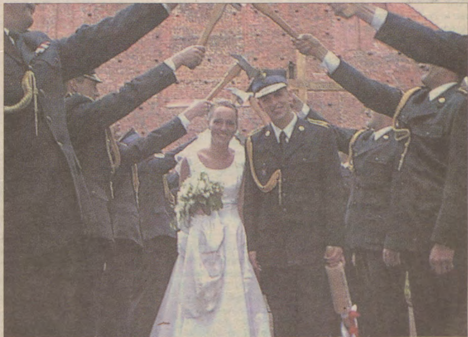
Później przeszła pod szpalerem, na końcu którego czekała na nich drabina z windą.