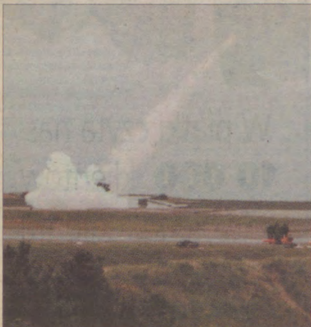
Jeden strzał kosztował ponad 100 tys. marek.