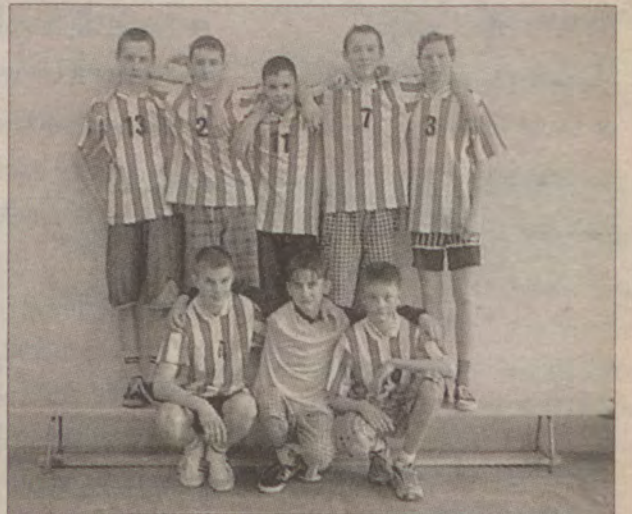
Drężyna sławińskiego gimnazjum.

W zawodach tej rangi, gdy chodzi przede wszystkim o propagowanie sportu i rekreacji wśród młodzieży, organizatorzy wręcz od tej formy odstrasza. Jest to tym bardziej niezrozumiałe,