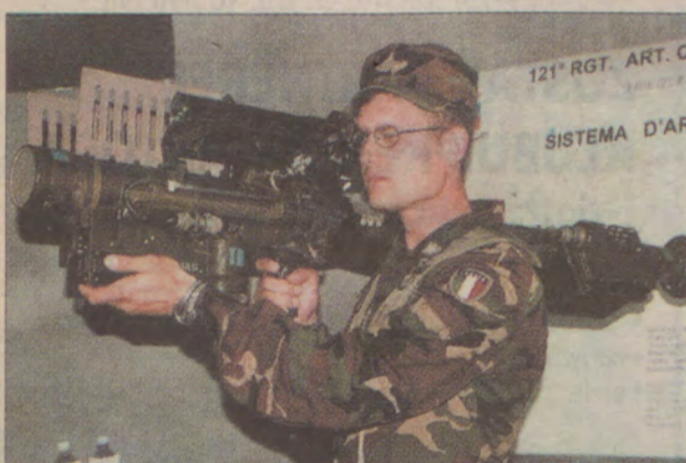
Stinger w całej okazałości.