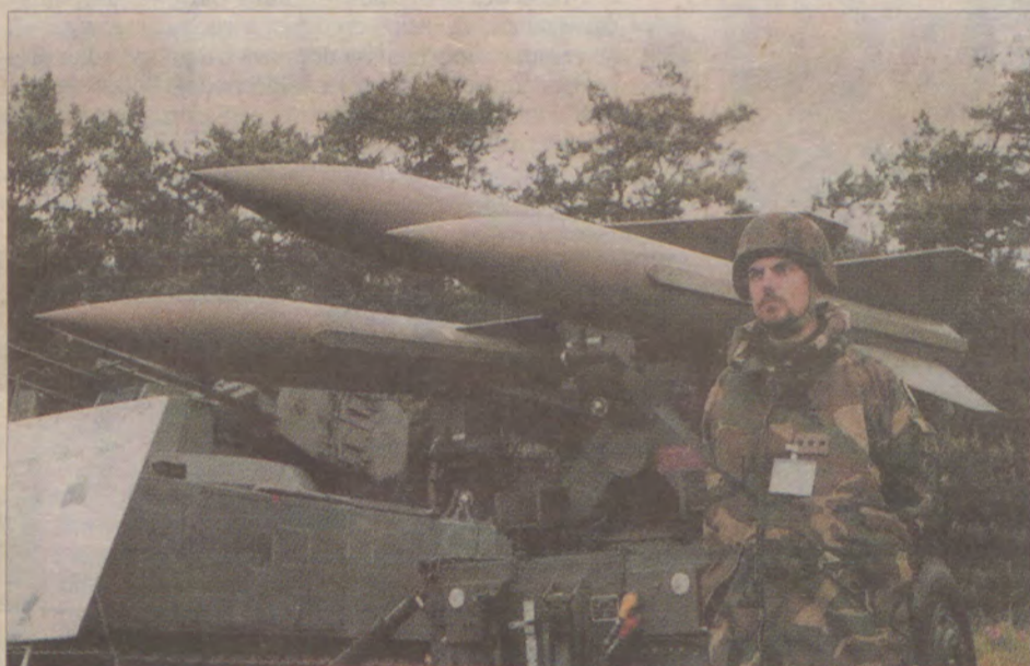
Stanowisko zintegrowanego systemu obrony przeciwlotniczej HAWK.