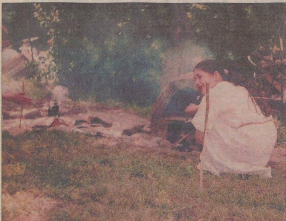
W chlebowym piecu pieczono dla całej wioski chleb i placki. Ogień pod piecem był podtrzymywany przez całą dobę.