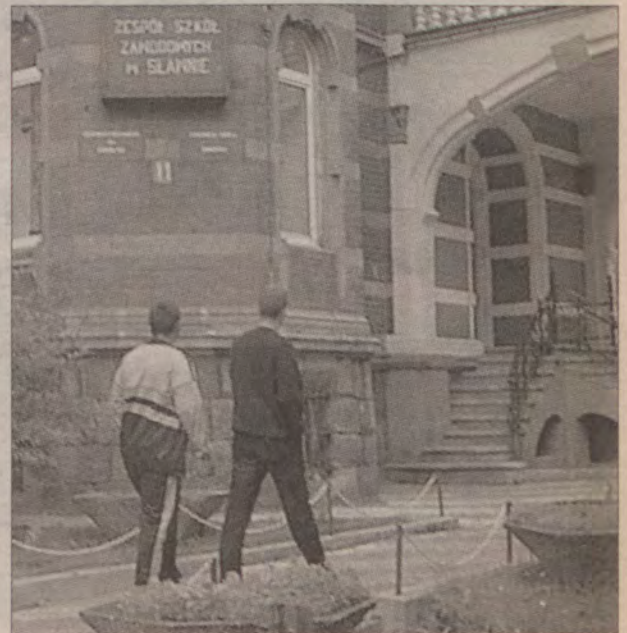
Drugoroczni będą chodzić do powiatowej klasy pierwszej.