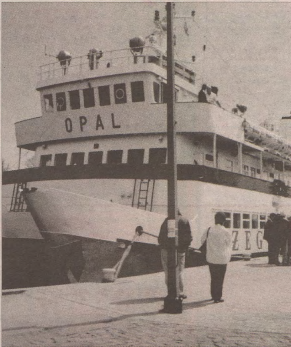
Katamaran „Opal” wypłynie z darłowskiego portu w pierwszym tygodniu lipca.

Rada Ministrów ustawiła dwa tygodnie na zapoznanie się z dokumentem i podjęcie odpowiedniej decyzji. Dopiero po tym czasie pismo trafia do podpisu na biurko premiera.