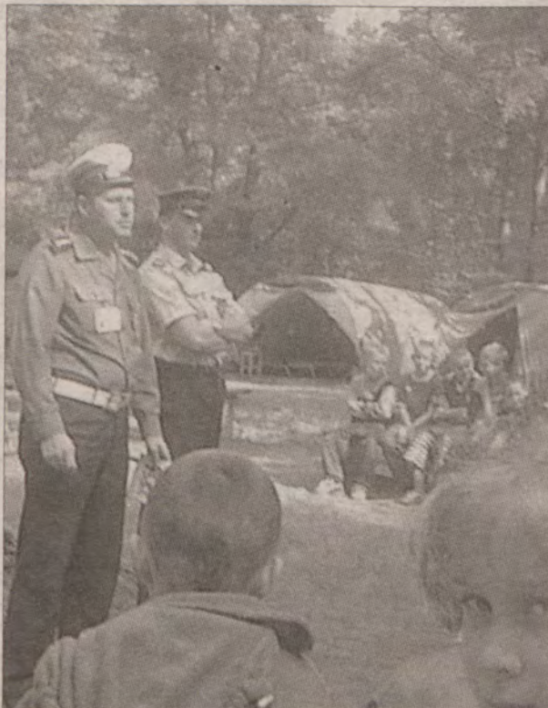
W ubiegłym roku policjanci organizowali pogadanki o bezpieczeństwie dla dzieci.

Podobnie sytuacja przedstawia się w rejonie