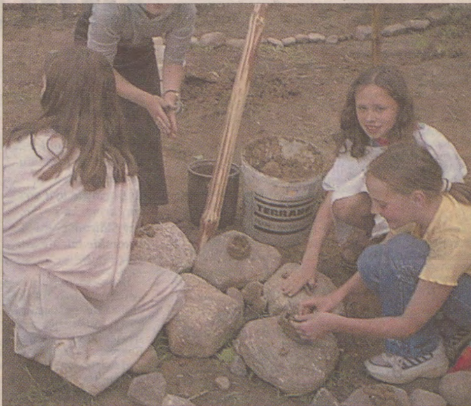
Każdy mógł zrobić dla siebie gliniany garnek lub kubek.