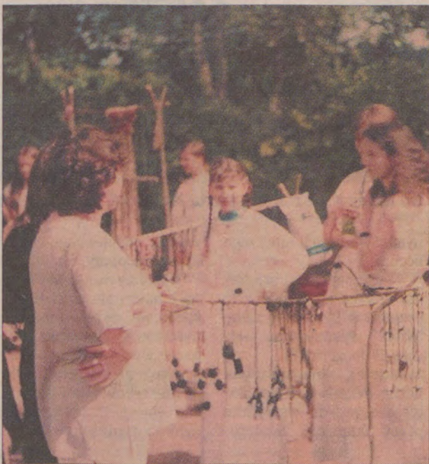
Największym powodzeniem cieszyły się wykonane przez mieszkańców wioski amulety i talizmany.