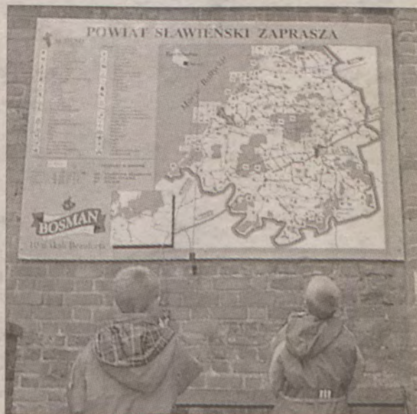
Powiatowe Centrum Informacji Turystycznej działa m.in. w darłowskim zamku.