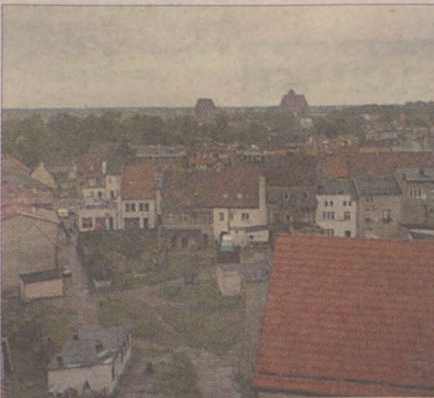
W Darłowie pozostało około 3500 osób. Do tego dochodzili uciekinierzy i ewakuowani. Ogarnęła ich psychoza ucieczki.