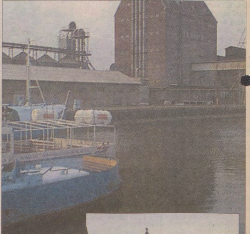
Gdy drogi lądowe zostały zablokowane przez wojska radzieckie pozostała tylko ucieczka przez morze.