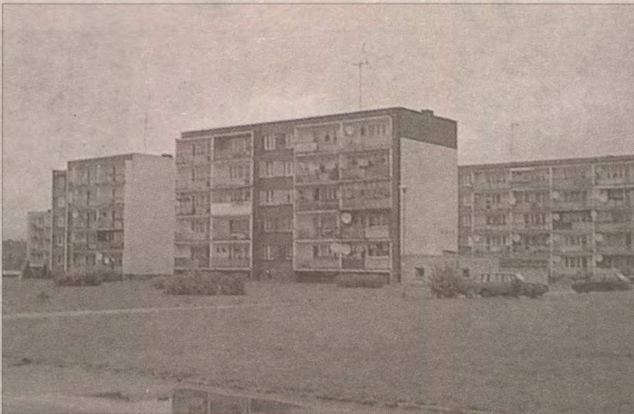
Teraz spółdzielnie same będą decydowały o cenie wykupu mieszkań.

Wyrok trybunału oznacza, że mieszkania lokatorskie będą przekształcane tak jak pozostałe lokale tj.