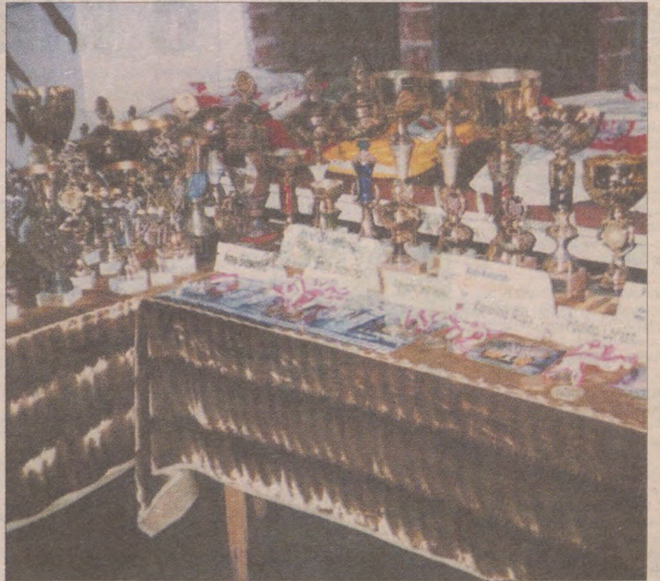
Zawodniczki KK Ziemia Darłowska mają na swoim koncie 30 medali i pucharów mistrzostw Polski.