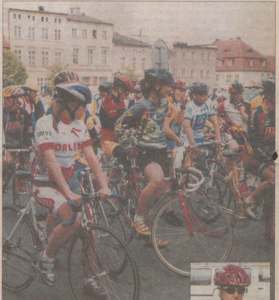
Na starcie w Darłowie stanęło ponad 100 zawodniczek.

W kategorii Open (seniorki i juniorki) na mecie zameldowała się czołówka złożona z około 20 zawod-