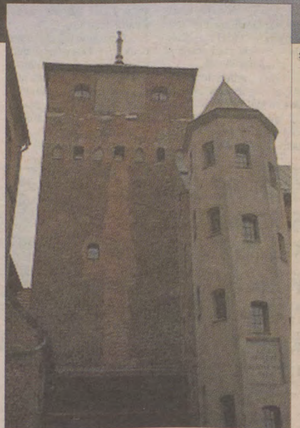
Zamek, cegielnię i spichlerze przeznaczono na ewakuowany sprzęt wojskowy.