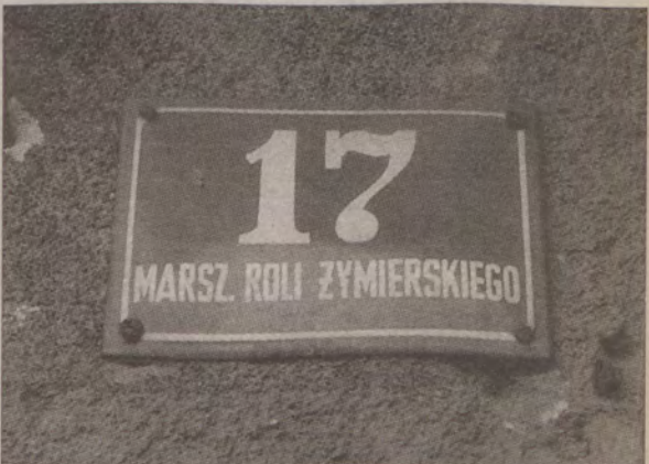
A może jej dowódcą był generał Rola-Żymierski?