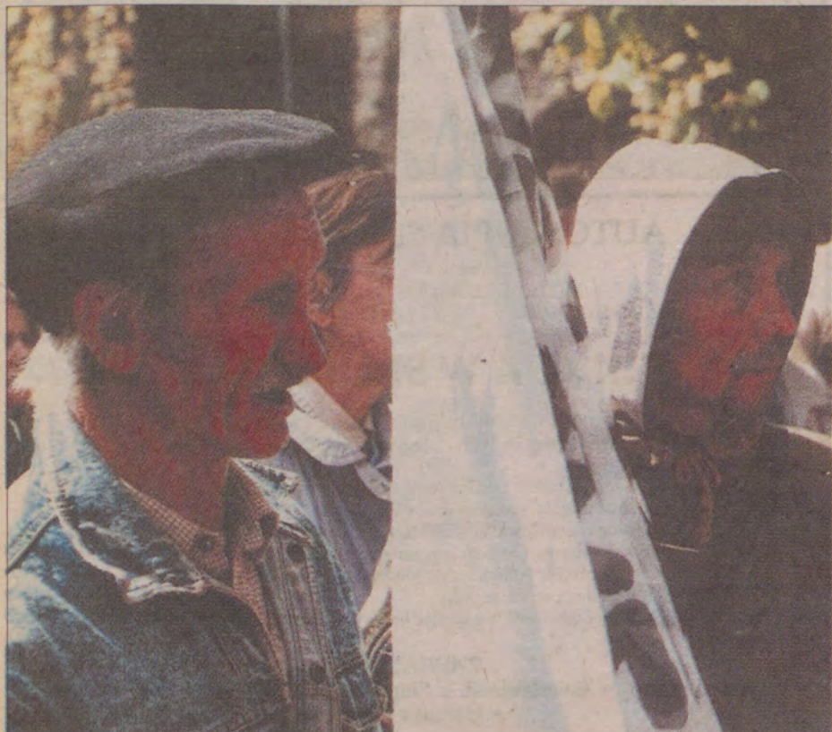
Nie ma nadziei, pozostała desperacja.