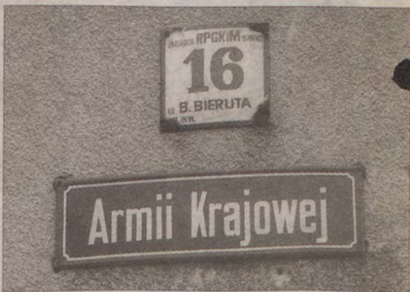
Czy towarzysz prezydent przewodził Armii Krajowej?...