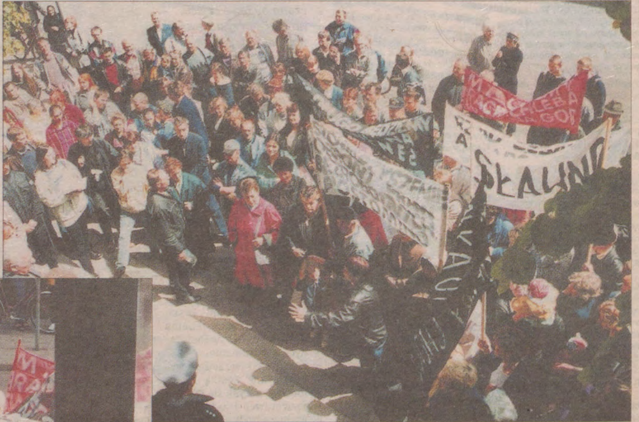
Około 100 osób zebrało się przed ratuszem.