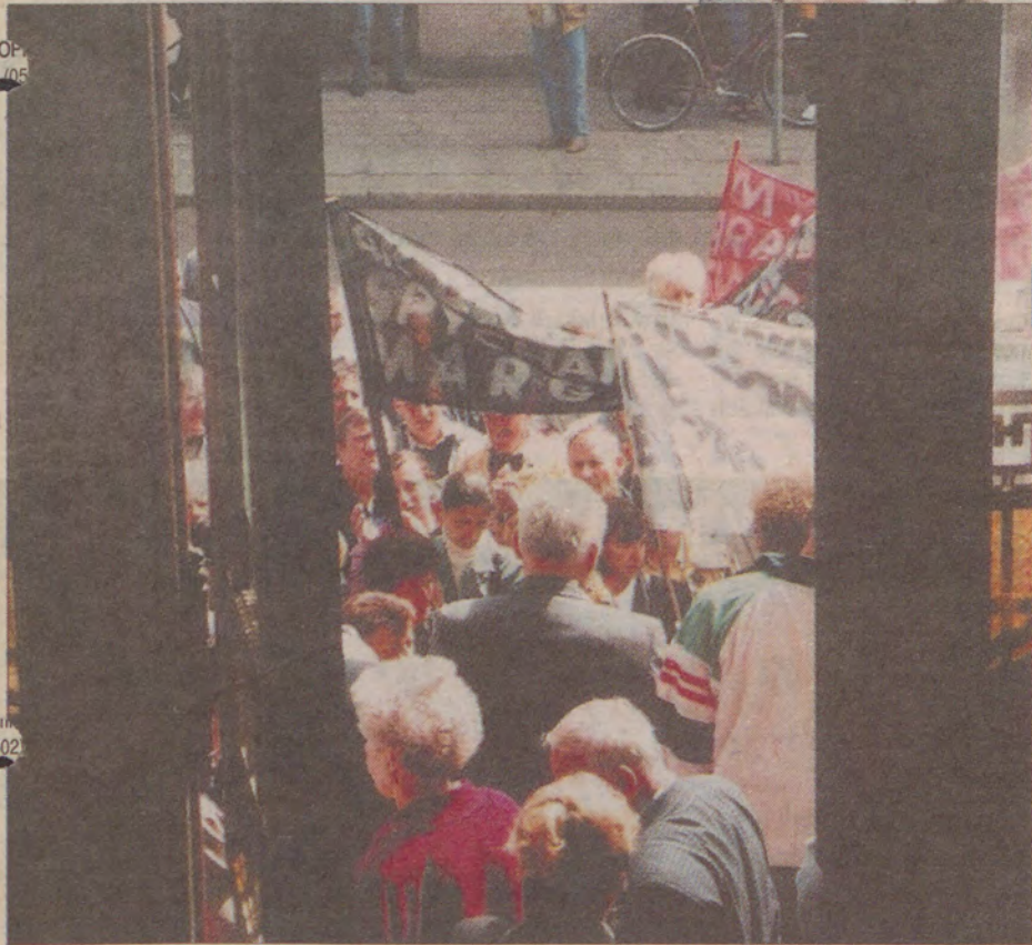
Dwa światy: tłum bezrobotnych nie mógł wejść do urzędu.