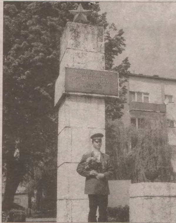
Przeszość w Sławnie jest ciągle żywa.

- Do redakcji „Dziennika” przychodzą mieszkańcy Sławna i pytają, kiedy zostaną zlikwidowane tabliczki ze starymi nazwami ulic. Czy potrafi pan na to pytanie odpowiedzieć?