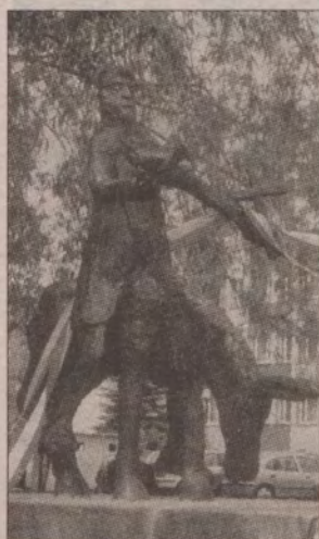
Pomnik stanął przy Bramie Koszalińskiej.