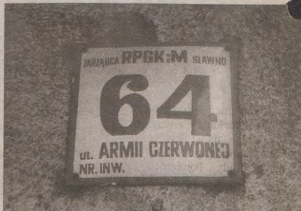
To jest ulica Gdańska. Armia Czerwona przygotowuje się do natarcia na miasto Artusa?