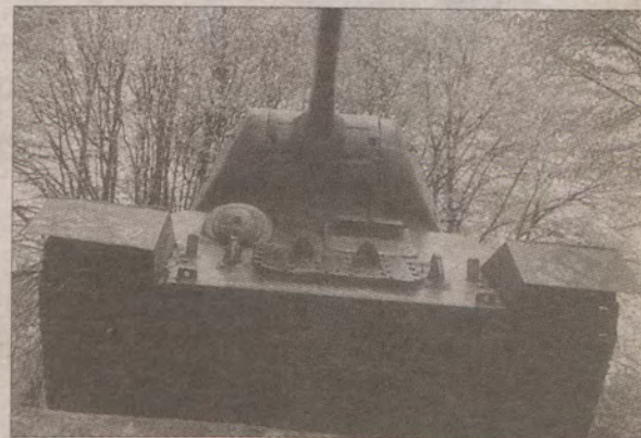
Lufa T-34 wycelowana jest w kierunku Berlina. Celuje też w przechodniów.