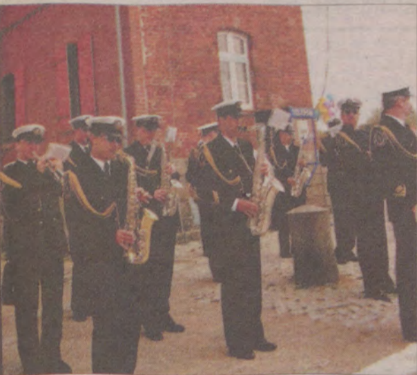
Otwarcie terminalu uświetnił koncert orkiestry reprezentacyjnej Straży Granicznej.