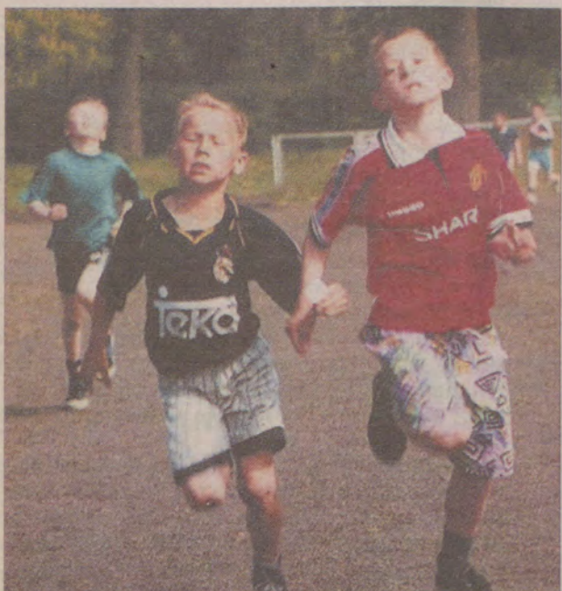
Wola wygranej najbardziej uwidoczniła się u najmłodszych uczestników.