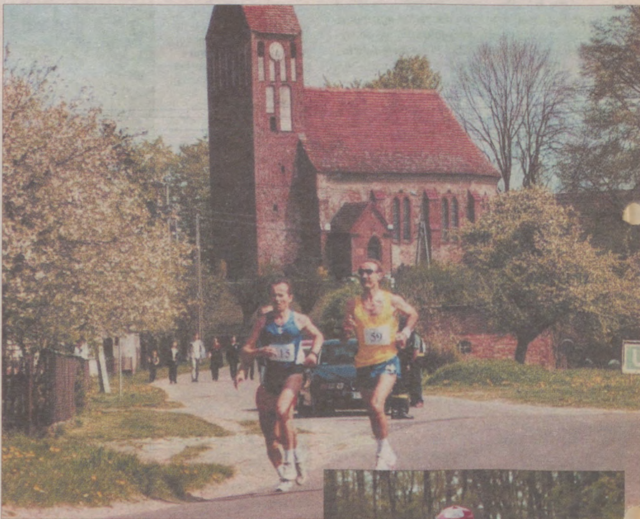
Bieg miał również propagować walory sławińskiej ziemi.