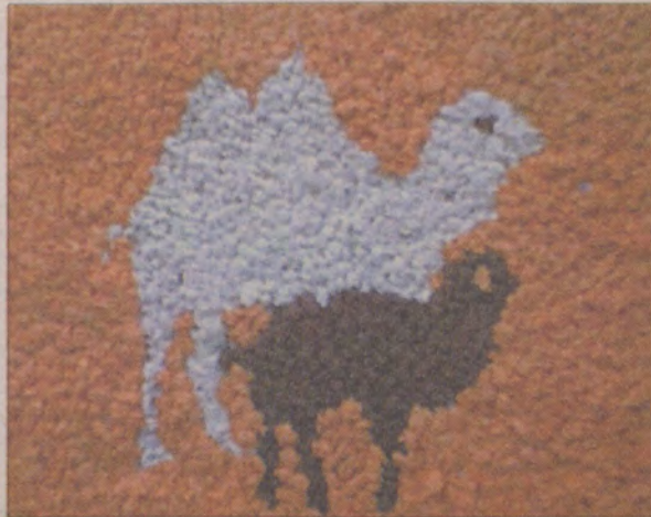
Paweł Jaroszewicz „postawił” na Tymona.