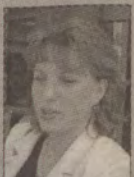
Fot. M. Majewska

Zdecydowanie jestem za montażem takiego urządzenia. To pomaga, chociażby dlatego, że dzięki zegarowi wiem, która jest godzina. Ponadto jest to niewątpliwie atrakcją dla miasta. Może być ta melodia, która była do tej pory, choć nie mam nic przeciwko jej zmianie.