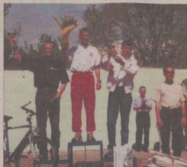
Zwycięcy na podium.