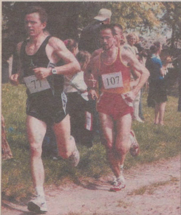
Trasa wiodła m. in. polnymi ścieżkami.

Nasz fotoreporter towarzyszył biegaczom wzdłuż całej trasy, a oto jego żniwo. (gam)