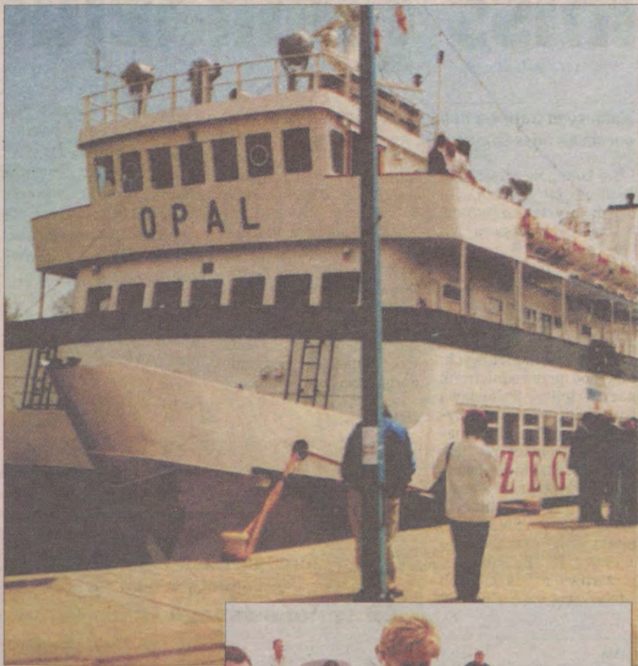
Katamaran „Opal” jest już gotowy do wypłynięcia w pierwszy rejs z Darłówka.

Sam terminal, który stanął na lewym brzegu Wieprzy, 100 metrów od wejścia do portu, spełnia wymogi Unii Europejskiej. Parterowy budynek ma powierzchnię 178 m kw. i jest wyposażony w nowoczesny system