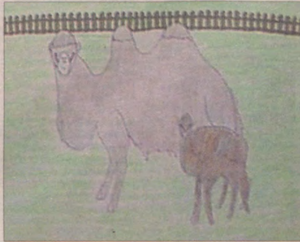
Bracia Klube wymyślili oryginalne imiona - Tomasz wymyślił Fapcia...