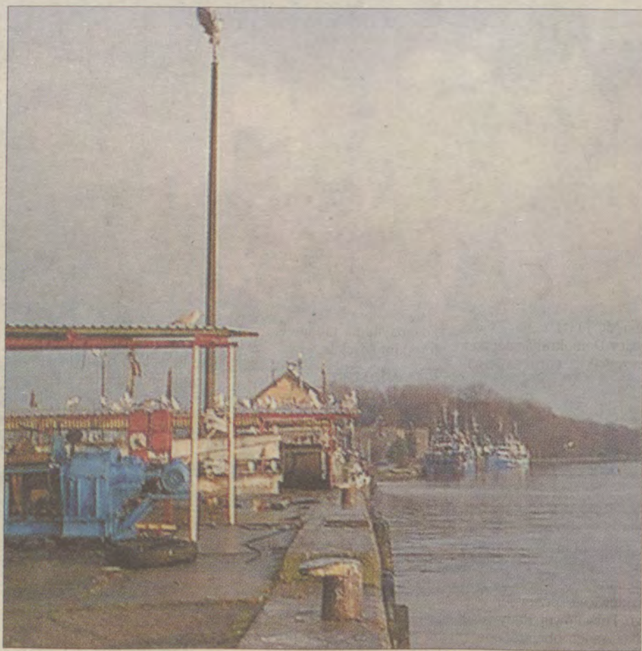
Wyjście z portu zawsze wywołuje nutę nostalgii za tym, co zostaje na lądzie.