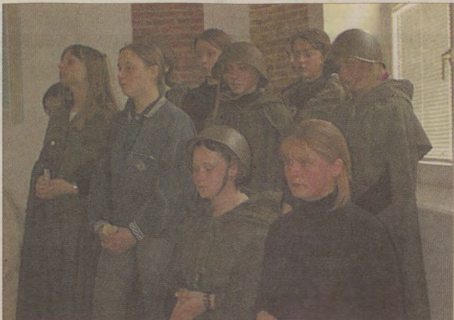
Harcerze ze Sławna przygotowali się do występu w święto Konstytucji 3 maja przez kilka tygodni.