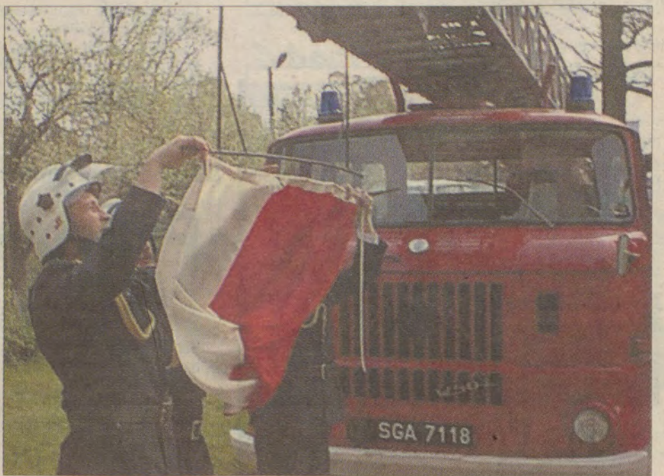
Strażacy w dzień św. Floriana bawili się we własnym gronie.