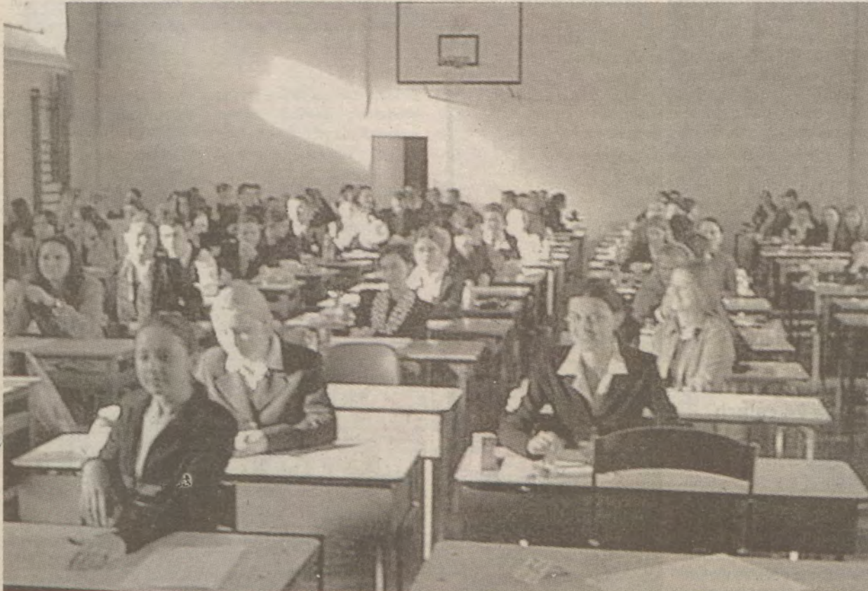
W sławińskim liceum do matury przystąpiło 120 maturzystów.