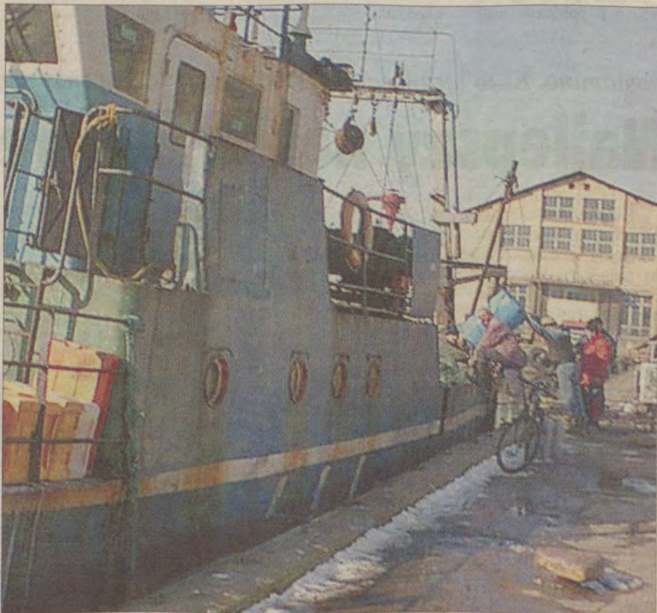
Ciekawe, co by powiedział gość na zwykłej stacji, jakby ktoś zamówił cztery tony ropy?