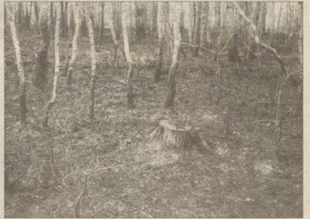
Tyle zostało z hektara młodego lasu.