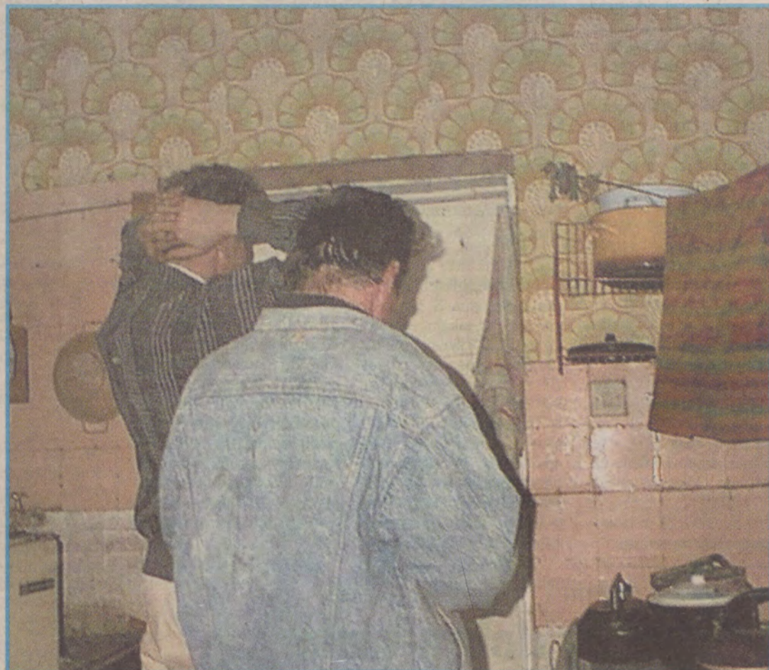
W tym domu w Sławnie mieszkańcy czekają już na eksmisję.