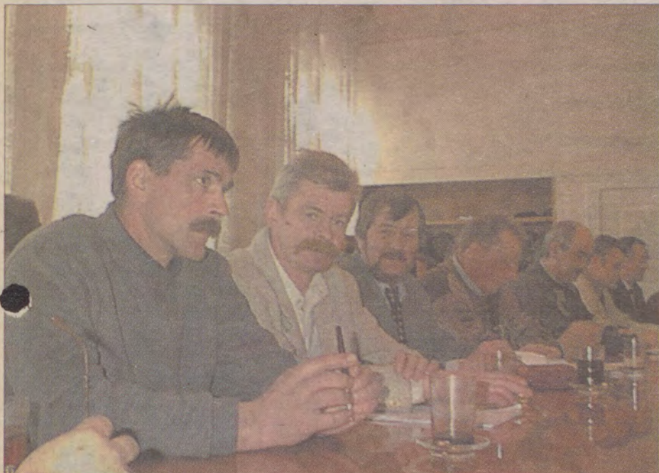
Sprawa poruszana była na ostatnim posiedzeniu Rady Gminy Sławno.