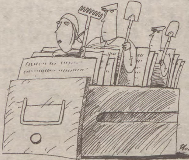
Rys. Bartłomiej Brosz

Niektórzy z ubiegających się o odszkodowanie na odpowiednio dokumenty cze-