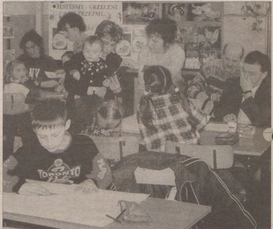
Rodzice z trudem mieścili się w szkolnych ławkach, ale bawili się przednio.

Najważniejszym celem tych spotkań jest zapoznanie rodziców z metodami nauczania, jakie stosowane są w szkole. I nie tylko zapoznanie, ale wzięcie w nich czynnego udziału. Także dzieci mogły poznać swoich rodziców z całkiem