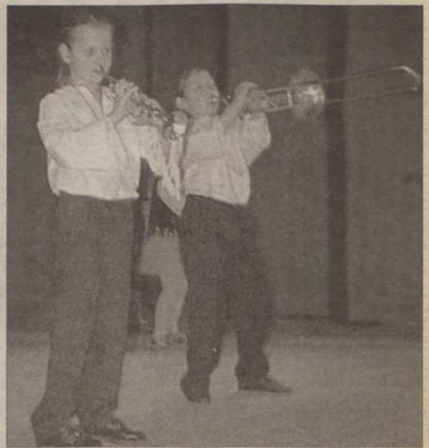
Dzieci z Przedszkola nr 4 z powodzeniem parodiowali Golec u'Orkiestrę.