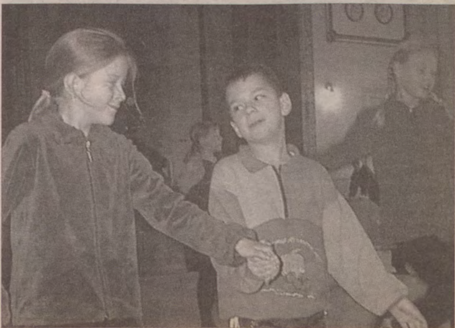
Darłowski Ośrodek Kultury - warsztaty tańca Break Dance.