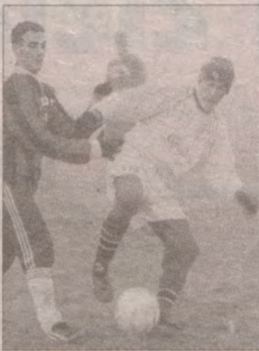
W czasie ferii na młodzież czeka wiele atrakcji, także sportowych.

POWIAT SŁAWIEŃSKI. Młodzież wypoczywającą w czasie ferii w powiecie sławińskim czeka wiele ciekawych zajęć, przez szkoły, Ośrodki Sportu i Rekreacji, ośrodki kulturalne. Organizowane będą zajęcia sportowe, plastyczne, muzyczne, zabawy i konkursy. Ośrodek Sportu i Rekreacji oraz Gimnazjum Miejskie w Sławnie przygotował dla młodzieży w drugim tygodniu ferii wiele imprez rekreacyjno-sportowych.