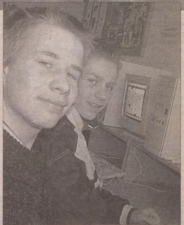
Uczniowie szkoły podstawowej w Malechowie korzystają podczas ferii z pracowni komputerowej.