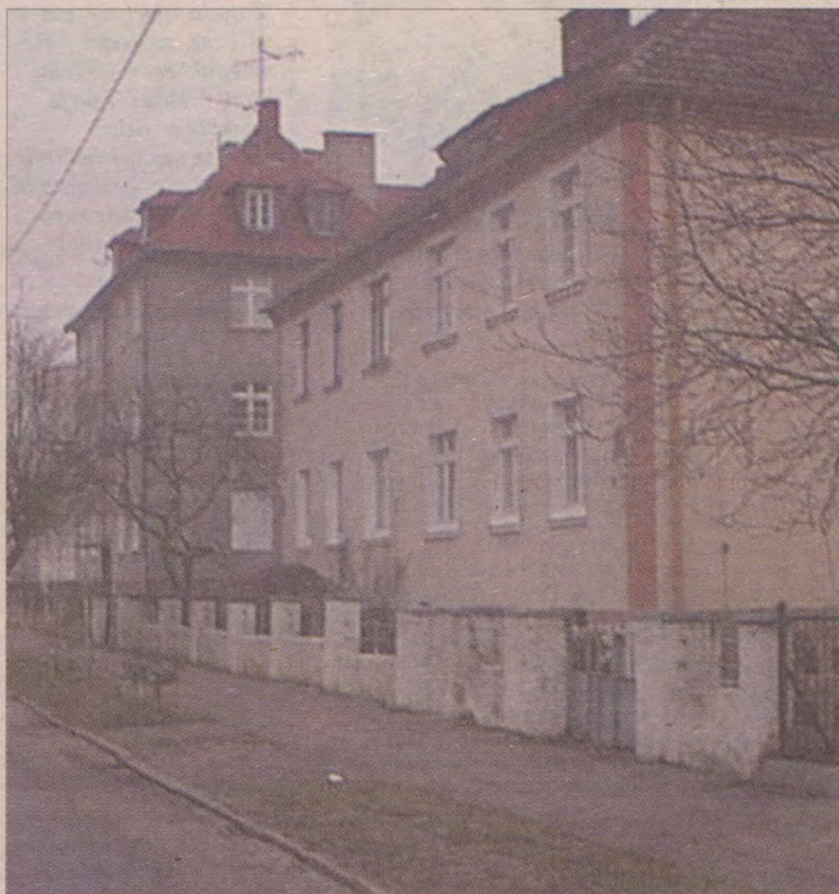
Domy przy ul. Powstańców Warszawskich zbudowano pod koniec lat dwudziestych.

Ówczesne władze miejskie postanowiły także zadbać o wypoczynek i rekreację sławnian. Uporano się z wylewającą Wieprzą już w wieku poprzednim. Teraz przyszedł czas na zagospo-