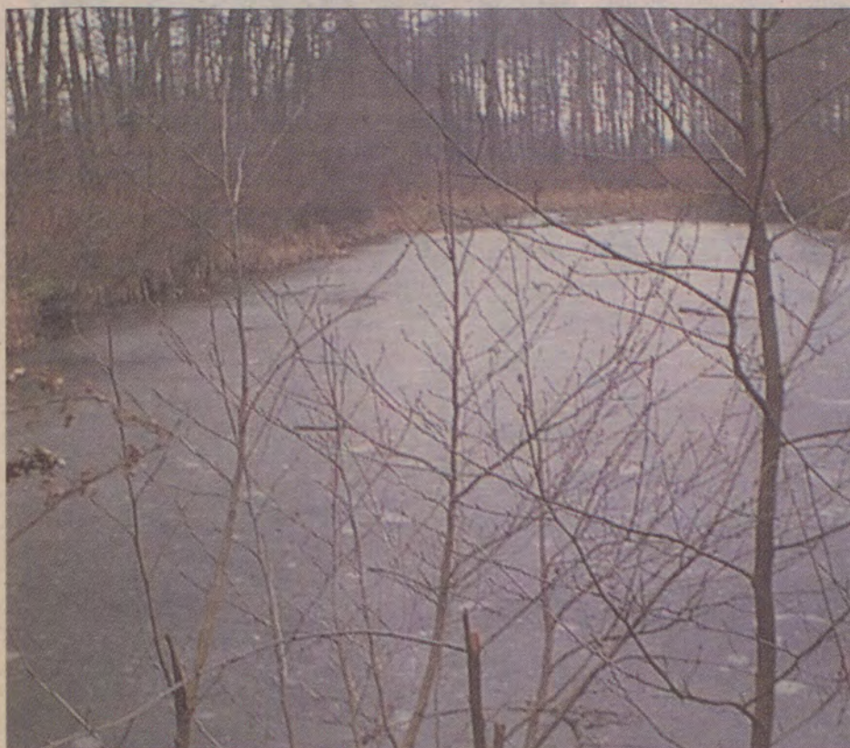
Grobla przez nabrzeżne bagna była i jest jednym z najchętniej uczęszczanych szlaków spacerowych.