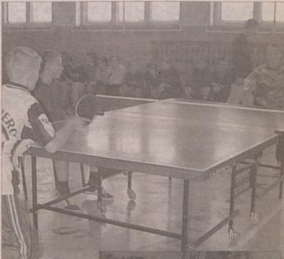
Mistrzostwa gminy w tenisie stołowym w SP w Dobiesławiu.

O dzieciach i młodzieży nie zapomnieli też szkoły gminy Malechowo. Atrakcji nie zabrakło, zwłaszcza dla uczniów lubiących aktywny wypoczynek. Zimowy wypoczynek szkoła podstawowa w Niemicy rozpoczęła powitaniem uczniów, zabawami orientacyjno-porządkowymi oraz turniejem sprawnościowym i rysunkowym. Na następny dzień dzieci i młodzież wyjechały do Darłowa, gdzie spacerowały po plaży, zbierały muszle i kamienie, była możliwość wejścia na basen. W kolejnych dniach odbyły się rozgrywki sportowe, konkurs rysunkowy o tematyce ekologicznej z wykorzystaniem zbiorów naturalnych, wyjazd do kina do Sławna i zwiedzanie miasta. Pierwszy tydzień ferii