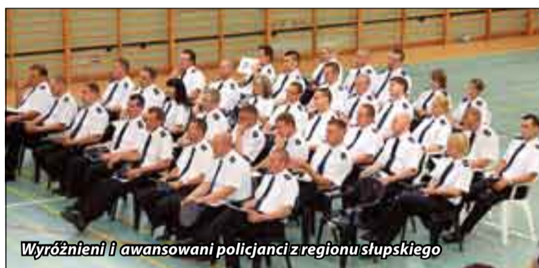
Wyróżnieni i awansowani policjanci z regionu słupskiego