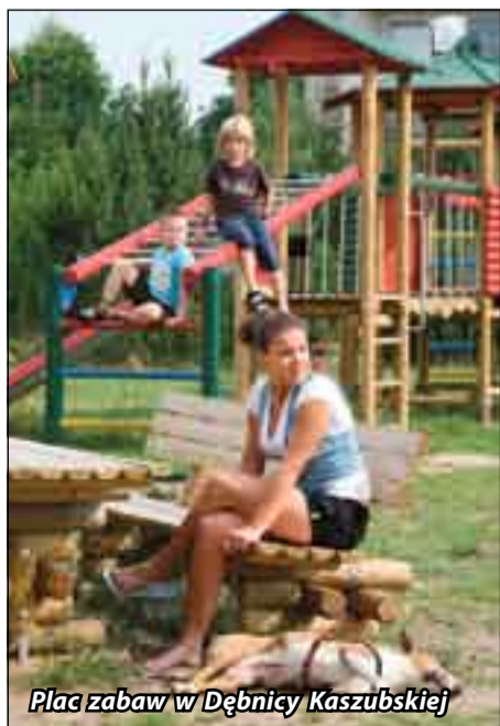
Plac zabaw w Dębicy Kaszubskiej