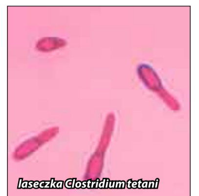
Laseczka Clostridium tetani

Leczenie tężca zawsze odbywa się w szpitalu. Konieczne jest podawanie antybiotyku. Rów-