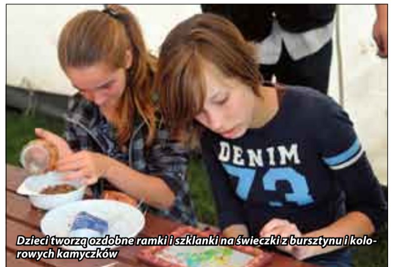
Dzieci tworzą ozdobne ramki i szklanki na świeczki z bursztynu i kolorowych kamyczków