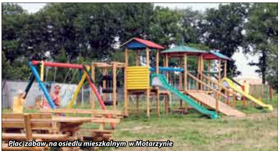
Plac zabaw na osiedlu mieszkalnym w Motarzynie