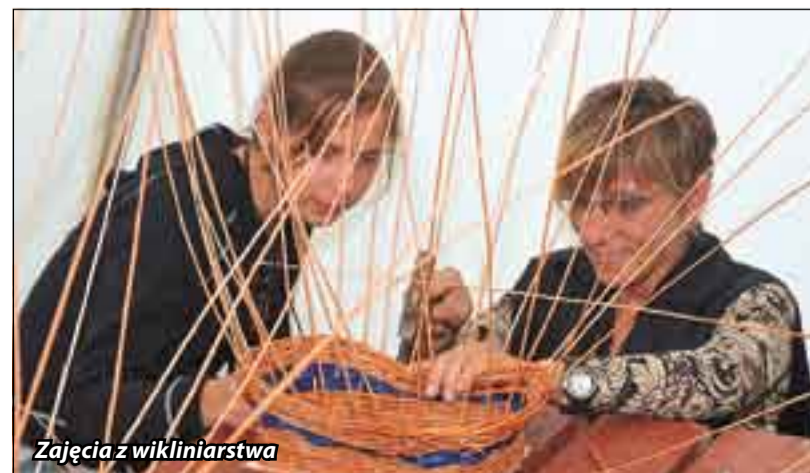
Zajęcia z wikliniarstwa