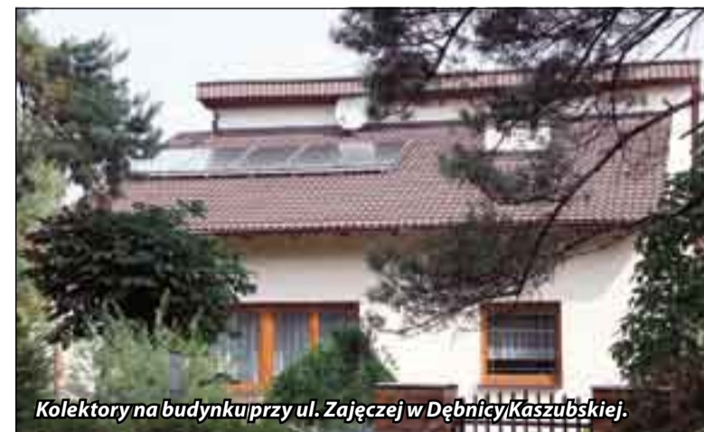
Kolektory na budynku przy ul. Zajęczej w Dębicy Kaszubskiej.

Ideą przyświecającą autorom projektu było objęcie nim jak największej liczby domostw i budynków znajdujących się na terenie gminy. A ponieważ program wojewódzki uniemożliwia włączenie do projektu domostw użytkowanych indywidualnie przez mieszkańców gminy, samorząd nawiązał współpracę w tym zakresie ze Stowarzyszeniem na Rzecz Rozwoju Gminy Dębica Kaszubska „AVANTI” i Stowarzyszeniem Przyjaciół Niepogledzia i Gałęzowa „SPERANDA”. Dzięki temu będzie można zakupić