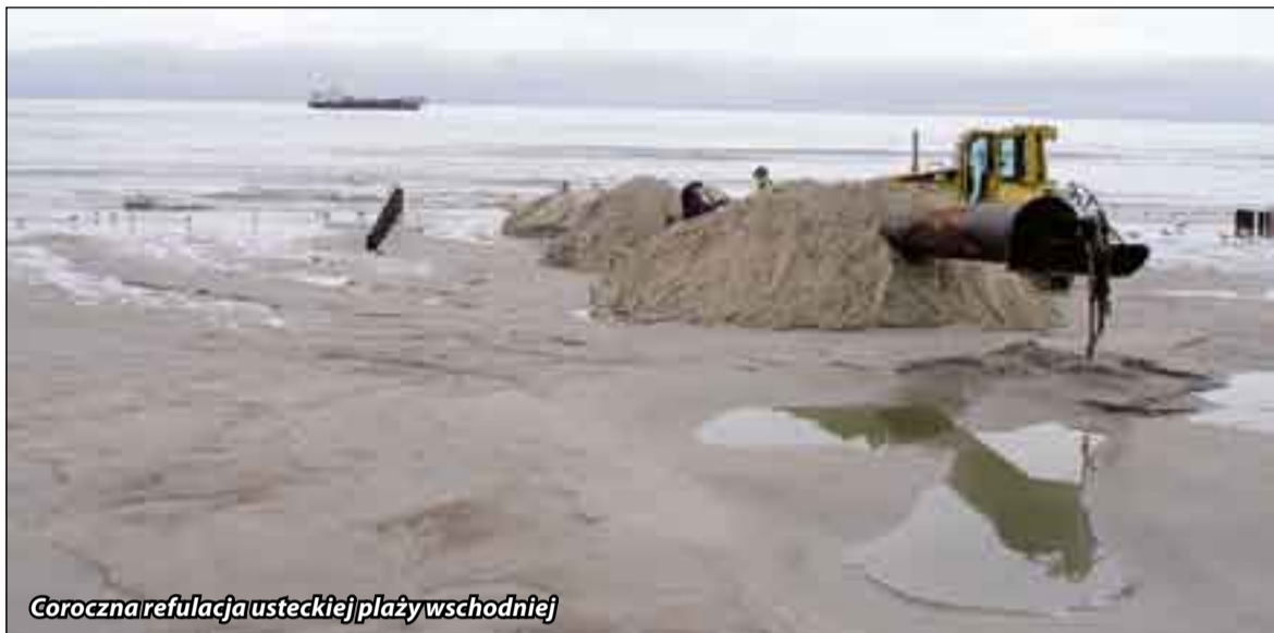
Coroczna refulacja usteckiej plaży wschodniej

Pierwszy raz od wielu lat słupski Urząd Morski zamierza zainwestować duże pieniądze w ochronę brzegu morskiego w Ustce. Będzie zabiegał o 200 milionów złotych z Unii Europejskiej na trzy projekty: w Ustce, Łebie i Rowach. Inwestycja w Ustce ma pochłonąć 100 milionów.