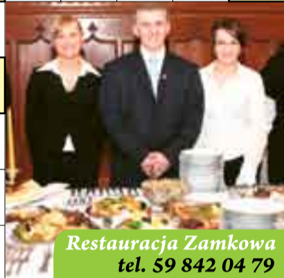
Restauracja Zamkowa tel. 59 842 04 79

Litery z zaznaczonych kratek, uszeregowane od 1 do 19 utworzą rozwiązanie – Przysłowie. Nagrodą jest kolacja dla dwóch osób w restauracji Hotelu „Zamkowy” w Słupsku, ul. Domini-kańska 4.