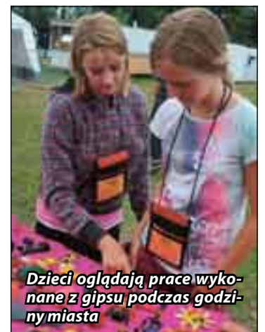
Dzieci oglądają prace wykonane z gipsu podczas godziny miasta