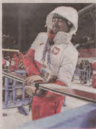
Małysz bardzo rozczarowała postawa organizatorów

Nik zmienia Pan też zdania: „Najcieplejsi wkur i rozpierzdzić wszystkich tam na górze?"