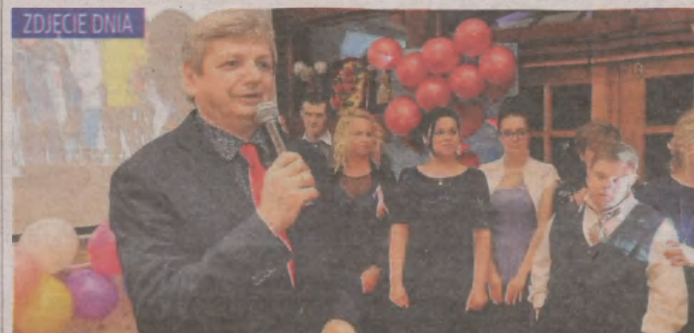
W sobotę w gościu Doliny Charlotty odbył się XIV Bal Charytatywny na rzecz mieszkańców DPS w Machowinku. Jego organizatorem jak zwykle było Stowarzyszenie „Przyjacieli” przy wsparciu Doliny Charlotty i licznych Sponsorów. Więcej wkrótce w „Głosie”.

ważnych wymogach: musisz być osobą fizyczną, prawną lub jednostką organizacyjną, która nie posiada osobowości prawnej; musisz posiadać gospodarstwo rolne o łącznej powierzchni gruntów rolnych, zadrzewionych lub zakrzewionych na użytkach rolnych przekraczających 1 ha lub 1 ha przeliczeniowy jeśli jesteś współwłaścicielem danych gruntów, pozostali współwłaściciele powinni wyrazić pisemną zgodę na otrzymanie przez Ciebie zwrotu za paliwo rolnicze. Jeśli posiadasz nr KRS, należy go podać we wniosku. ©(M)