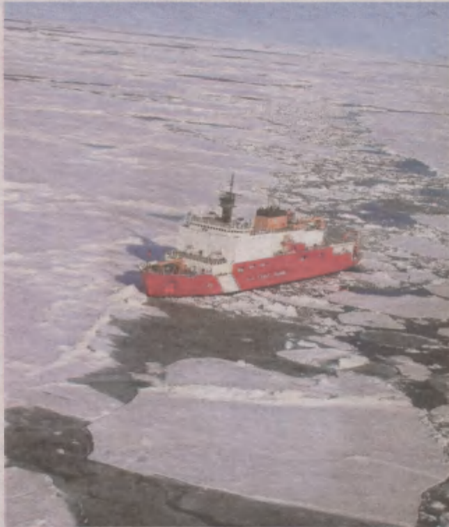
Polska Akademia Nauk poszukuje kandydatów do kolejnej wyprawy na biegun południowy.

Fachowcy poszukiwani Rekrutację prowadzi Instytut Biochemii i Biofizyki Polskiej