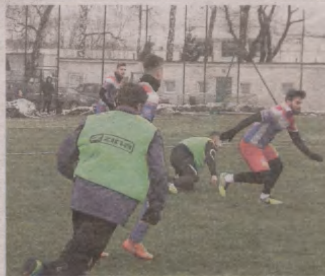
Słupszczanie w ostatniej chwili wywalczyli remis

Również remis w Słupsku, gdzie zmierzli się dwaj czwartoligowcy.