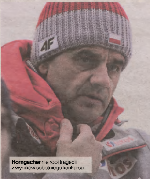
Horngacher nie robi tragedii z wyników sobotniego konkursu

Nie. Tonie jest rola trenerów i tonie jest dobrze odbierane, gdy chcą wywierać presję na jury. Musimy akceptować ich decyzje. To na nich spoczywa odpowiedzialność za prowadzenie zawodów, nie na szkoleniowcach.