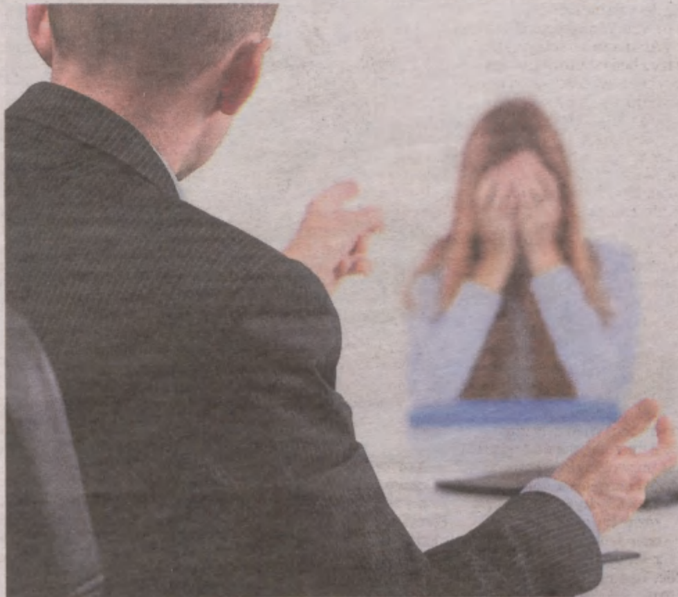
Mówi się, że jaka rozmowa kwalifikacyjna, taki jej skutek. Ten skutek zależy od kandydata.

Nie da się przewidzieć wszystkich pytań, które mogą paść podczas rozmowy, a leniektórych możliwości spodziewać. I nie chodzi tylko o kwestie związane z dotychczasową karierą oraz wykształceniem kandydata. Może on choćby usłyszeć: „Co Pan wie o naszym przedsiębiorstwie?”, „Jak Pan