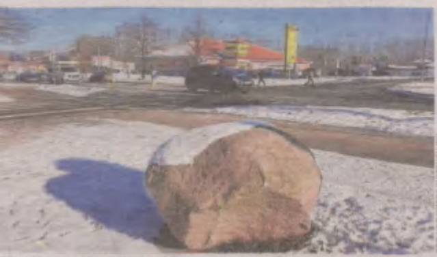
Głaz ma uniemożliwić parkowanie na miejskim trawniku

Strona od czytelników dla czytelników Na stronach Akcja redakcja piszemy o tym, o czym informujemy nas czytelnicy. Na Wasze sygnały czeka dziennikarz Daniel Klusek. Jeśli widzą Państwo coś, co Was zdenerwowało, poinformujcie nas o tym. Pod adresem: daniel.klusek@gp24.pl czekamy na e-maile z opisem sytuacji. Zachęcamy też do przesyłania nam fotografii. Interwencje można również zgłaszać pod nr. tel.: 59 848 8121. Wszystkie sygnały sprawdzimy, a najważniejsze i najciekawsze zamieścimy na łamach „Głosu Pomorza” igp24.pl. (DMK)