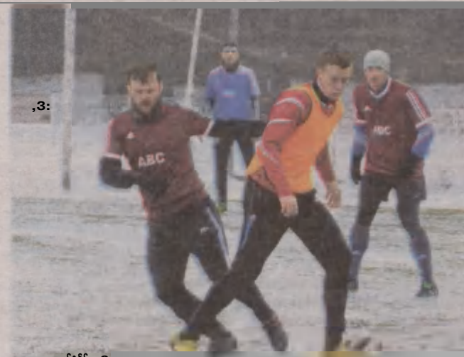
Pogoń Lębork ma za sobą zimowy sparing