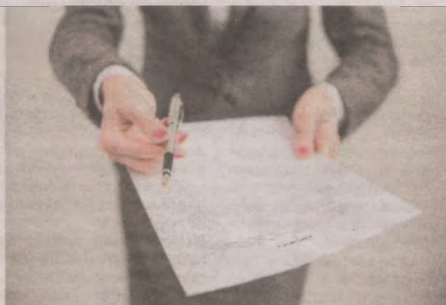
Firmy, które zdobędą status centrum B+R, zostaną zwolnione z podatku od nieruchomości, rolnego oraz podatku leśnego

- Polska od wielu lat ma ambicję dogonienia, a nawet wyprzedzenia Europy pod kątem innowacyjności. To będzie długi wyścig, wymagający nie tylko zaangażowania biznesu, ale