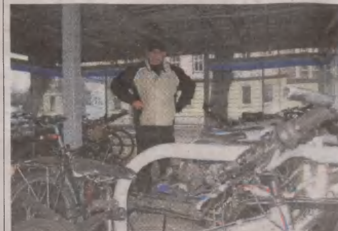
Przydworcowy parking rowerowy tak zatłoczony, że pompki nie wciśniesz

dworca na Zatorze to przyjemność po prawej stronie, a wyzwanie z lewej. Tak różne warunki panują na jednej i tej samej, przylegającej do dworca ulicy Kołłątaja. Tę gorszą część należałoby poprawić przy okazji modernizacji wspomnianego węzła i nowej organizacji ruchu samochodowego. Koncepcja całkowitego wykluczenia ruchu samochodowego sprzed zmodernizowanego dworca kolejowego spotyka się z taką samą dezaprobatą społeczną jak pomysły potraktowania kilofem tej niespełna 30-letniej budowli, która zastąpiła ponad 100-letnią. Obecna organizacja ruchu kołowego na al. Wojska Polskiego jest głupawa i niebezpieczna. ©