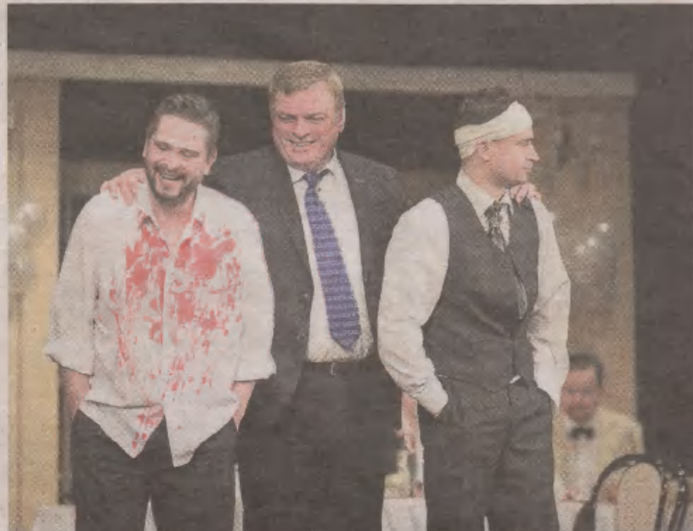
„Testosteron” to przebojowa komedia, w której panowie spotykają się na weselu, choć ślubu nie było. Spektakl zobaczymy w sobotę i niedzielę w Nowym Teatrze

„Testosteron” to jedna z najlepszych komedii, jaka powstała w słupskim teatrze. Spektakl jest historią siedmiu mężczyzn, którzy spotykają się w sali weselnej, choć ślubu nie było, bo niedoszła panna młoda uciekła sprzed ołtarza. Pano-