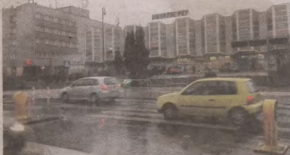
Budynek dworca zbudowano, gdy Słupsk był stolicą województwa i miał inną rangę