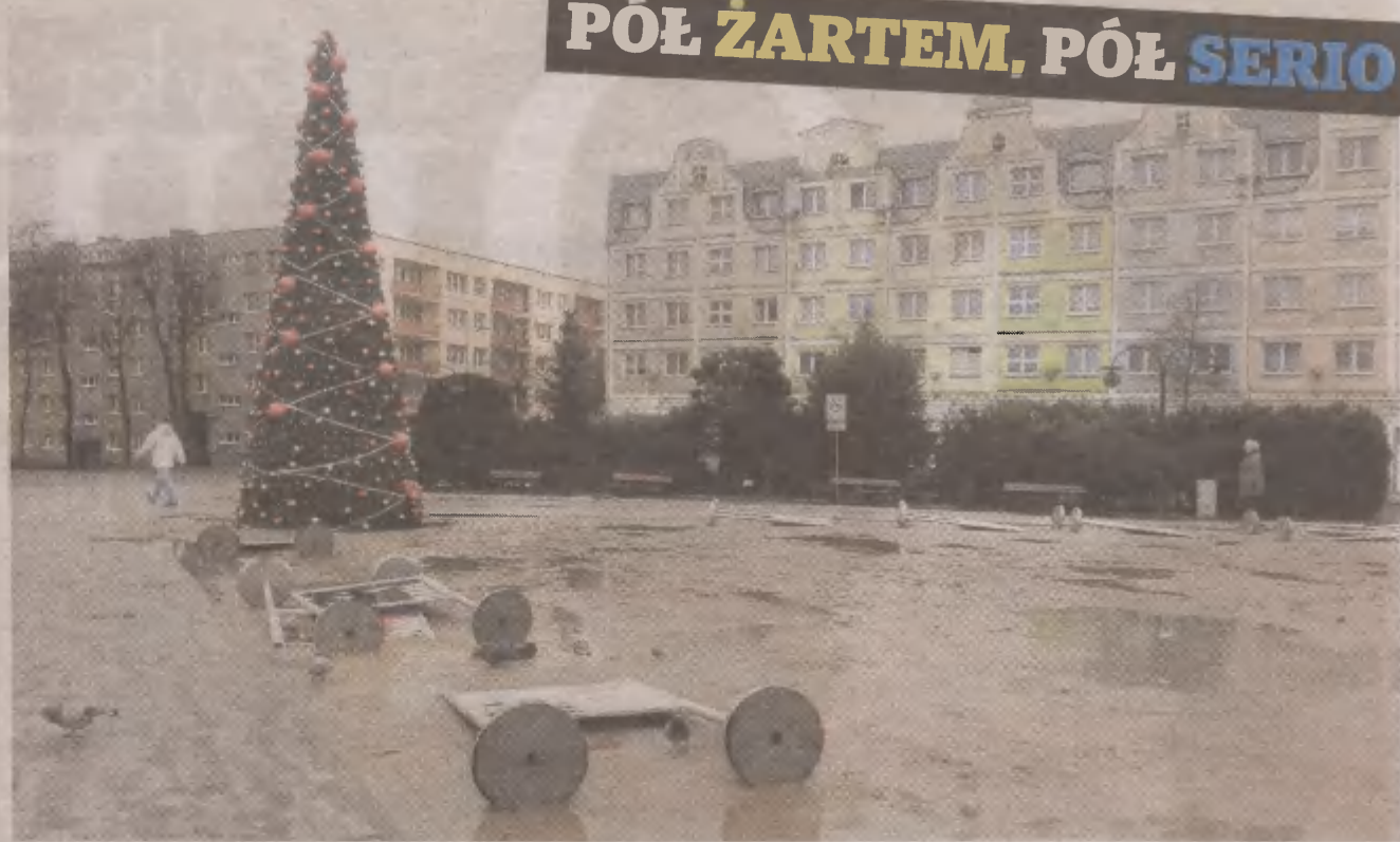
Taki oto „Super Słupsk”