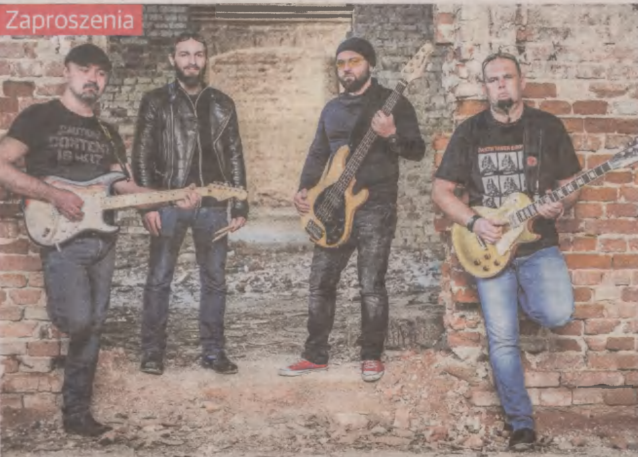
Słupscy rockmani z Grupy OUT zagrają w piątek o godz. 21 w klubie Duo Cafe. Wejściówki kosztują 20 i 15 złotych