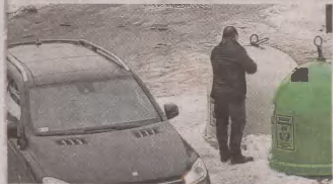
Zdaniem czytelnika, wiele osób podrzuca śmieci