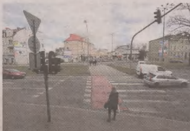
Piesi chcą wydłużenia zielonego światła na przejściu

- Młody człowiek czy osoba w średnim wieku przebiegną odcinek chodnika między jed-