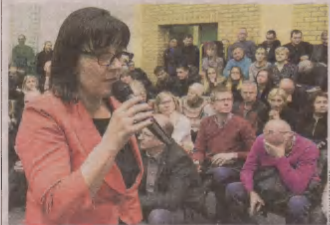
Wójt gminy Słupsk podczas spotkania z przeciwnikami mączkami zapewniła, że sprawę zweryfikuje.

Sprawę administracyjną prowadzi Prokuratura Rejonowa w Słupsku. Jednak jest ona na razie w fazie początkowej. - To pozakame postępowanie wyjaśniające. Zwróciliśmy się do gminy oraz do starostwa o informacje w sprawie. Na razie nic do nas nie wpłynęło - mówi prokurator Aneta Jankowska.