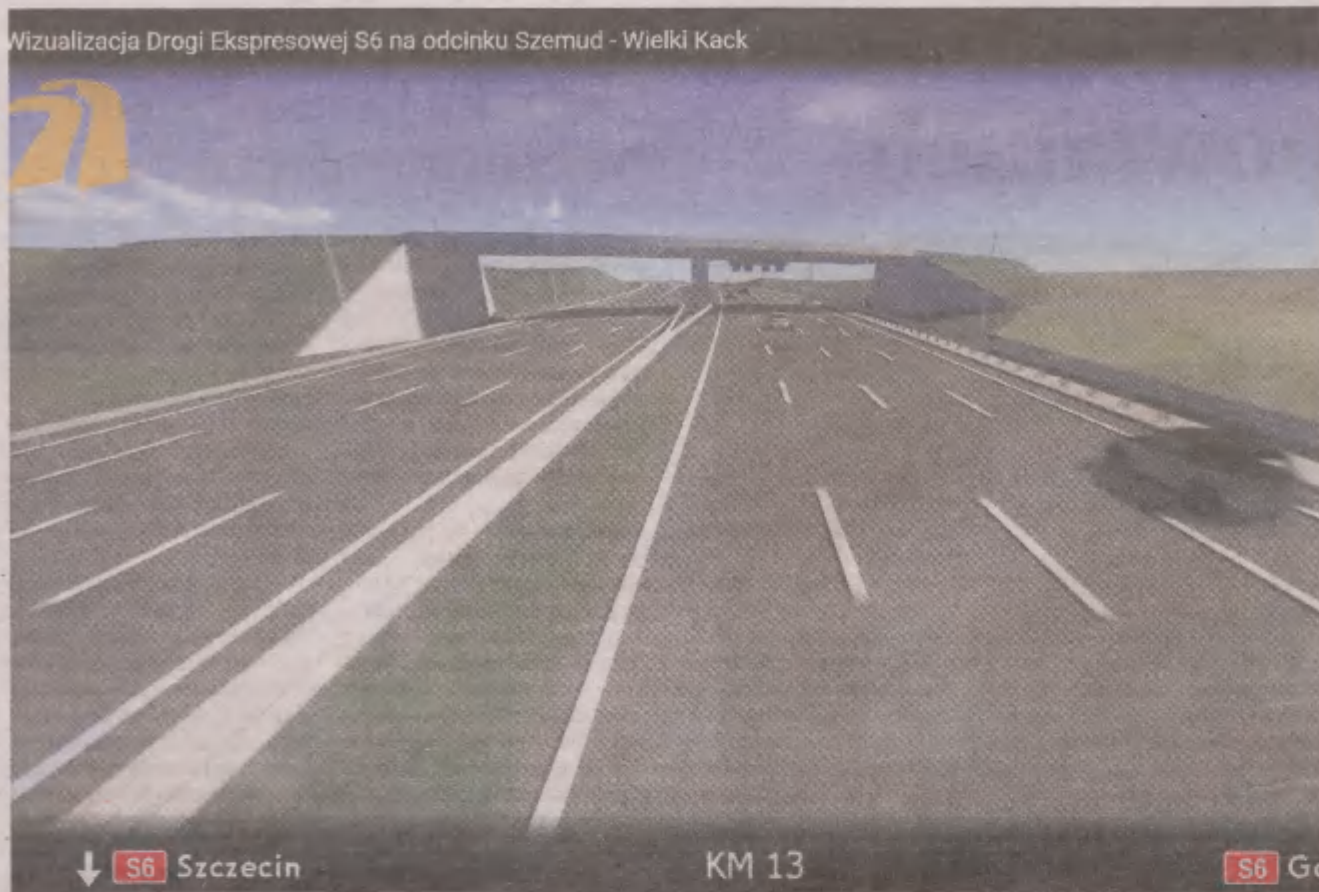
Trasa Kaszubska od Chwaszczyna do węzła obwodnicy Trójmiasta ma mieć trzy pasy ruchu