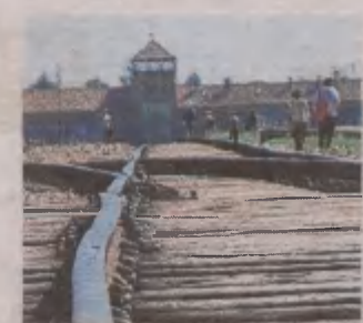
27 stycznia przypada 73. rocznica wyzwolenia obozu zagłady Auschwitz-Birkenau

Po pierwsze, z ignorancji, a po drugie - pamiętajmy, że zbrodnicze systemy mogą być atrakcyjne. Pokazują swoją siłę, dając wspaniałe hasła. Słuchaliśmy, jak gloryfikowano wodza, jakim był przenikliwym wodzem, wspaniałym strategiem, lubił dzieci i lubił zwierzątka. Przepraszam, ale i Bierut brał dzieci na kolana, i Stalin brał dzieci na kolana, i Hitler brał dzieci na kolana, więc to absolutnie mnie