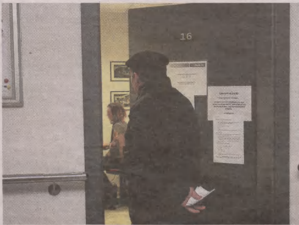
W Słupsku jeden z punktów porad prawnych działa w SCOPIES przy ul. Niedziałkowskiego

W naszym regionie powiat słupski i miasto Słupsk utworzyły po cztery takie punkty. Na terenie powiatu zlokalizowane są w Główczycach (ul.