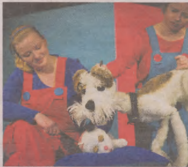
Przygody Daszeńki poznamy w sobotę w teatrze Tęcza

Teatr Władca Lalek w niedzielę o godz. 12 w DS 3 Akademii Pomorskiej przy ul. Arciszewskiego 22 wystawi „Bajki z Malowanej Skrzyni”. To pełne humoru i melodyjnych piosenek przedstawienie dla młodszych dzieci. Na kolorowym kaskaderskim podwórku spotykamy niesfornego kurczaka Szalapatka, jego mamę Kwokę, przyjaciółkę Myszkę i podstępnygo Lisa. Wykorzystując nieobecność Kwoki, Lis porwuje Szalapatka. Wejściówki kosztują 15 i 10 zł. ©