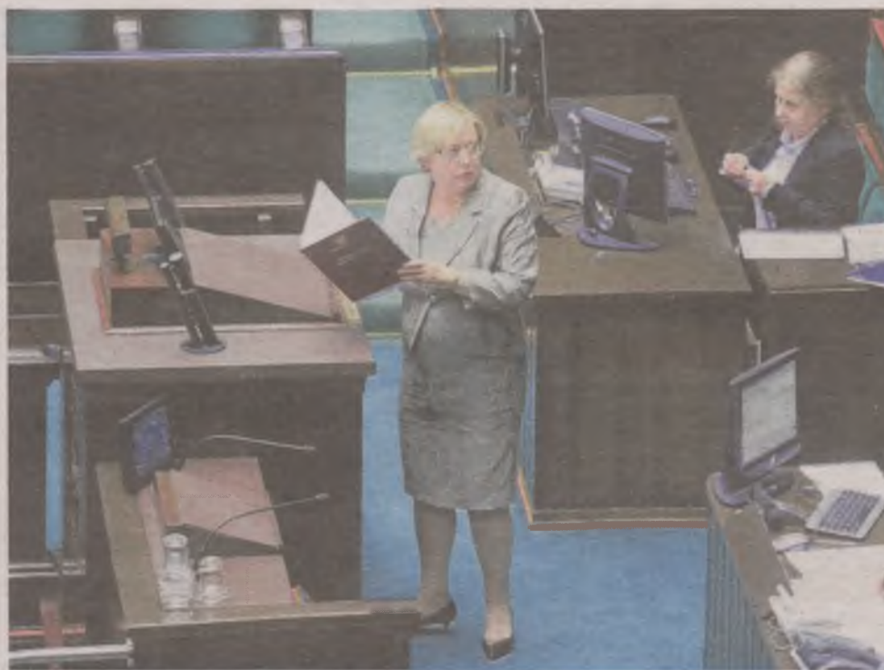
► Podczas dyskusji w Sejmie prof. Gersdorf mówiła do polityków PiS: Jest jeszcze czas na opamiętanie się