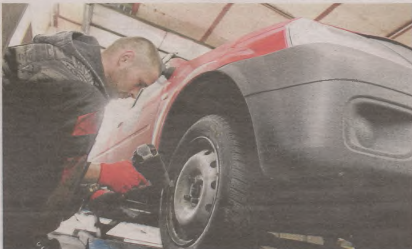
► Zdaniem ekspertów opony należy zmienić na zimowe, kiedy temperatura powietrza w ciągu dnia spada poniżej 7 stopni Celsjusza

- W przypadku ubezpieczenia AC, podobnie jak przy wszystkich innych ubezpieczeniach dobrowolnych, zakres ochrony i podstawy do wypłaty odszkodowania są dokładnie opisane w Ogólnych Warun-