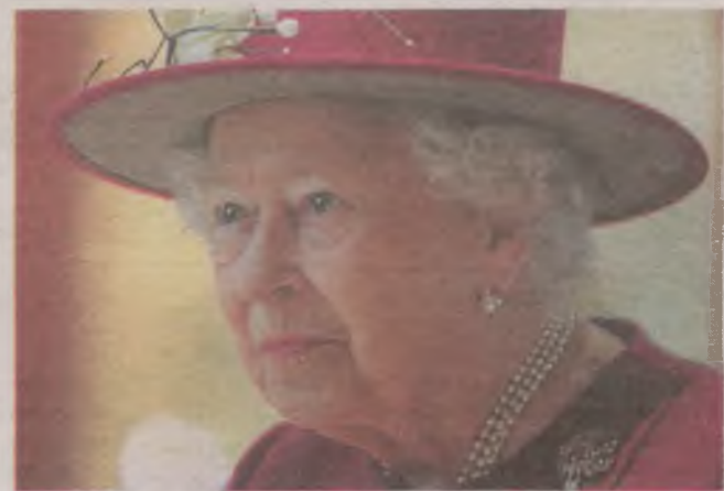
► Fortunę w rajach podatkowych umieszczała m.in. Elżbieta II

Mającą swoją siedzibę w Wielkiej Brytanii organizacja charytatywna Oxfam opublikowała niedawno własną listę 35 krajów, które powinny trafić do rejestru rajów podatkowych. Pokrywa się ona w dużej mierze z obrazem przedstawionym właśnie przez urzędników Unii Europejskiej. ●