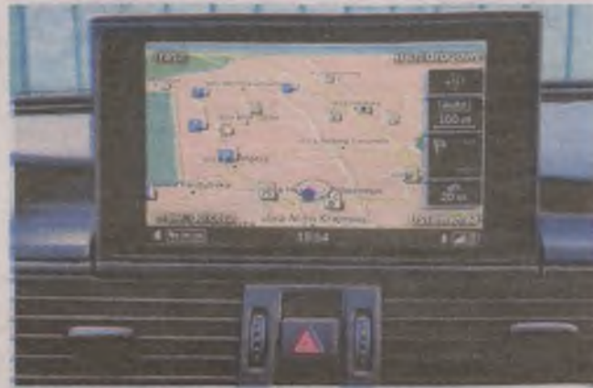
► Według zamierzeń, obowiązkowy tempomat w aucie ma współpracować z nawigacją satelitarną GPS

widzenia lokalnych władz oraz potencjalnych zysków i oszczędności. Elektroniczny kaganiec oraz inwigilacja na każdym kroku sprawi, że żaden kierowca nie uniknie kary za przekroczenie prędkości. To z kolei sprawia, że istnienie fotoradarów będzie w przyszłości zbędne. Co więcej, zniknie konieczność finansowania patroli w nieoznakowanych radiowozach, gdyż kontrola prędkości będzie po prostu zbędna. Oczywiście całe planowane przedsięwzięcie jest argumentowane chęcią poprawy bezpieczeństwa na drogach. ●