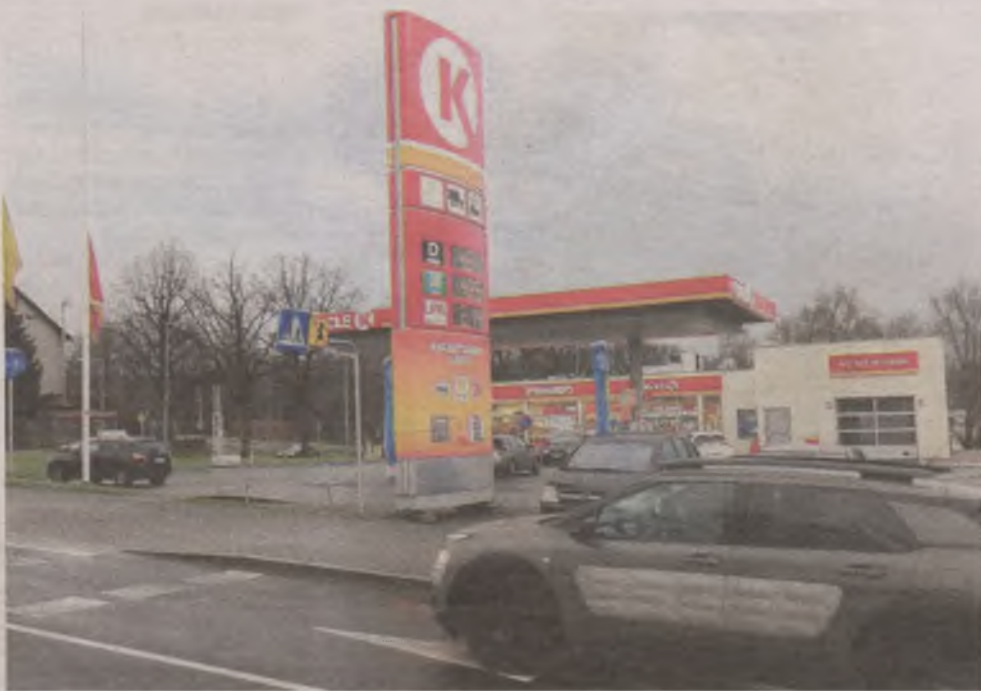
► Stacja paliw Circle K na skrzyżowaniu ulic Gdańskiej i Kozielskiego w Słupsku. Nowy szyld widnieje na niej od 30 listopada

Nowa adaptacja tych obiektów związana jest ze zmianami właścicielskimi. W 2012 r. kanadyjska Grupa Alimentation Couche-Tard, działająca pod marką Circle K, kupiła norweski Statoil Fuel & Retail. Grupa otrzymała prawo używania nazwy Statoil tylko przez określony czas. W Europie marka Circle K widnieje już na stacjach paliw w Norwegii, Szwecji i w Danii. Prace związane ze zmianą nazwy stacji paliw prowadzone są na Litwie, Łotwie i w Estonii. Jak informuje marka Circle K, zmiana logotypu na stacjach w Polsce nie będzie miała wpływu na obowiązują-