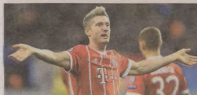
► Robert Lewandowski zdobył już 50 bramek w rozgrywkach UEFA

W drużynie z Bawarii główną postacią był jednak nie „Lewy”, a 23-letni Corentin Tolisso, który zdobył dwie bramki. Do awansu z pierwszego miejsca to jednak nie wystarczyło. W 50. minucie kontaktową bramkę, która pogrzebała nadzieje Niemców, zdobył Kylian Mbappé. Francuz już w wieku 18 lat, 11 miesięcy i 15 dni strzelił dziesiątego gola w LM. To absolutny rekord, wcześniej Karim Benzema potrzebował