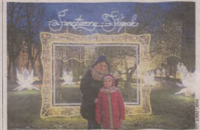
► Świąteczne iluminacje robią wrażenie. Można je będzie podziwiać do 2 lutego przyszłego roku

Tylko w tym roku Urząd Miejski w Słupsku wyda na iluminacje 225 tysięcy złotych. Kwota ta do 2020 roku urosnie do ponad 670 tys. zł. Do tej sumy trzeba też doliczyć niespełna 44 tys. zł za choinkę ustawioną na placu Zwycięstwa. ●