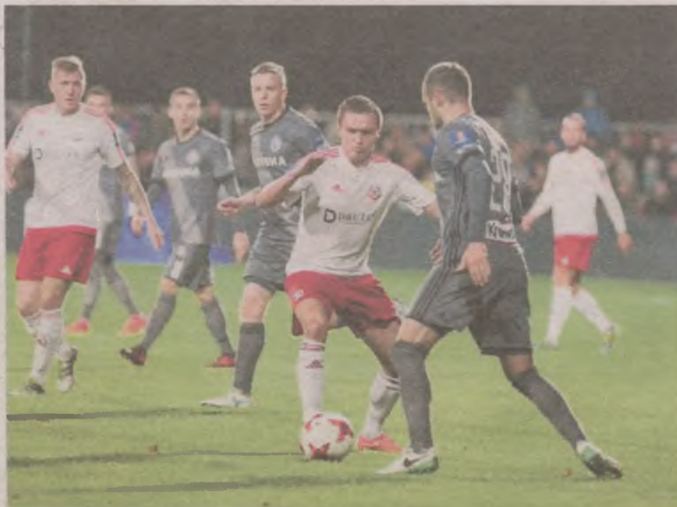
► Dla Bytovii najważniejsze były jesienią występy w Pucharze Polski. Wiosną skupi się na lidze

Zapewne przed rundą wiosenną zmieni się nieco skład zespo-