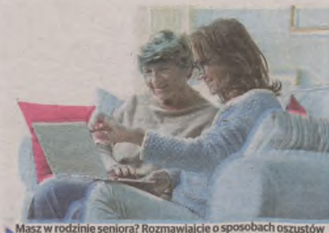
Masz w rodzinie seniora? Rozmawiajcie o sposobach oszustów

● Rzeczywista wielkość wskaźnika waloryzacji znana będzie w lutym 2018 r., po podaniu przez GUS stosownych wskaźników makroekonomicznych za rok 2017, poinformowało komunikatem Ministerstwo Rodziny, Pracy i Polityki Społecznej. (OPRAC. KB)