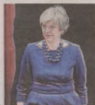
► Premier May mieli zabić terroryści samobójcy

Zdaniem brytyjskich służb udaremniono próbę zamachu na Therese May. W ubiegłym tygodniu aresztowano dwie osoby w związku z planem przeprowadzenia ataku samobójczego na Downing Street w Londynie, gdzie znajduje się siedziba brytyjskiej premier. Jak podaje Sky News, napastnikami mieli być islamiści w wieku 20 i 21 lat. AIP