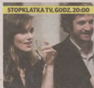
STOPKŁATKA TV, GODZ. 20:00

Sentarô sprzedaje dorayaki. Tokue zgłasza chęć do pracy. Sentarô nie chce zatrudnić wiekowej kobiety, ale zmienia zdanie, gdy okazuje się, że jej pasta z czerwonej fasoli nie ma sobie równych.