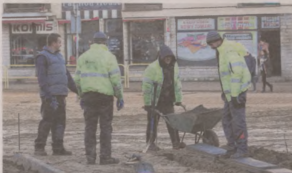
► Dwie ścieżki po przekątnej i utwardzony pas przy ul. Grodzkiej. Tak do 20 grudnia ma wyglądać tymczasowa aranżacja Starego Rynku w Słupsku

Wczoraj rozpoczęły się prace budowlane, które powinny zakończyć się jeszcze przed świętami Bożego Narodzenia. Jak nas zapewniono, zimowa pogoda nie powinna być przeszkodą i wpłynąć na trwałość wykonania. Fundamenty dawnego ratusza zasypano kilkoma metrami piasku,