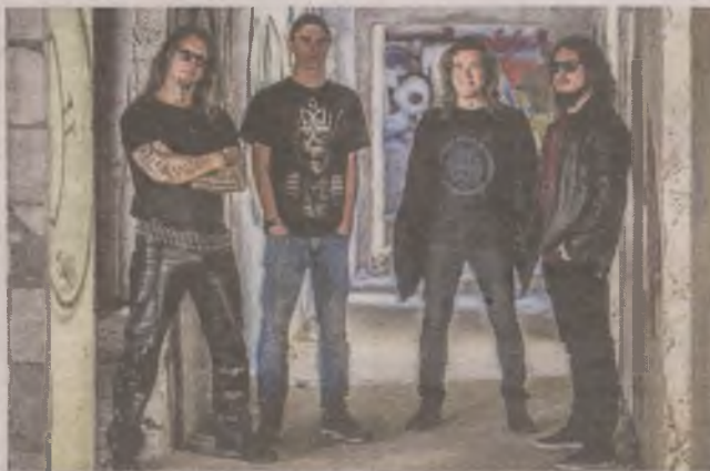
► Słupski Aggressor istnieje już 30 lat. Z tej okazji zagrają jubileuszowy koncert razem z Vader, Dead Infection i Bloodsplash

Niespodzianką dla fanów będzie promocja najnowszego wydawnictwa Aggressora noszącego tytuł „XXX”. Razem z Aggressorem na scenie wystąpi na rozgrzewkę Bloodsplash, młody zespół thrashmetalowy,