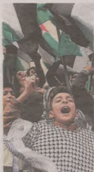
► Protesty przeciwko uznaniu Jerozolimy za stolicę Izraela

Już za prezydentury Billa Clintona mowa była o przeniesieniu ambasady USA do Jerozolimy, jednak kolejne administracje waszyngtońskie przekładały decyzję. Donald Trump chce spełnić obietnicę z kampanii prezydenckiej, że placówka dyplomatyczna USA będzie w Jerozolimie. Wschodnia część miasta jest szczególnie