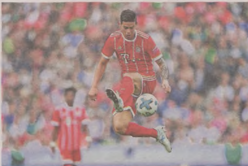
► We wtorkowym meczu Ligi Mistrzów z PSG James najpierw miał udział w akcji, po której do siatki trafił Robert Lewandowski, a później sam precyzyjnie dośrodkował na głowę Corentina Tolisso

Za swój występ nie zebrał co prawda najwyższych ocen w swoim zespole, bo np. według dziennika „Bild” lepiej wypadli Sven Ulreich, Kingsley Coman i wspomniany już Tolisso. Z postawy Jamesa może cieszyć się jednak nie tylko prezydent mistrza Niemiec Uli Hoeness, którego zdaniem Kolumbijczyk to prawdziwa „transferowa bomba”. Zadowolony może być również Lewandowski, walczący o pierwsze w karierze zwycięstwo w Lidze Mistrzów.