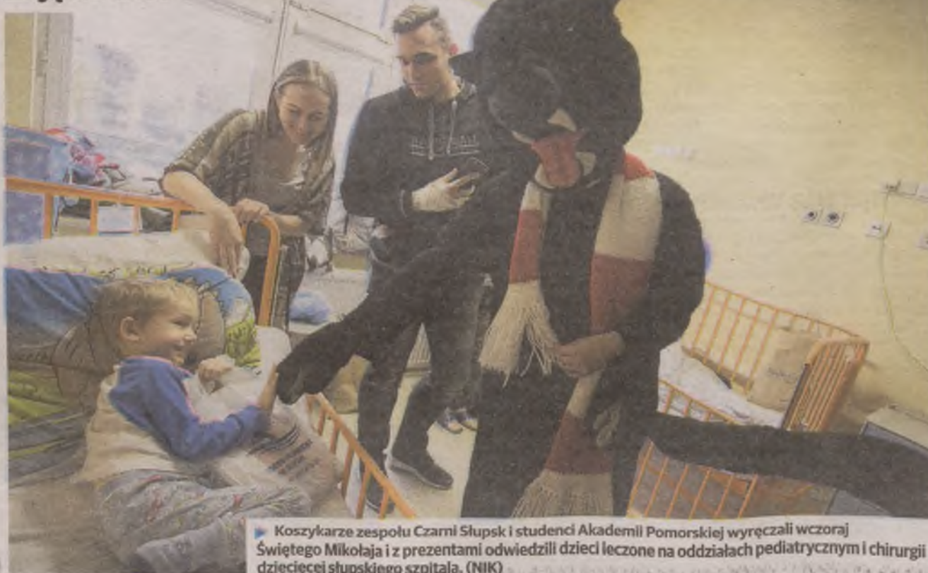
► Koszykarze zespołu Czarni Słupsk i studenci Akademii Pomorskiej wyręczyli wczoraj Świętego Mikołaja i z prezentami odwiedzili dzieci leczone na oddziałach pediatrycznym i chirurgii dziecięcej słupskiego szpitala. (NIK)