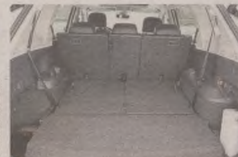
FOT. WOJCIECH FRELICHOWSKI

► Dostęp do tylnego rzędu siedzeń jest możliwy pod odsunięciem siedzenia w środkowym rzędzie