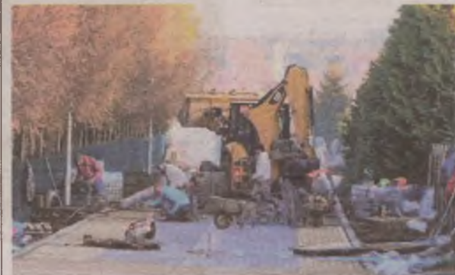
► Prace na ulicy Wiatracznej w Kobylnicy są prowadzone są bardzo intensywnie

Kanalizacja deszczowa znacznie ograniczy zalewanie drogi krajowej nr 21. Całkowita wartość zadania wynosi 1 782 082,00 zł. ● ©©