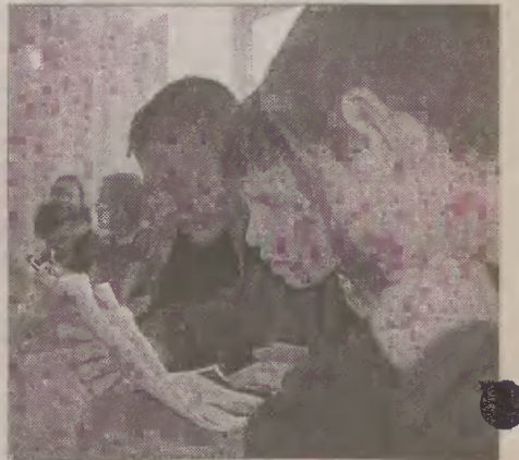
Zakończył się konkurs wiedzy o Fryderyku Chopinie. Na zdjęciu: uczniowie klasy VI a SP 4. Powtarzają wiadomości przed finałem.