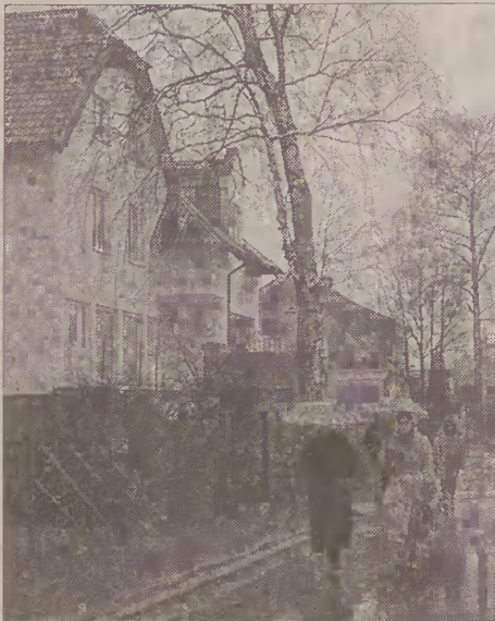
Widok na ulicę Kolejową.