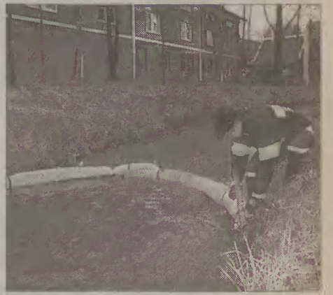
Strażacy usuwali plamę ropy, która pojawiła się na wodach Kumieli.