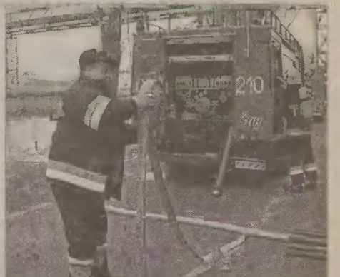
Strażacy przeprowadzili ćwiczenia pożarowe w ABB.