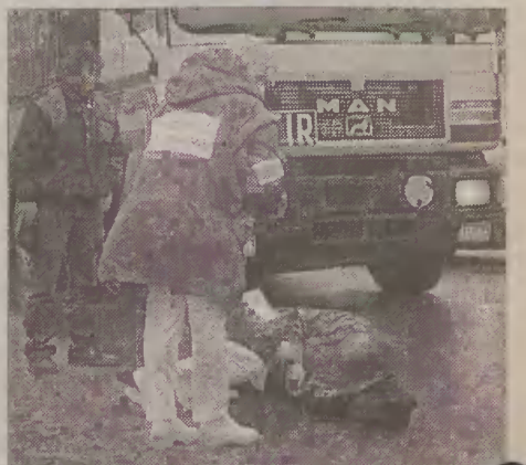
Do tragicznego wypadku doszło w przejściu dla pieszych przy ulicy Rycerskiej.