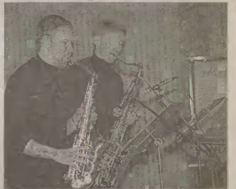
W szkole muzycznej odbył się Festiwal Muzyki Jazzowej i Rozrywkowej. Na zdjęciu zespół z Żor, zdobywcy III miejsca.