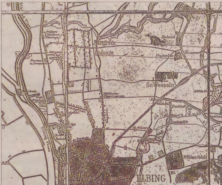
Kolonia Pangritz stała się dzielnicą miasta.

Największym jednak powodem do dumy elblązan jest faktyczne włączenie w obręb miasta Kolonii Pangritz (dała ona początek dzisiejszej Zawadzie), dobrze już rozwiniętego osiedla przedmiejskiego i szeregu mniejszych obszarów. Latem 1913 roku rozpoczynają się prace budowlane związane z urbanizacją anektowanych obszarów, choć na przykład aż do lat sześćdziesiątych nie doczekały się one gazyfikacji. Nadanie urzędowych nazw