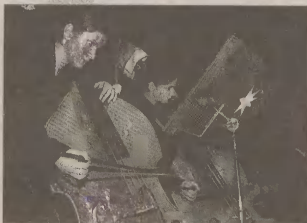
Na ogólnopolskim konkursie uczniów szkół wiolonczeli i kontrabasów Elbląg reprezentować będą uczennice prof. Olega Studnickiego.

16.00 Koncert laureatów W Zespole Państwowych Szkół Muzycznych im. Miłkołaja Wiłkomirskiego przy ul. Traugutta 91 w Elblągu odbędzie się koncert laureatów ogólnopolskiego konkursu uczniów klas wiolonczeli i kontrabasów szkół muzycznych II stopnia. Do konkursu z pięciu makroregionów zakwalifikowało się 27 najlepszych wiolonczelistów i 14 kontrabasistów z 19 miast całej Polski (J.D.)