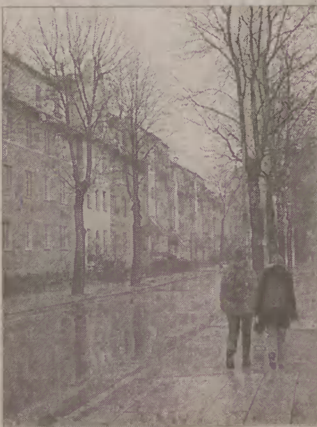
Widok na ulicę Komeńskiego.

Wioleta Engler