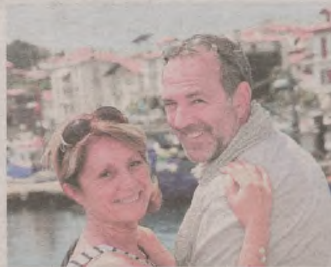
► Co piąty wyjazd świąteczny oznacza podróż na granicę

Jeżeli wędrując po górach skrocimy kostkę lub złamiemy nogę, możemy ubiegać się o świadczenie - pod warunkiem, że wcześniej zadbałszy o ochronę w po-