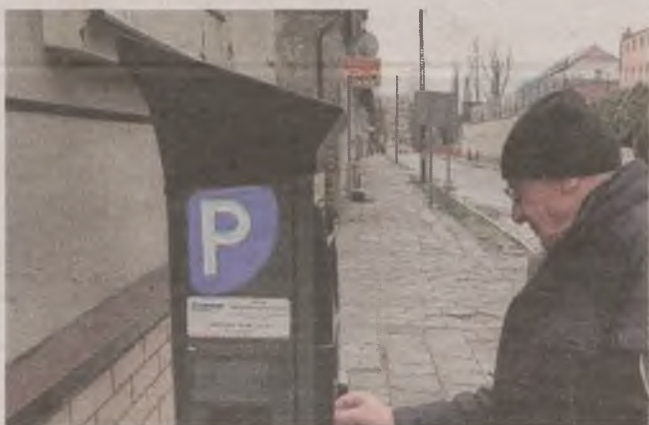
► Kierowcy parkujący swoje auta w strefie płatnej muszą pamiętać o wykupieniu biletów w parkomatach

- Czy kasa miejska jest tak pusta, że urzędnicy szukają pieniędzy wszędzie, gdzie się da? - pyta czytelnik. - A może boją się, że niektóre mandaty się przeterminują?