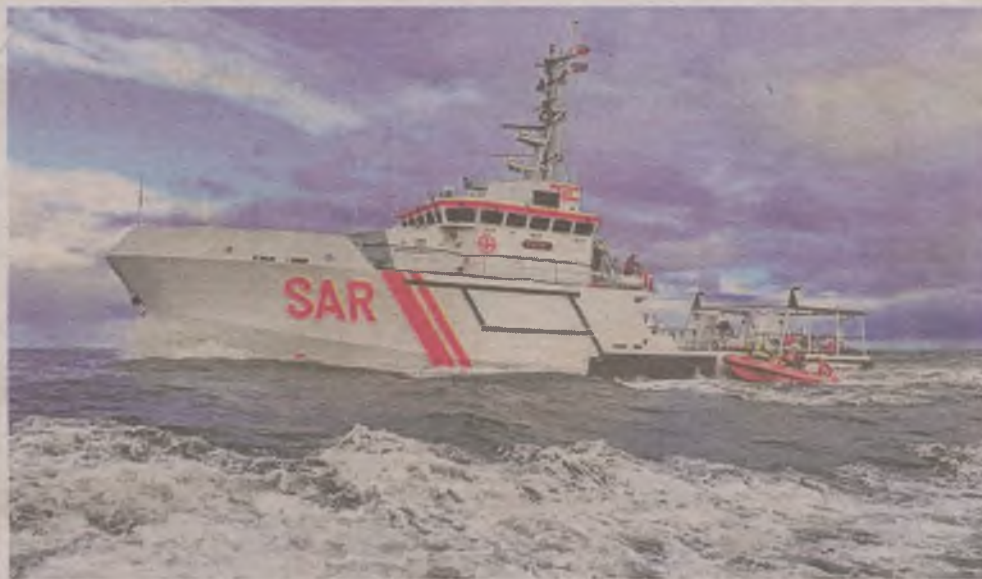
► Jednostka ratownicza Morskiej Służby Poszukiwania i Ratownictwa stacjonuje również w uscieckim porcie. Jest tam także Morska Stacja Ratownicza

System łączności, który Energa udostępni służbie SAR, został zaprojektowany tak, aby