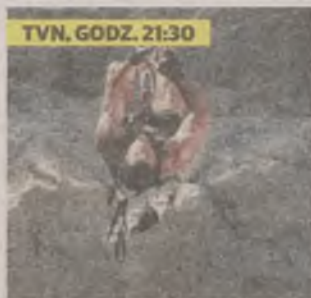
TVN, GODZ. 21:30

Derek Zoolander, trzykrotny zdobywca tytułu Modela Roku, zdeponowany przez rywala, porzuca Nowy Jork i wraca do rodzinnego miasta, gdzie zostaje górnikiem.