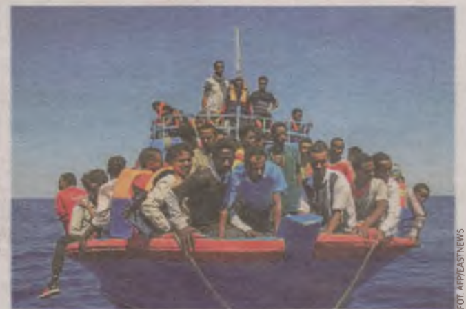
► Franciszek kolejny raz zaapelował o miłosierdzie dla uchodźców

Papież porównał migrantów do Marii i Józefa, którzy podróżowali z Nazaretu do Betlejem, by znaleźć swoje miejsce. Wielu migrantów, jak mówił papież, jest zmuszanych do ucieczki ze swoich domów, bo przywódcy doprowadzają do przelewu krwi. Nie pierwszy raz Franciszek staje w obronie migrantów. Liczba uchodźców osiągnęła dzisiaj 22 mln. Najnowszym dramatem są przesładowania członków Rohindża, których junta wojskowa zmusiła do ucieczki z Mjanmy (dawniej Birma). ●