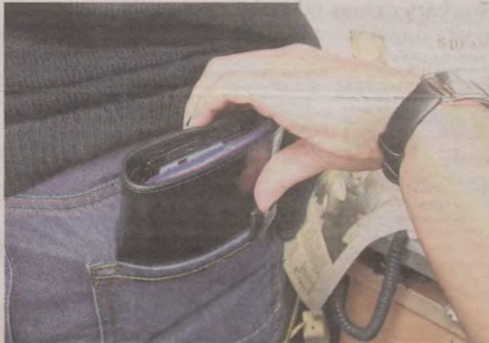
► Nasz portfel to skarbnica cennych informacji. Jego kradzież nie wiąże się tylko z utratą pieniędzy, ale również z narażeniem się na poważne konsekwencje związane z przejściem danych osobowych

Kradzieże dokonują w taki sposób, że osoba poszkodowana często nawet nie zdaje sobie z tego sprawy. Często ofiara śledzona jest przez dłuższy czas, a złodziej wybiera najmniej