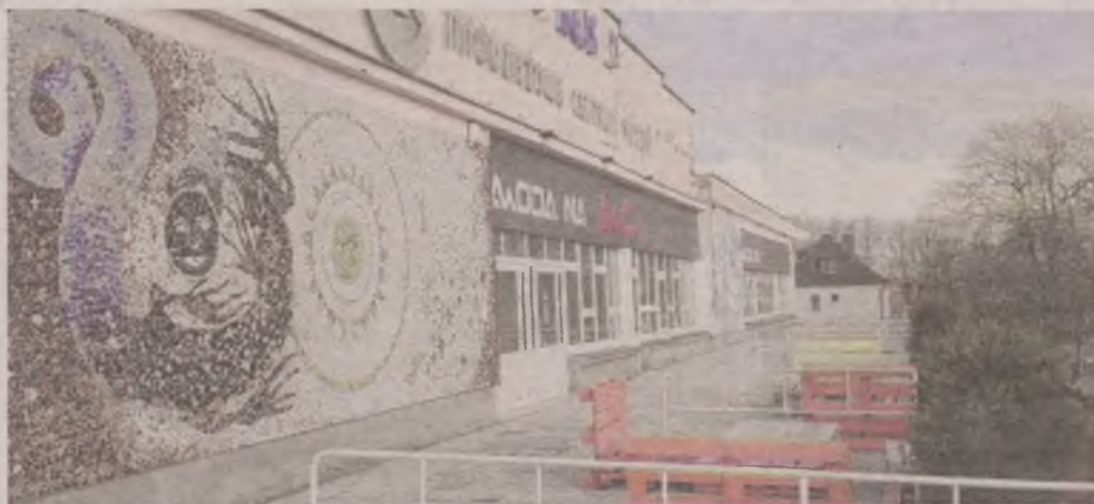
► Podczas jutrzejszej sesji będzie m.in. omawiana kwestia połączenia Młodzieżowego Ośrodka Kultury (na zdjęciu) ze Słupskim Ośrodkiem Kultury

Uchwała budżetowa to temat numer jeden czwartkowej sesji rady miasta. Po ostatnich autopoprawkach prognozowane dochody wzrosły z 519 mln zł do 537 mln. W konsekwencji w górę poszły też wydatki bieżące i majątkowe i to o ok. 23 mln zł. Wyższe zaplanowano też przychody (sześć milionów), przede wszystkim za sprawą emisji obligacji oraz pożyczek i kredytów. Słupsk w przyszłym roku nie uniknie konieczności dalszego zadłużania. Tym razem na 36 347 497 zł. Prognozowany deficyt sięgnąć ma lekko ponad 17 mln zł.