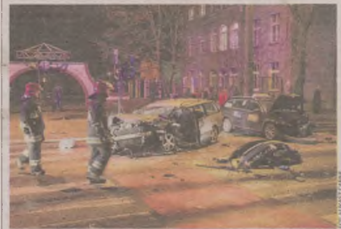
► Na ul. Zamkowej w Słupsku zderzyły się trzy samochody. Pięć osób trafiło do szpitala. Na szczęście bez poważnych obrażeń.