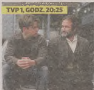
TVP 1, GODZ. 20:25

Will, woźny na bostońskiej uczelni, ma niespotykane