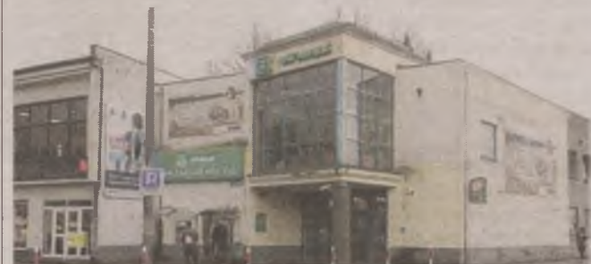
► Zarząd Infrastruktury Miejskiej zamontował słupki, które mają uniemożliwić parkowanie na chodniku przy banku

- Mieliśmy sygnały o takich praktykach. Występowaliśmy do słupskiego oddziału Banku Zachodniego WBK o zaprzestanie obsługi placówki w taki sposób, a dodatkowo ustawiliśmy słupki blokujące uniemożliwiające bezpośredni dojazd przez chodnik - zapewnia Jarosław Borecki. - Po otrzymaniu od czytelników sygnałów o dalszym występowaniu tej praktyki, to tym razem wystąpimy do jego wrocławskiej centrali. ● ©©