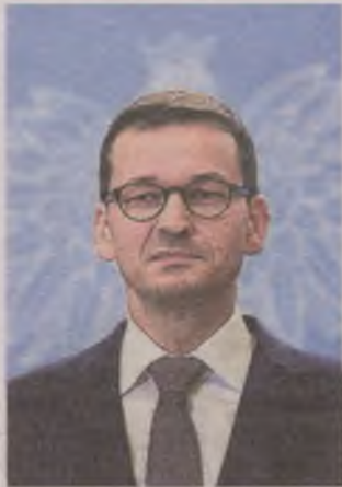
► Politycy PiS przekonują, że Polska nie wyjdzie z UE

Ta procedura kończy się ostrzeżeniem o charakterze politycznym, ale są dalsze konsekwencje. Rada UE może np. polecić zmianę ustawy w kierunku zapewnienia praworządności. Jeśli kraj członkowski się nie zastosuje do założeń, wtedy może wejść w grę procedura sankcji. Na ich wprowadzenie, tym razem przez Radę Europejską, muszą się jednak zgodzić wszystkie państwa członkowskie. Oczywiście kraj, którego dotyczy wniosek, nie bierze udziału w takim głosowaniu. Jakie sankcje nam grożą? Traktat nie jest tu precyzyjny. Ale oznacza to zawieszenie państwa w niektórych prawach członka UE, np. zawie-