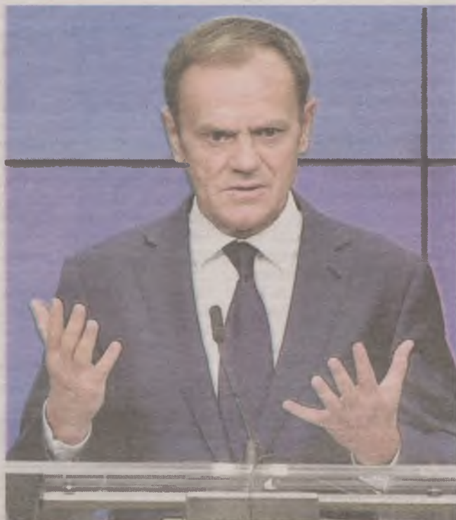
► Historia może się powtórzyć i niebawem, jak przed laty, do kolejnego pojedynku staną Donald Tusk i Jarosław Kaczyński

Oczywista oczywistość. Przez przeciwników ironicznie, a przez zwolenników całkiem serio zwany naczelnikiem państwa - choć przyjęty przez niego model rządzenia przypomina bardziej ten wybrany przez Piłsudskiego po 1926 r. niż ten z lat 1918-1920. Z tylnego fotela dyryguje klubem parlamentarnym PiS i rządem. Osiągnął polityczną hegemonię na prawicy, ale jego postać angażuje też umysły opozycji - na tyle mocno, że część jej polityków wymienia częściej nazwisko Kaczyńskiego niż własnych przywódców. Rekonstruując rząd, nie zdecydował się na to, by stanąć na jego czele - oprócz