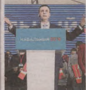
► Aleksiej Nawalny nie wystartuje w wyborach 2018

Rosyjska centralna komisja wyborcza nie wyraziła jednak zgody na zarejestrowanie komitetu wyborczego Aleksieja Nawalnego, który chciał startować w marcowych wyborach prezydenckich. Tym samym główny rywal Władimira Putina, czołowy opozycjonista, pozbawiony został szansy na uczestnictwo w wyborach. AIP