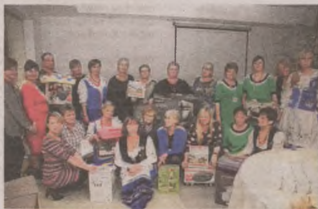
► Grupa Rybacka zorganizowała konkurs „Danie z ryb”. Pierwsze miejsce zajęło stowarzyszenie „Sploty”

Na rynku miejskim odbył się jarmark bożonarodzeniowy zorganizowany przez Urząd Miejski w Bytowie, który także w tym roku cieszył się dużym zainteresowaniem. Plac Kardynała Wyszyńskiego był pełen ludzi. Odwiedzający z ciekawością oglądali poszczególne stoiska, gdzie każdy mógł znaleźć coś dla siebie. Wystawcy oferowali odwiedzającym własnoręcznie robione ozdoby, m.in. stroiki, bombki, dekoracje świąteczne, uszytki oraz wyroby z drewna. Każdy mógł również nabyć choinkę. W tym roku pojawiła się także fotobudka w świątecznym klimacie. Święty Mikołaj witał wszystkie przybyłe dzieci, dla których przewidziano wiele animacji, zabaw oraz konkursów. Podczas jarmarku dla najmłodszych czynne były stano-