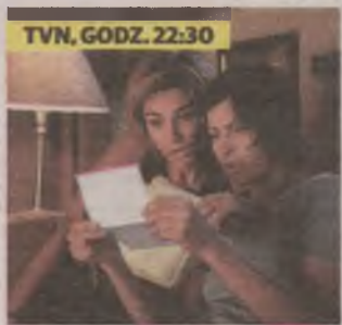
TVN, GODZ. 22:30