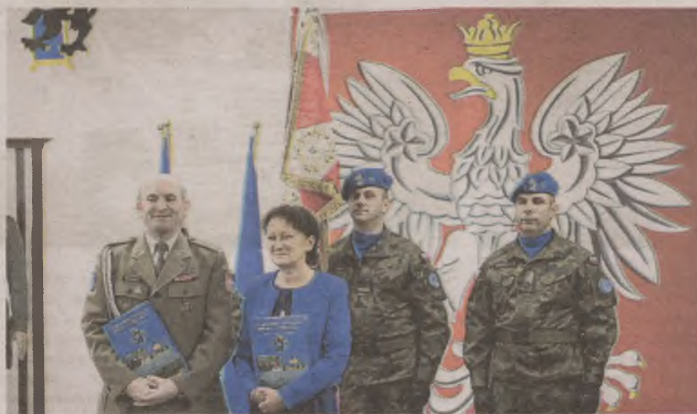
► Uczniowie liceum im. Sierpińskiego i dwóch innych szkół z regionu będą uczyć się m.in. musztry i sztuk walki od żołnierzy 7. Brygady Obrony Wybrzeża. Wczoraj podpisano stosowne porozumienia

Żołnierze OT mają szkolić się w weekendy i raz w roku ćwiczyć na poligonie i brać udział w manewrach. W sumie przez 30 dni w ciągu roku. Każdemu będzie przysługiwać comie-