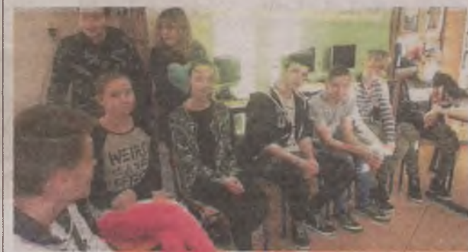
► W bibliotece w Wicku uczniowie mogli się zaznajomić ze zbiorami Biblioteki Narodowej

Scenariusz lekcji o „Żonie modnej” autorstwa Magdaleny Kubiak został nagrodzony przez Bibliotekę Narodową w konkursie z 2015 roku na ogólnopolski scenariusz lekcji wykorzystujący zasoby POLONY. ● ©