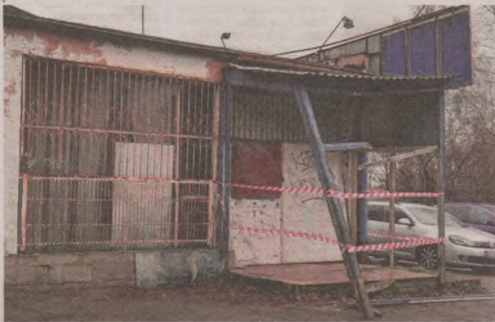
► Jak dowiedzieliśmy się w straży miejskiej, to funkcjonariusze zabezpieczyli wejście do pustostanu i wezwali właścicieli tego obiektu do zadbania o jego odpowiedni stan

Inny mieszkaniec poinformował nas, że obiekt, oprócz