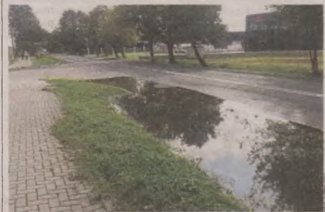
► Tak wyglądało skrzyżowanie ulic Witosa i Stefczyka w Kobylnicy nawet po niewielkich opadach deszczu

Na przełom lat 2018 i 2019 planowana jest kolejna inwestycja na ul. Witosa. Tym razem będzie tam nieco zmieniony układ komunikacyjny. ● ©©