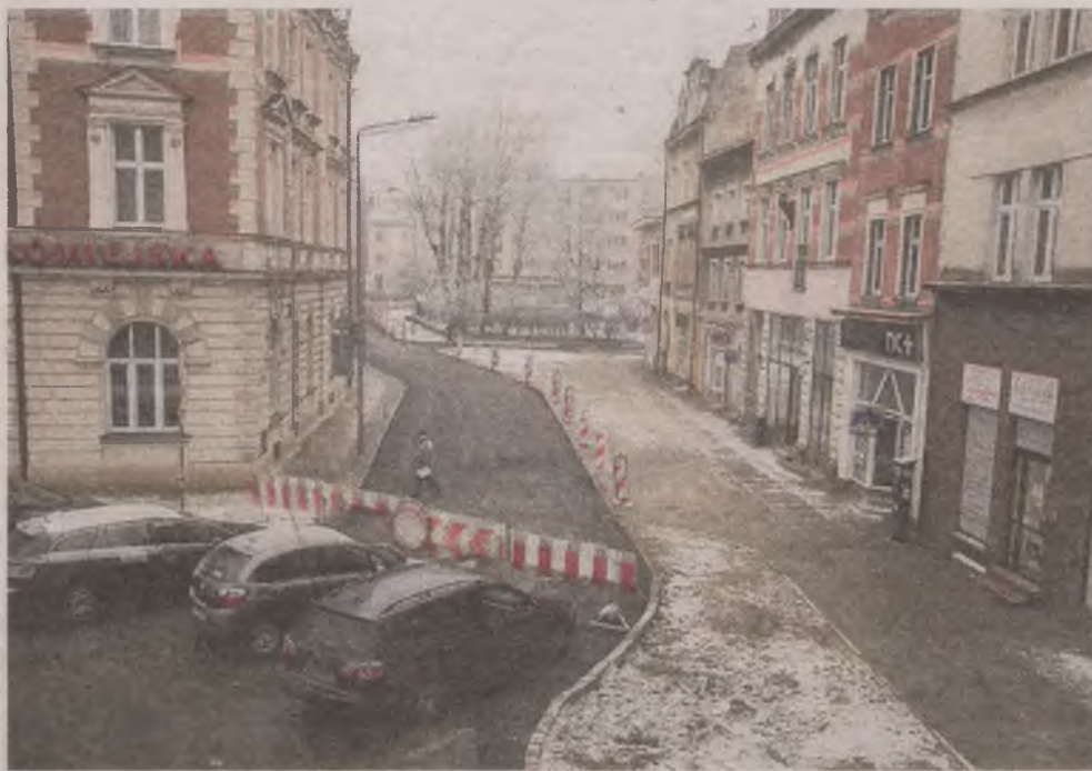
► Poza wyglądem ulicy najważniejszą zmianą jest to, że teraz będzie jednokierunkowa oraz z szerokim chodnikiem