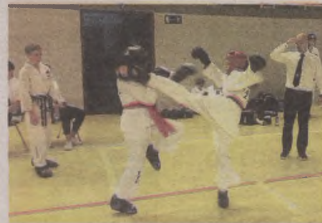
► Poszczególne walki były bardzo zacięte, a zawodnicy nie szczydziли woich sił

tniu powalczyć na mistrzostwach Polski, które są jednocześnie turniejem rankingowym do kadry narodowej Polski. ● ©©