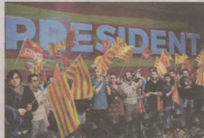
► Pewne jest, że nowy parlament Katalonii będzie podzielony

Sondaże tymczasem wskazują, że zwolennicy niepodległości Katalonii oraz ugrupowa-