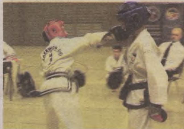
► W Grodkowie reprezentanci Słupska i Ustki walczyli z dużymi sukcesami