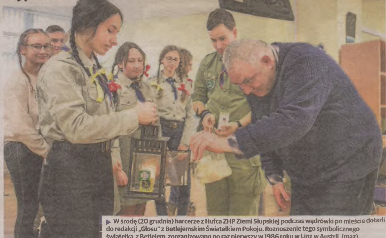
► W środę (20 grudnia) harcerze z Hufca ZHP Ziemi Słupskiej podczas wędrowki po mieście dotarli do redakcji „Głosu” z Betlejemskim Świątecznym Pokojem. Roznoszenie tego symbolicznego świąteczka z Betlejem zorganizowano po raz pierwszy w 1986 roku w Linz w Austrii. (maz)