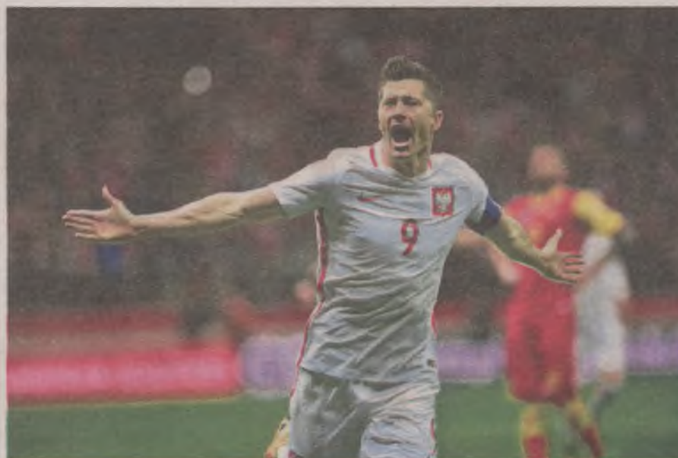
► Zbigniew Boniek odbudował nadszarpnięty wizerunek naszej piłki, w czym bardzo pomogły mu bramki Roberta Lewandowskiego strzelane dla reprezentacji Polski

Liczą się również osiągnięte cele i forma, o czym przekonała się np. Agnieszka Radwańska. Najlepsza polska tenisistka nie zaliczyła mijającego roku do udanych pod względem sportowym. W efekcie spadła w rankingu z 4. (w 2016 r.) na 9. pozycję. Choć to i tak niewiele w porównaniu z rankingiem WTA, bo