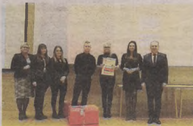
► Uczniowie mechanika z myślą m.in. o swoich chorych absolwentach organizowali akcję rejestracji dawców szpiku

Kilka dni temu w Parku Naukowo-Technologicznym w Gdyni odbyła się gala podsumowująca projekt „Pomorska # Komórkomania”, w trakcie której słupski Zespół Szkół Mechanicz-