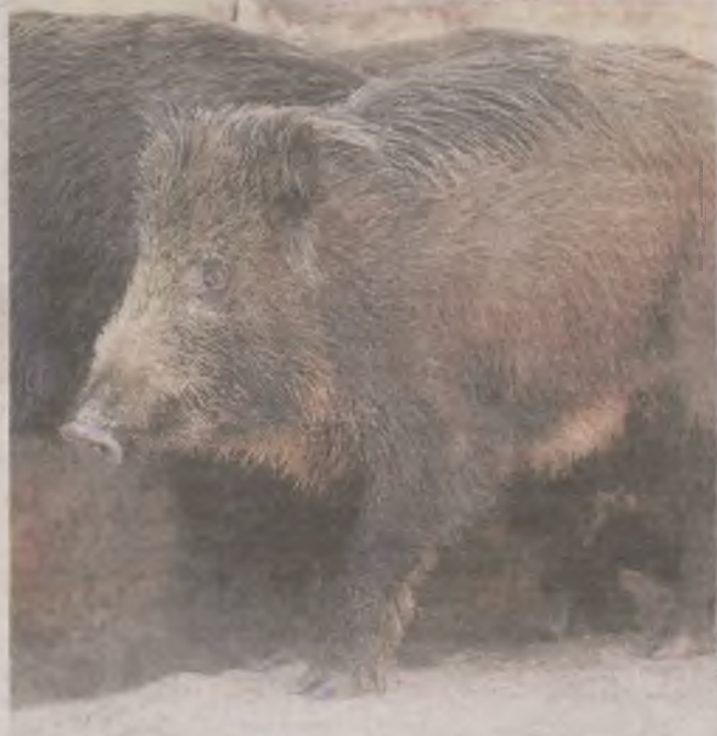
► Dzikie coraz częściej zaglądają do miasta. Teraz w kilku miejscach będzie pojawiały się odłownia tych zwierząt.