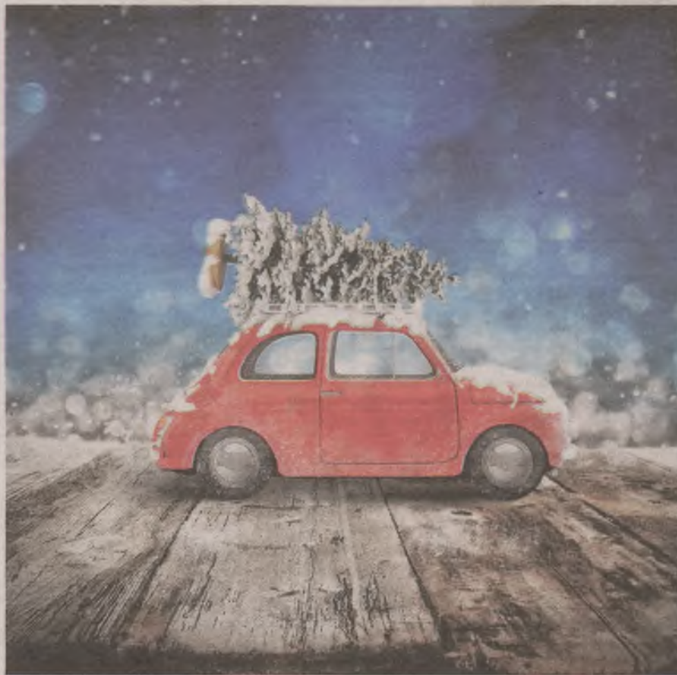
► W punktach sprzedaży choinek już od kilku dni trwa duży ruch. Z każdym dniem klientów przybywa

Znacznie tańszy jest świerk kłujący. Wybierany jest często z racji ceny i intensywnego zapachu. Małe drzewka mogą kosztować nawet 20 zł. Duże nie przekraczają 100 zł. Kłopotliwe są jednak kłujące igły, a gdy uschną, sprzątanie nie należy do przyjemności. Nieco droższa jest srebrzysta odmiana świerku. Nalot na jasnych igłach zabezpiecza je przed wysychaniem, więc mogą prze-trwać dłużej. Świerk pospolity bywa jeszcze tańszy od kłującego. Nawet kłuje mniej, bo igły na gałązkach leżą, nie