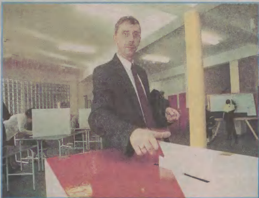
Frekwencja w niedzielnych wyborach prezydenckich była bardzo wysoka.