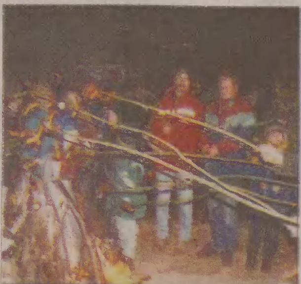
Przy ognisku pieczono kiełbaski.