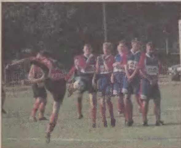
Rzut wolny w wykonaniu piłkarzy Orłąt Reda - na szczęście dla Pogoni niecelny.