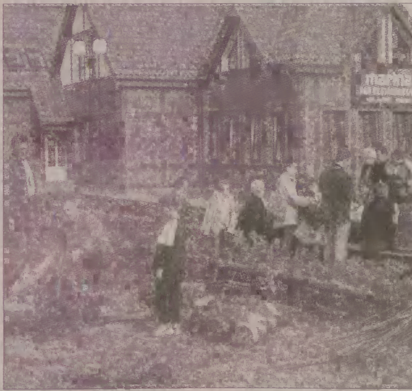
Mieszkańcy Helu byli zachwyceni łębską gościnnością i wizerunkiem portu jachtowego.

Organizatorzy podkreślają, że na trasie nie chodziło o szybkość przejazdu, ale o bezpieczeństwo i spokojne zwiedzanie okolic. Po drodze uczestnicy przygotowywali się do konkursu z zakresu wiedzy o Łebie i okolicach. Każdy otrzymał zalakowaną kopertę z ponad 50 pytaniami.