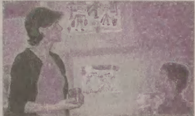
Wystawę można oglądać w sali domu kultury.

Wystawa pokonkursowa Młodzieżowy Dom Kultury w Łęborku zaprasza dzieci i młodzież ze szkół podstawowych i gimnazjalnych na wystawę prac nadesłanych na międzyszkolny konkurs „Sprzątanie świata”. Właściwie dwóch konkursów pod tym samym tytułem: plastycznego i fotograficznego. Na ten pierwszy wpłynęło 370 prac, ale na wystawie oglądać można tylko 38 nagrodzonych i wyróżnionych. Obok - na wystawie fotograficznej - znalazło się 5 zestawów zdjęć z 16 nadesłanych. Wystawę można oglądać codziennie w godzinach otwarcia domu kultury po uprzednim uzgodnieniu terminu z dyrekcją placówki pod nr. tel. 8621-645.