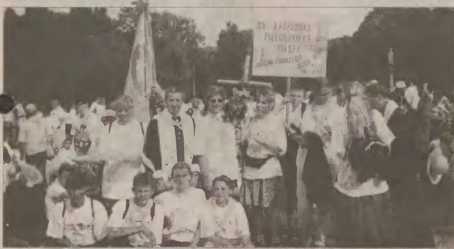
Wszyscy tegoroczni pielgrzymi odziani są w stylowe koszulki i chusty opatrzone kaszubskim gryfem i napisem „Më trzimómë z Bogiem”