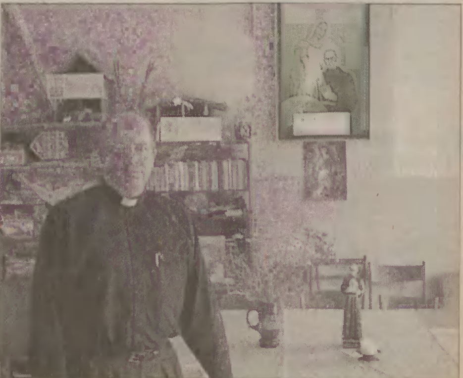
Poeza, człowiek otwarty. W głębi widoczny obraz ze Św. Maksymilianem.