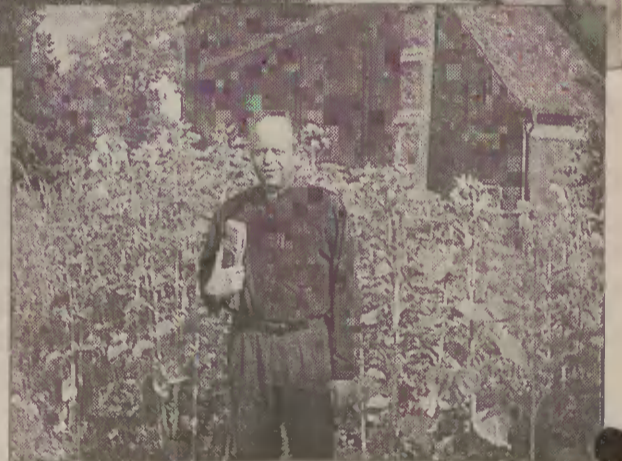
Jubileusz w środku słoneczników w przyklasztornym ogrodzie. Widoczny kościół św. Jakuba Apostoła.

- Zawsze tak było. Teraz jednak w zalewie zła nie widać dobra. Mówi się dużo w mediach o złu. Nie ma zapotrzebowania na dobre informacje. Takie są oczekiwania ludzi. I to jest za-