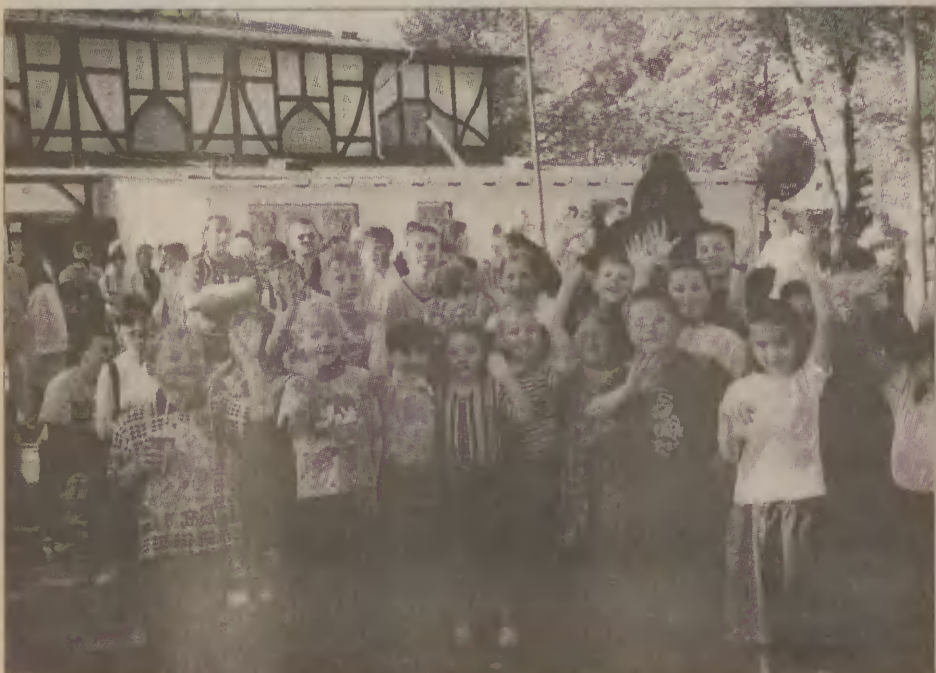
Na festyn przybył nawet Lord Vader z „Gwiezdných wojen”.

Stowarzyszenie planuje 17 czerwca (w sobotę) zorganizować następną imprezę w Mostach. Przy miejscowej parafii Brata Alberta ma się odbyć odpust połączony ze zbiórką rzeczy dla rodzin wielodzietnych. Brat Albert dbał przecież o biedne i ubogie rodziny.