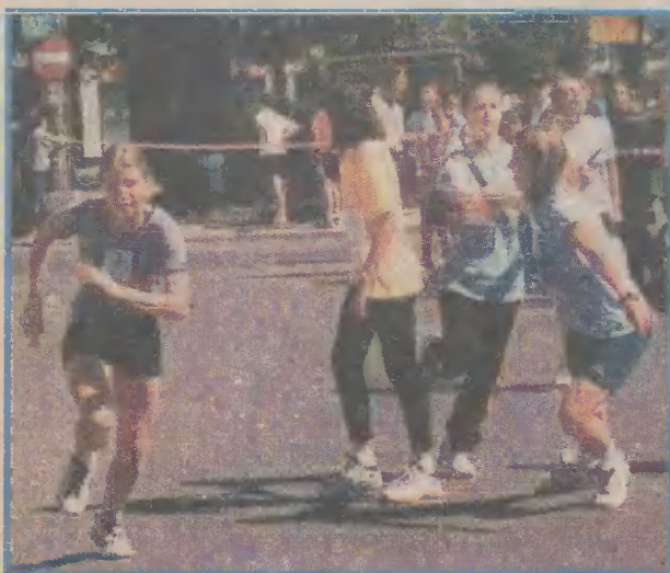
Sztafetowe zmagania były bardzo zacięte.

Sztafetowe biegi uliczne szkół podstawowych odbyły się w Lęborku. Zwyciężyły lęborskie szkoły, wśród dziewcząt SP 5, a w gronie chłopców SP 8.