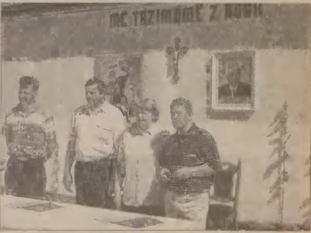
Uroczystościom w Borzestowie przyświecał napis „Më trzimómë z Bògã”.