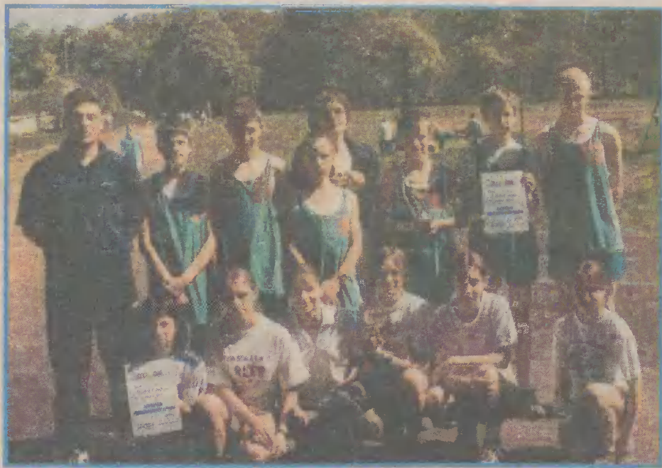
Sportowcy, podczas finału Igrzysk Młodzieży Szkolnej rywalizowali w czterech konkurencjach.

Na boisku Zespołu Szkół Mechanicznych odbyły się finały Powiatowych Igrzysk Młodzieży Szkolnej w czwórboju lekkoatletycznym.