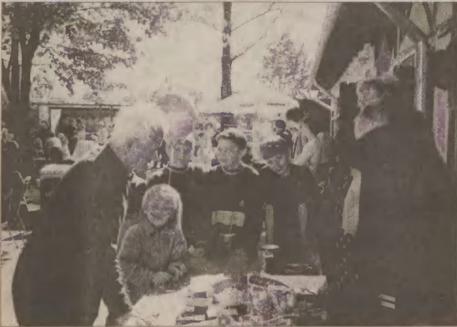
Stoisko z loterią fantową cieszyło się dużym zainteresowaniem.

Na festynie Stowarzyszenia Rodzin Wielodzietnych w Nowej Wsi Lęborskiej atrakcji nie brakowało. Były przysmaki, loteria, gry i zabawy. Pieniądże zebrane podczas imprezy trafią do rodzin najbardziej potrzebujących.