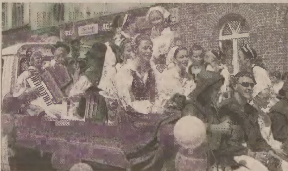
Przemarsz ulicami miasta.

W powiecie kościerskim tylko zakłady porcelany Lubiana mają ponad tysiąc pracowników, a więc, według norm unijnych, są dużym przedsiębiorstwem. Niegdyś Lubiana słynna