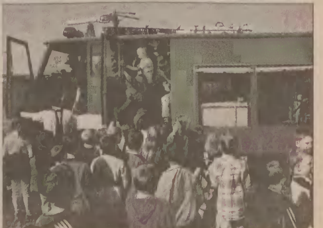
Dzieci wprost oblepiły wóz strażacki tak, że opiekunki nie mogły ich upilnować.