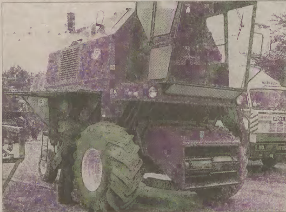
W zakładzie Dariusza Heringa mechanicy przygotowują kombajny do żniw.

- Do tegorocznych żniw przygotowałem dwa kombajny - mówi Dariusz Hering, właściciel Zakładu Usługowo-