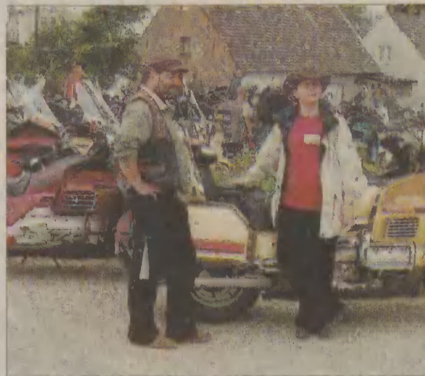
Nie można też było nie zauważyć wspaniałej parady motocyklistów z klubu Gold Wing Club of Poland.