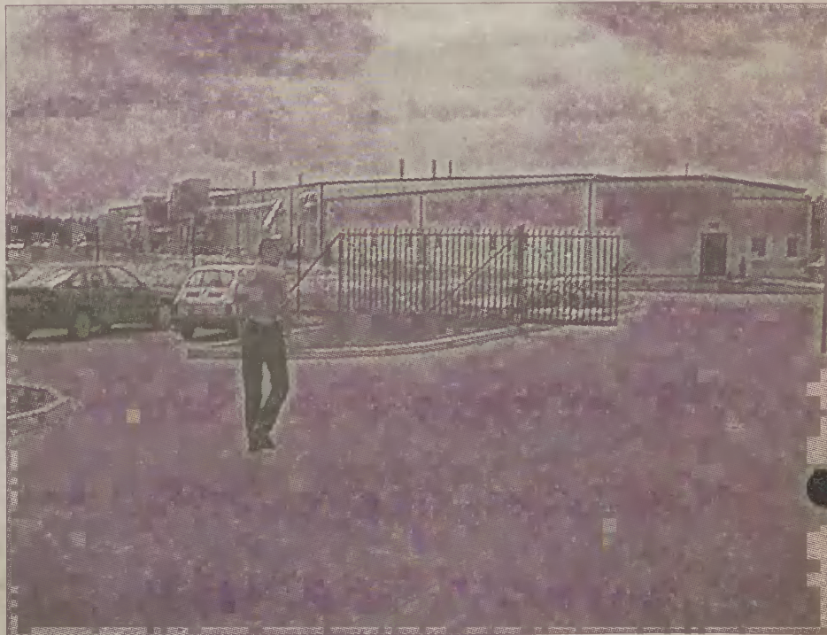
Z podmiasteczkiej Słupskiej Fabryki Mebli odejdą kolejni pracownicy.

Najprawdopodobniej większość ze zwolnionych osób przejdzie na przedemerytalne zasiłki. W SFM zatrudnienie znalazło wielu mieszkańców Miastka oraz okolic. W tym roku również miasteczki Urząd Pracy wy-