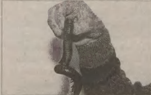
Kto będzie cierpliwy może policzyć, czy faktycznie krocionóg olbrzymi ma 288 nóg.

w większości żywią się świerszczami. Jedynie krocionóg olbrzymi, który posiada 288 nóg żywi się sałatą. Wart szczególnego przyjrzenia się jest także oryginalny stawonóg - straszak żywiący się liśćmi malin. Wystawę można oglądać do 10 sierpnia w godz. od 10 do 19. Bilet wstępu kosztuje 6 zł, ulgowy 4 zł, grupowy 3 zł. Na miejscu można kupić także ciekawe publikacje na temat eksponowanych zwierzątek. (isz)