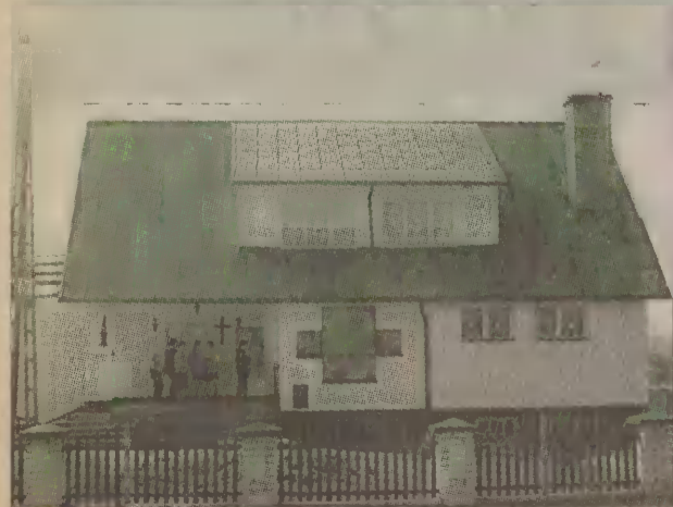
Kaszubskie Pater Noster w Kętrzynie.

Chleba najęgo powszednëgo dój nóm dzysò i odpùscë nóm naje winë, jak i më odpùscziwómë naszym winowajcóm. A nie dopuscë na nas pòkùszeniò, ale nas zbawi òde zlégò. Amen.