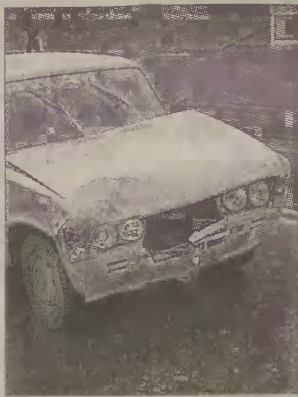
Kierowca tego Fiata był prawdopodobnie pod wpływem alkoholu.