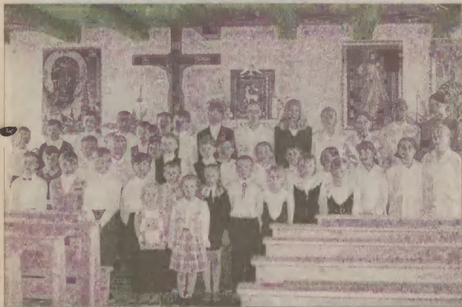
Dzieci ze Szkoły Podstawowej w Kętrzynie odmawiają „Ojce” nasz w języku swoich ojców.