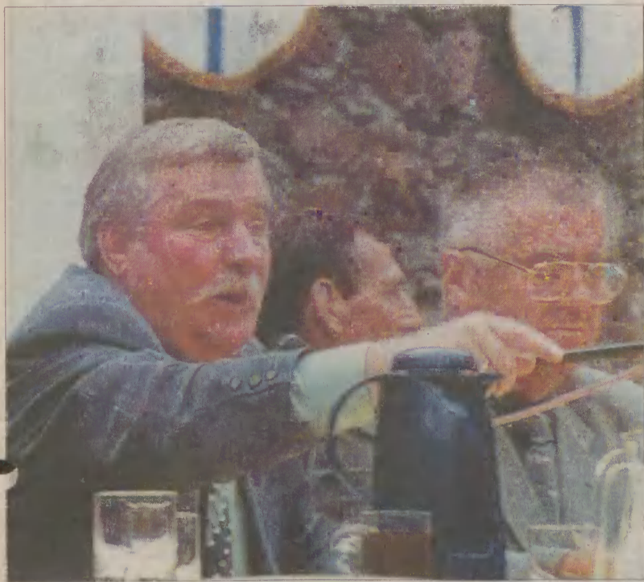
Momentami Lech Wałęsa musiał przekrzykiwać swoich dyskutantów....