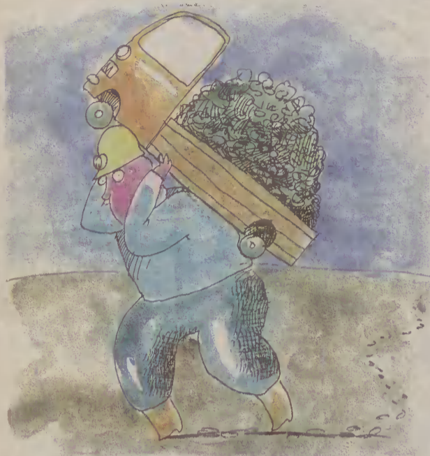
Rys. Bartłomiej Brosz

Latem i jesienią przyjezdni handlarze ze Śląska oferują mieszkańcom powiatu gdańskiego tani węgiel. Część ich klientów jest zadowolona, jednak są tacy, którzy padli ofiarą oszustwa. - Należy uważać - ostrzegają.