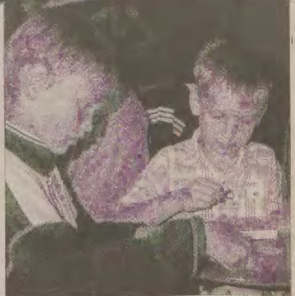
Chłopcy z zapalem malują papierowe serduszka.