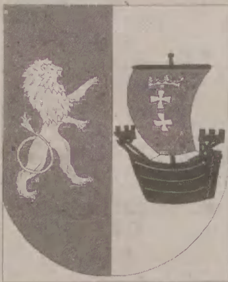
Herb powiatu gdańskiego