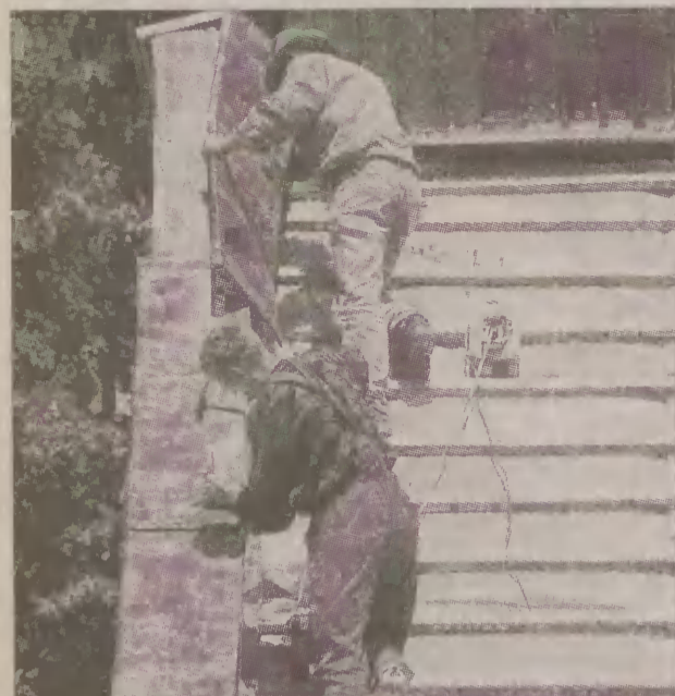
Dach zabytkowego kościoła w Kłodawie doczekał się remontu.