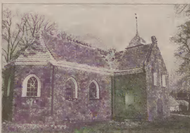
Kościół w Lublewie jest nie tylko piękny, ale niezwykle cenny.

Zbudowany w 1349 r. przez katolików, od 1562 r. stał się świątynią ewangelicką. Ciekawostką jest oryginalny zegar słoneczny z 1680r. Cenna jest również ambona z 1690 r. z podnoszonym siedziskiem dla pastora oraz chrzcielnica z cynową misą z 1641 roku. Ksiądz opowiada o nich ciekawie. Porusza nas