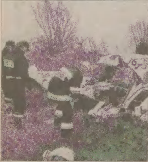
Wciąż trwają badania szczątków rozbitego samolotu.