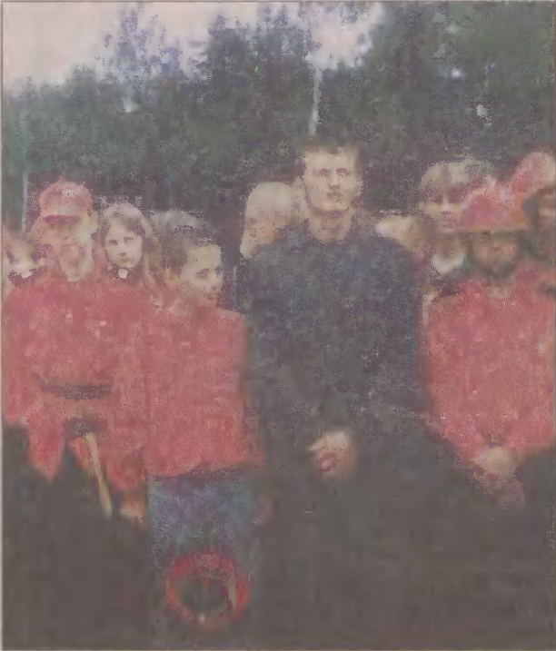
Młodzi strażacy z gminy Puck pokazali się z dobrej strony w Garczynie.