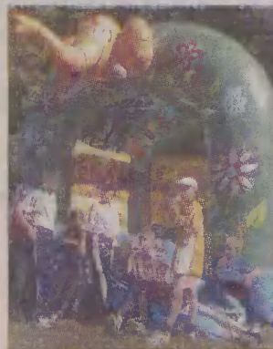
Zabawa w Celbowie