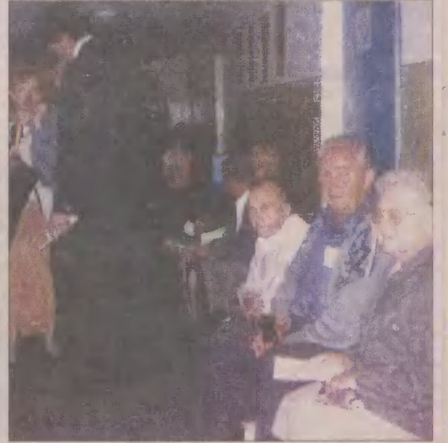
Kolejki przed gabinetami ustawiały się już od godzin przedpołudniowych.