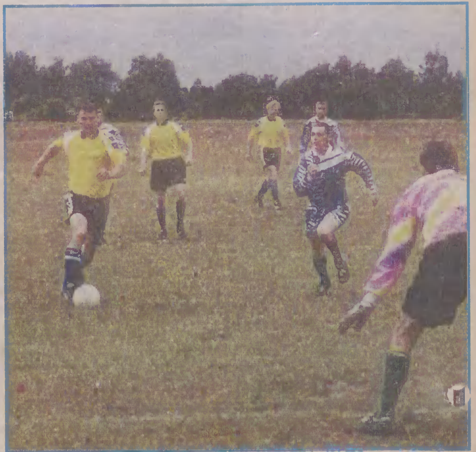
Piłkarze Jastrza zapewnili sobie awans już podczas meczu z Wierzhucinem.