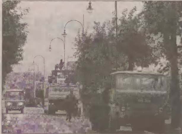
Nowy chodnik już służy mieszkańcom, lampy niedługo zaświecą.

Nowe lampy zaczną oświetlać ulice po zakończeniu inwestycji oraz przełączeniu instalacji