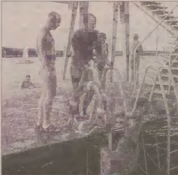
WOPR nie dopuścił do ofiar śmiertelnych na kąpieliskach. Na zdjęciu kąpielisko strzeżone w Charzykowach.

Jak powiedziała pani dyrektor, każdy przypadek roz-