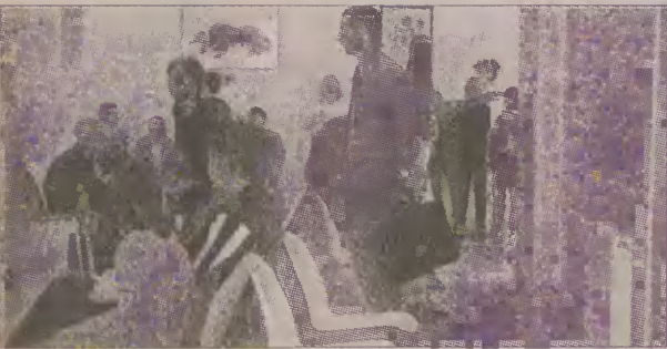
Przychodnia Miejska w Chojnicach ma stać się sprawnie działającym ośrodkiem zdrowia.