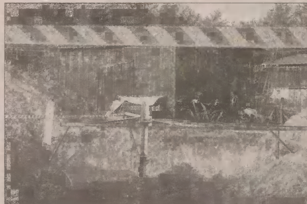
Pięć metrów od gospodarstwa Żychlińskiego wykopano dół pod przyszły maszt.