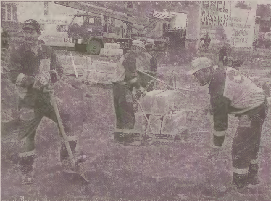
Trwają prace przy budowie pierwszego w Chojnicach skrzyżowania ulic: Szerokiej i Człuchowskiej.

Do końca tego roku zostanie udostępnione do ruchu rondo Człuchowska - Szeroka. Prace nad jego wykończeniem potrwać jednak do wiosny.