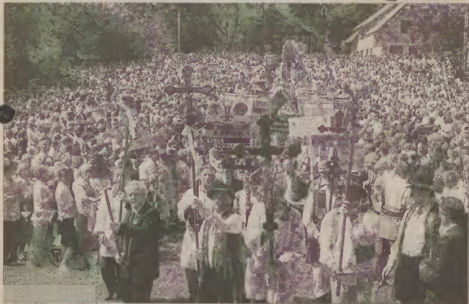
Tłumy wiernych przybyły w minioną niedzielę na odpust do Kaszubskiej Królowej do Sianowa.