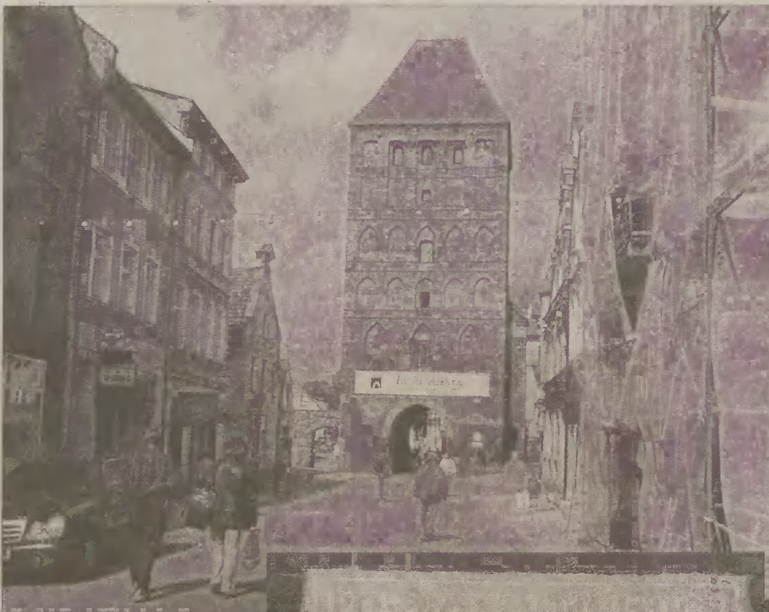
Przez Bramę Człuchowską do Chojnic wkraczały 31 stycznia 1920 r. wojska polskie.