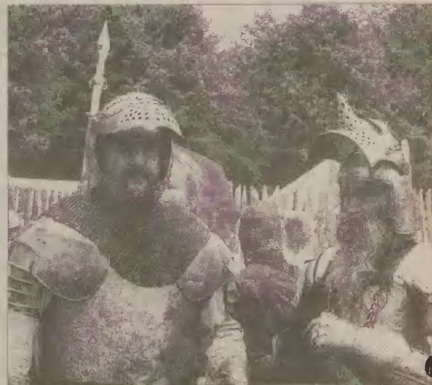
Starsi polscy woje byli pewni zwycięstwa.

Chojnicy Krzyżacy promowali swój region, powiewając flagą miasta. Obiecali, że za rok wrócą pod Grunwald i już na pewno będą walczyć.