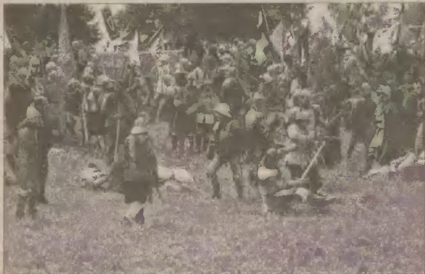
W bitwie uczestniczyli również członkowie człuchowskiego bractwa.