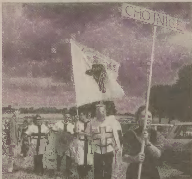
Chorągiew chojnicka w drodze na plac boju.