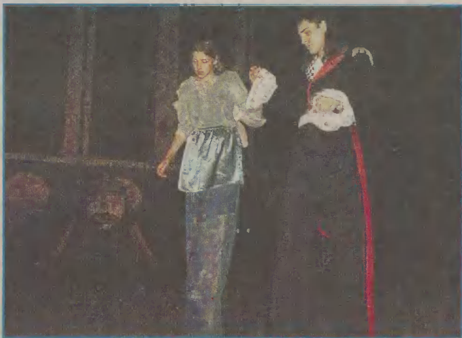
Artystyczne zmagania zapoczątkowały chojnickie cztery Żywioty.