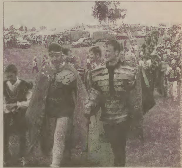
Nadciąga księżę Witold ze świtą.