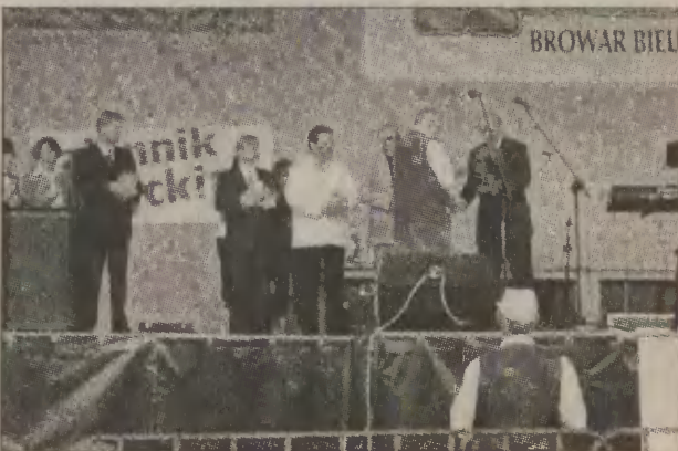
Nagrody wręcił marszałek Maciej Płażyński.