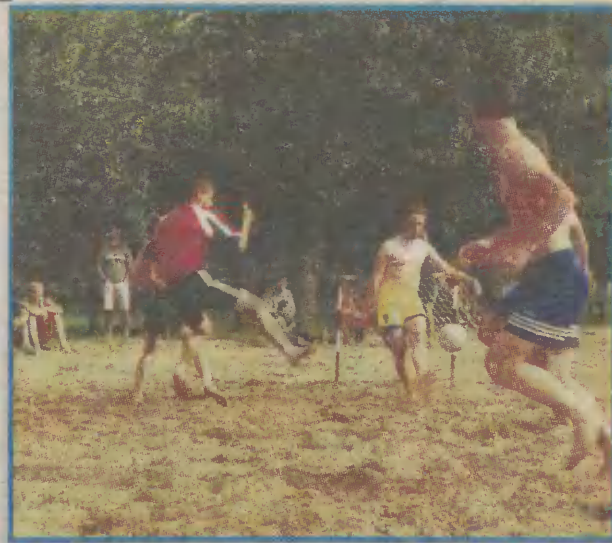
Na plaży w Charzykowach będzie można pograć w piłkę nożną.