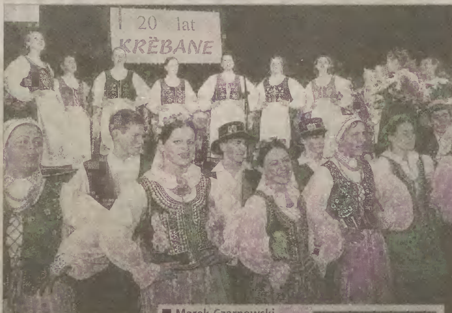
Gospodarzami festiwalu są bruskie Krebane.

Festiwal ma na celu promowanie kaszubskiej kultury, coroczne prezentacje przybliżają piękno i różnorodność kultury ludowej wszystkich zakątków kraju i świata. Najważniejszym zadaniem festiwalu jest nawiązanie współpracy między dziesięcioma gminami zaborskimi z trzech byłych województw: gdań-