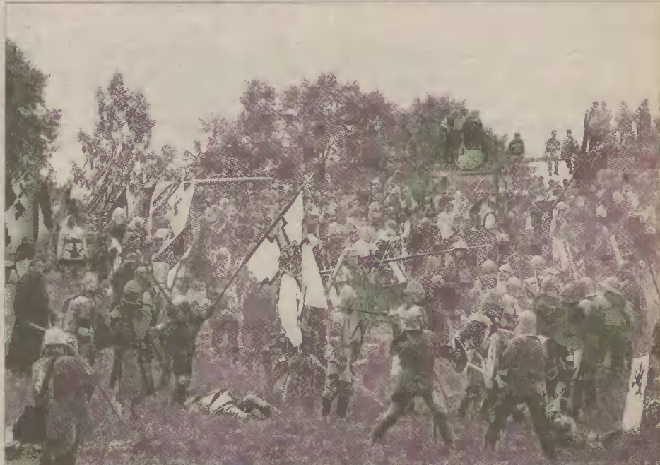
W pokazowej bitwie pod Grunwaldem uczestniczyło półtora tysiąca rycerzy.